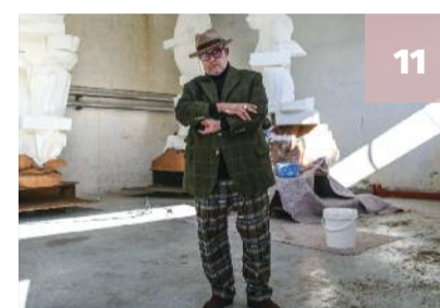
Museu do Louvre acolhe obras do português Cabrita Reis