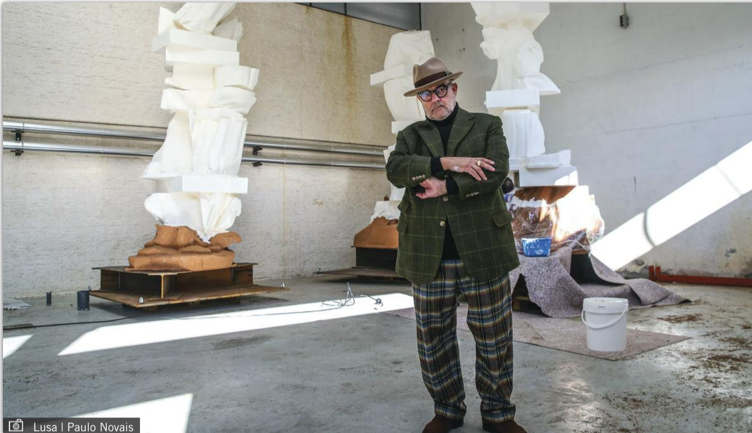
Lusa | Paulo Novais