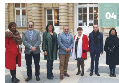
Dirigentes da Cívica no Senado francês para projetar o ano

Obras no Consulado serão o "projeto do ano"