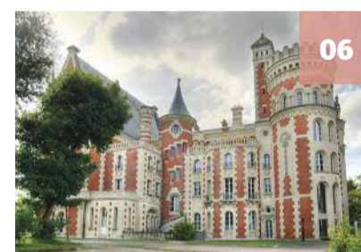
Abriram as inscrições para o Liceu Internacional de St Germain