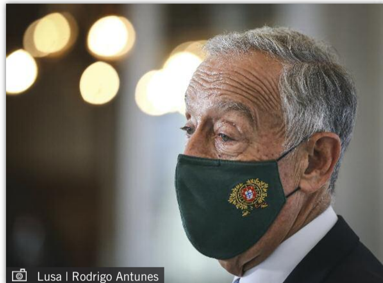
Lusa | Rodrigo Antunes

A polícia está agora a investigar o caso, tendo já divulgado que o motorista português havia assinalado às autoridades a presença de migrantes no seu camião antes do in-