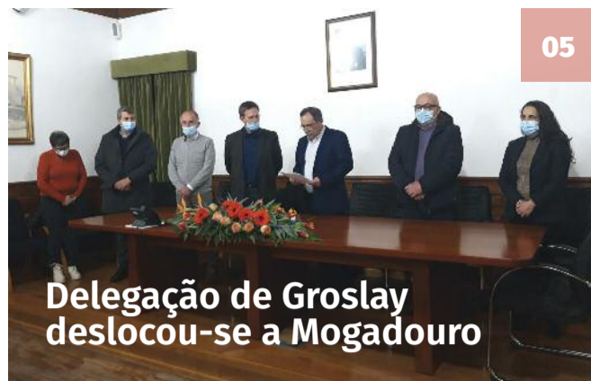
Delegação de Grosly deslocou-se a Mogadouro

O LusoJornal entrevistou os candidatos pelo círculo eleitoral da Europa às eleições Legislativas de 30 de janeiro. Os boletins de voto começaram a chegar pelo correio. Devem ser reenviados para Lisboa até ao dia 29 de janeiro (o carimbo dos correios 'valida' o voto) e devem chegar a Portugal imperativamente até dia 9 de fevereiro.