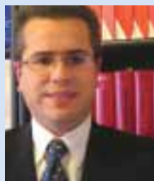
par Maître José Coelho