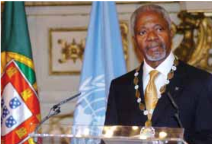
Kofi Annan, ex-Secretário-Geral da ONU

sável. Esta cerimónia, organizada pelo Centro Norte-Sul do Conselho da Europa, com sede em Lisboa, e pela Assembleia da República portuguesa, terá lugar no Palácio de São Bento, em Lisboa, no dia 1 de Abril, às 18:00. O evento contará com a pre-