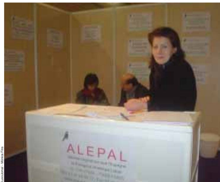
■ Stand de l'Alepal au Salon de l'Éducation