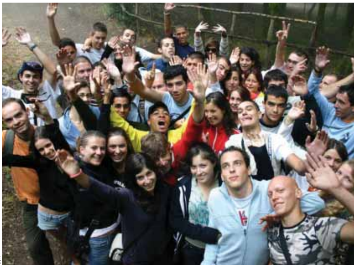
■ Jeunes d'origine portugaise réunis au Portugal par la CCPF

La 1ère Université d'Été de la CCPF se présente comme un espace de temps durant lequel les dirigeants associatifs pourront partager leurs expériences, acquérir de nouvelles connaissances, trouver des réponses aux principales