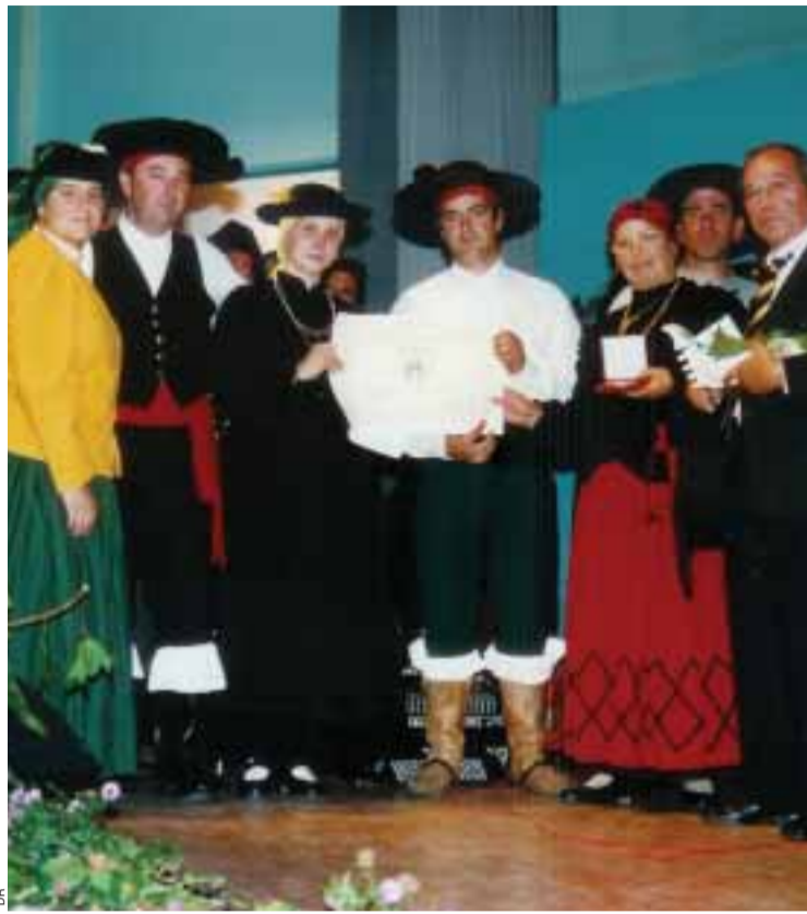
■ Grupo folclórico Estrelas do Benfica de Achères

Quanto ao Festival de folclore, no sábado, dia 29, a partir das 20h30, os grupos actuarão, mostrando as diversas regiões de Portugal: o Alto Minho estará representado pelos grupos Alegria do Minho de Plaisir, Flores do Lima de Bourges e Portugal Novo de Colombes; a Alta Estremadura estará presente com o grupo Alegria dos Emigrantes de Montfermeil. Finalmente,