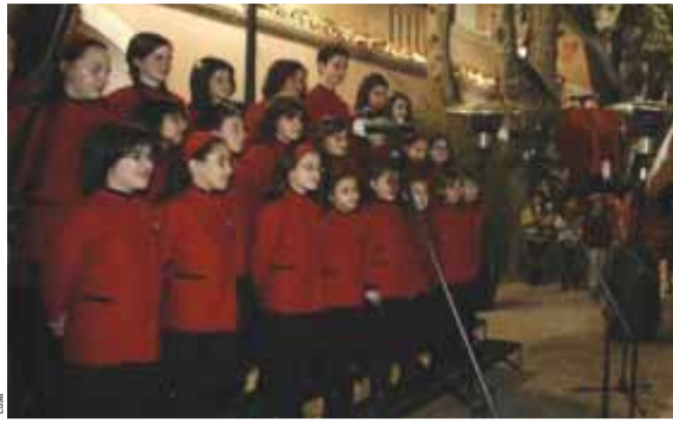
Pequenos cantores da Maia