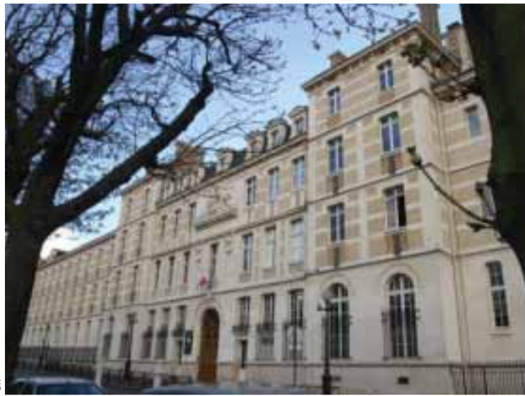
■ Lycée Montaigne, à Paris

En tout état de cause, il faut aussi impérativement remplir les dossiers académiques qui vous seront transmis dans votre établissement d'origine. Toutes les réponses aux familles concernant cette convocation ou non aux épreuves de langues seront expédiées par courrier en temps et heure. Aucune réponse ne sera communiquée par téléphone.