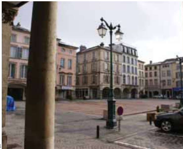
Centre ville d'Epinal (Vosges)

foyers du 3 ème âge dégusteront un repas portugais.