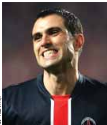
Pedro Pauleta (PSG)

Superado do problema da coxa esquerda, que o afastou dos últimos dois jogos para o Campeonato, o capitão Pedro Pauleta regressou ao onze inicial para o jogo da final da Taça da Liga de França entre PSG-Lens, final que teve lugar no passado sábado no Stade de France, e que o PSG venceu (2-1), com Pauleta perante oitenta mil espectadores a abrir o caminho para a vitória aos 19 minutos, sendo substituído aos 65 por Luyindula após ter sentido o regresso de dores na coxa esquerda. Uma final cheia de emo-