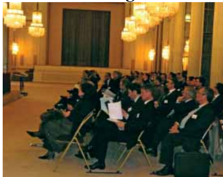
■ Plus de 80 entrepreneurs à la 2 me Assemblée Générale de la CCIFP

Avec un sentiment d'optimisme, les membres ont appris qu'à cette stratégie d'expansion s'associera un renforcement de la stratégie de communication de l'institution. «L'importance réelle de la CCIFP a été jusqu'à présent été bien com-