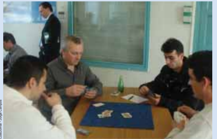
■ Jogadores durante o campeonato, este fim-de-semana