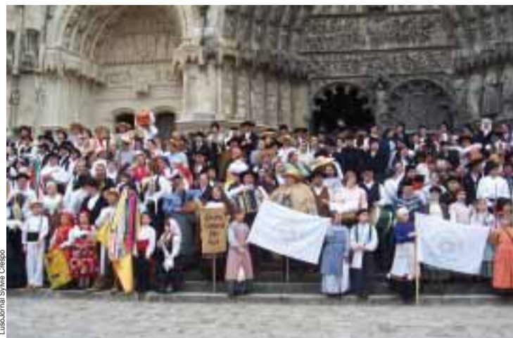
Alguns dos grupos em frente da Catedral de Bourges