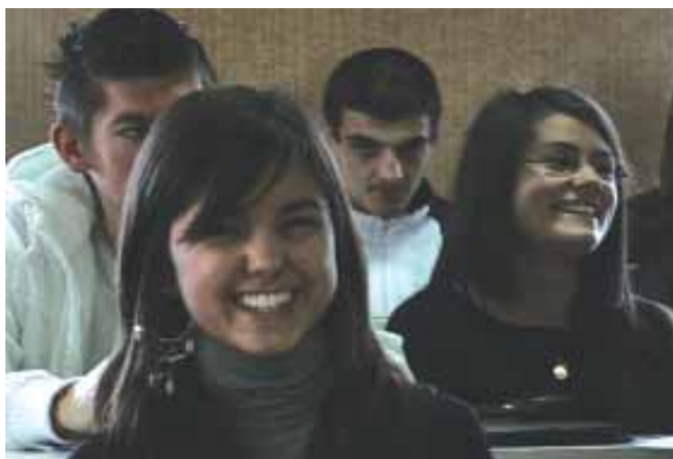
Alunos do ILCP