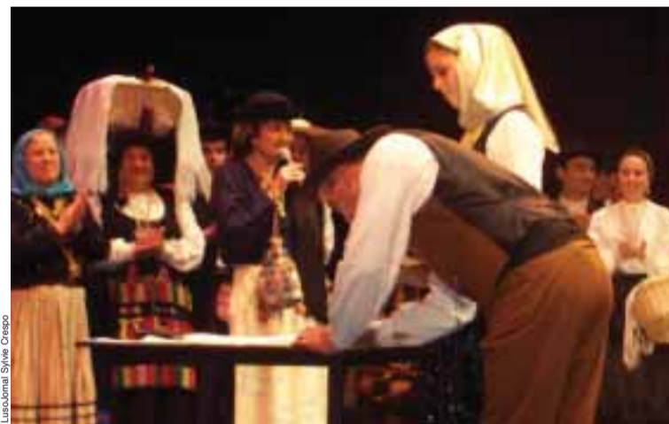
Momento de assinatura da adesão à Federação de Folclore Português

O grupo folclórico Lembranças de Portugal de Montataire, é desde domingo passado membro efectivo da Federação de Folclore Português ao receber o diploma que lhe confere esta adesão. A cerimónia decorreu durante o Festival que a Federação organizou em Bourges no fim-de-semana passado.