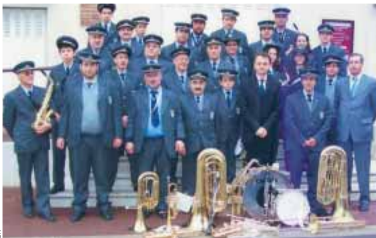
■ Banda filarmónica Portuguesa de Paris

acolhia-os como secção da sua associação. A 20 de Março de 1988 actuam pela primeira vez no seio da ACTP 8/17 no 1º aniversário desta associação.