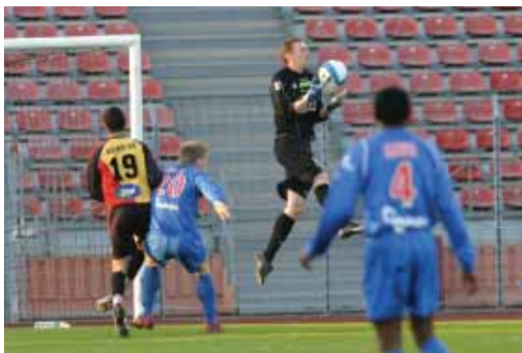
■ O Créteil/Lusitanos ganhou 4-2 ao Choisy-le-Roi

Guedioura igualou aos 24 min, para Abwo já em cima do intervalo, aos 45 min, abriu o caminho para a