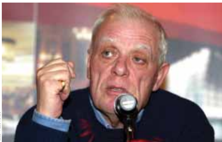
António Lobo Antunes

António Lobo Antunes formou-se, casou-se e foi imediatamente enviado para Angola, fazer o serviço militar. Passou vinte e sete meses no ato-