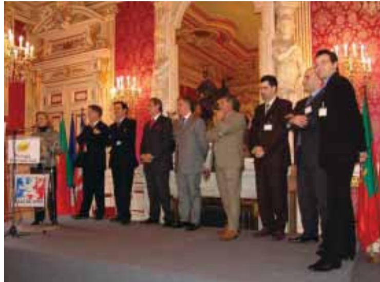
■ Lançamento do Portugal Business Club, na Mairie de Lyon

Les moyens pour créer ce «catalyseur» d'énergie: Une réunion mensuelle, où les adhérents se retrou-