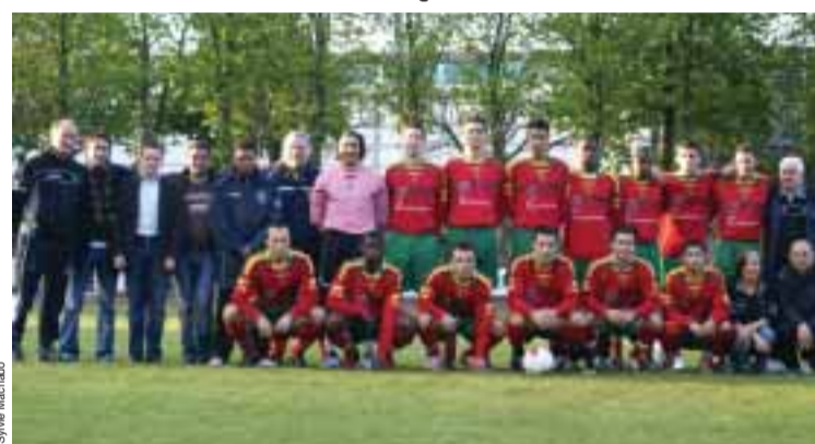
■ O Lusitanos de Saint Maur perdeu em casa com o Choisy-le-Roi

Em jogo antecipado da 22ª jornada e que teve lugar no passado sábado ao fim da tarde no estádio Chéron em St Maur, os Lusitanos longe