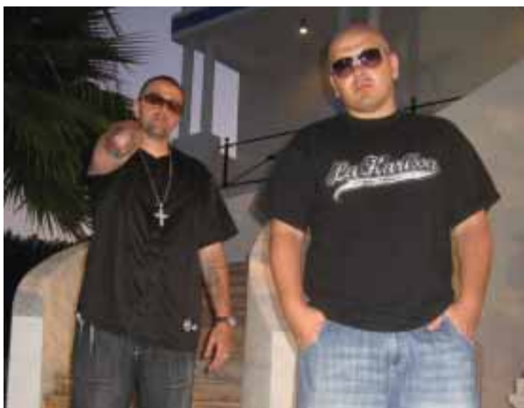
Le Groupe «La Harissa»

La Harissa, se sont ceux qui ont inventé le «rap portugais-émigrant»