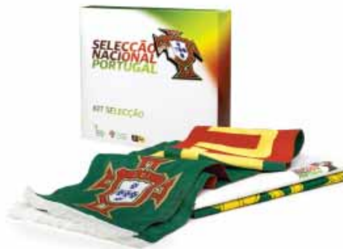
■ Campanha do BES com a Seleção de Portugal

reito a "bilhetes de sócio", ou seja, com desconto, nos jogos da Seleção que se disputem em Portugal. Terão também direito a uma reserva exclusiva de bilhetes nos jogos em casa. Adicionalmente, o BES irá promover de imediato ao sorteio diário de camisolas oficiais para todos aqueles que até ao final de Junho se fa-