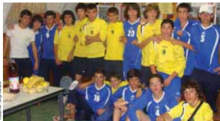
Equipa do FC Paços de Ferreira

O «Challenge Piana» internacional de futebol decorreu em Neuville (69) nos dias 10, 11 e 12 de Maio, organizado pelo Club Sportif Neuillois. A associação Cultural e Desportiva de Neuville participou neste Torneio como organizadora e a seu convite a equipa dos ‘menos de quinze anos’ do Futebol Club de Paços de Ferreira participou também neste Torneio.