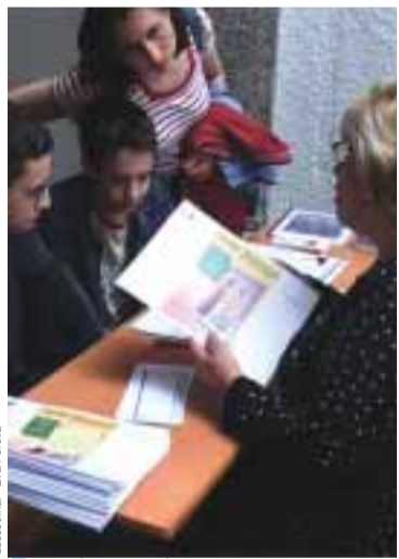
■ Jornada Portas Abertas no ILCP

Este fim-de-semana decorreu no ILCP, Instituto de Língua e Cultura Portuguesa em Lyon, mais uma jornada «Portas Abertas».