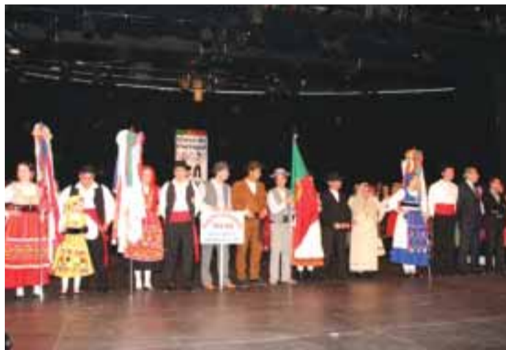
■ Grupos no Festival de Andorra

O Grupo Folclórico dos Portugueses de Riom (cidade perto de Clermont-Ferrand) deslocou-se a Andorra no dia 3 de Maio para participar no 12.º Aniversário do Grupo de Folclore da Casa de Portugal. Este grupo fechou com chave de ouro o ponto alto das celebrações, no Complexo Sócio Cultural de Encamp, onde, para além do grupo anfitrião, foram também convidados o Rancho Folclórico de Tavira e o Rancho Folclórico da Casa do Benfica de Andorra.