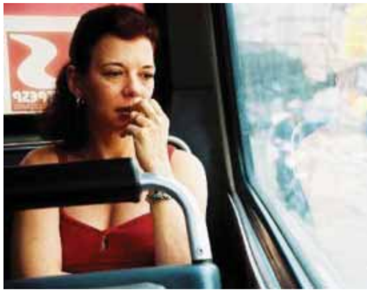
■ A Casa de Alice

O filme passa-se nos subúrbios de S. Paulo, no apartamento de Dona Jacira, mãe de Alice, com quem ela vive mais o marido, quase sempre ausente, e os três filhos que evoluem ao deus-dará. É Dona Jacira que faz todo o trabalho em casa e é tratada sem consideração por parte do genro e netos.