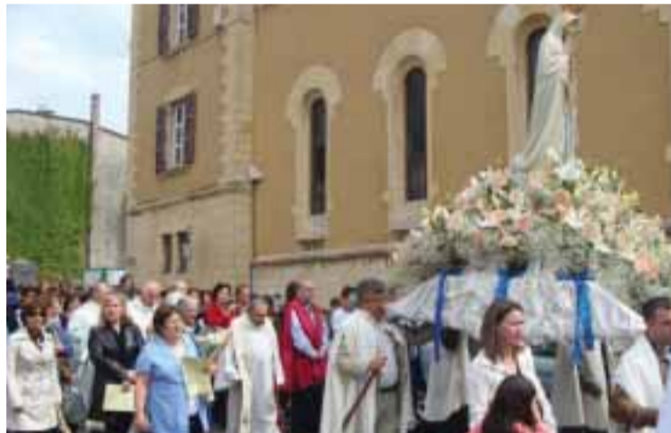
■ Procissão em Lyon

No fim-de-semana passado, dias 17 e 18 de Maio, o Conselho Pastoral e a Comissão de Fátima/Fourvière organizaram a peregrinação anual em honra de Nossa Senhora de Fátima.