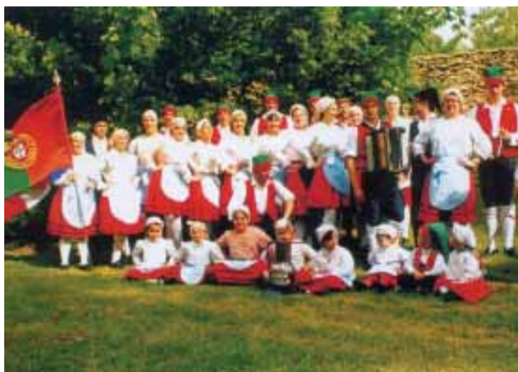
■ Grupo de folclore de Chaville