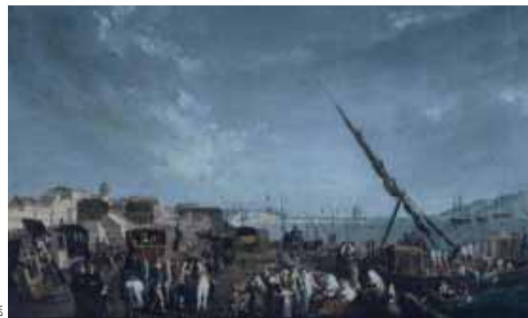
Partida da Corte de Portugal rumo ao Brasil

D. João assina um acordo secreto com Londres pelo qual o Governo português ficava sob a protecção de George III. Napoleão furioso, perante "aquele insolente pequeno país que ousava fazer-lhe frente", orde-