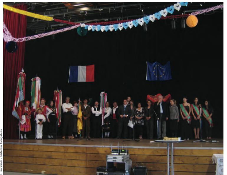
► Palco da sala Gallion em Gerzat

O tempo no passado domingo estava cinzento e muito chuvoso na região de Clermont-Ferrand, mas para aqueles que decidiram ao Festival Folclórico dos Camponeses Minhotos nem tiveram tempo de pensar na chuva. A tarde foi dedicada ao folclore na sala Gallion, em Gerzat, cidade geminada com Ataíde.