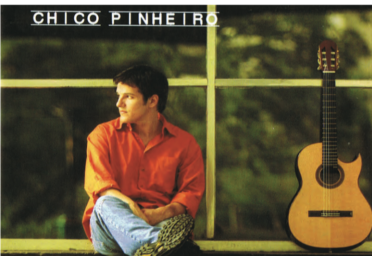
► Chico Pinheiro

No passado dia 21 de Maio, o cantor brasileiro, Chico Pinheiro, esteve em concerto no Studio de l'Ermitage em Paris. Chico Pinheiro apresentou o seu segundo álbum 'Chico Pinheiro' editado pela Biscoito Fino/DG Diffusion. O artista propõe-nos um repertório rico e subtil, principalmente constituído de músicas da sua autoria, revelando assim o seu talento de compositor. O CD já saiu em 2005, mas só agora iniciou a sua tournée na Europa. O álbum foi festejado pela imprensa e pelo público e incluído novamente nas listas dos "Melhores do ano" pelos três maiores jornais do país, além de receber belíssimas críticas na Europa. O cd teve participações de João Bosco, Luciana Alves e Tati Parra. As canções põem em relevo a voz de Luciana Alves e de Chico Pinheiro, sem esquecer obviamente o seu toque de guitarra incomparável que levou alguns críticos a considerá-lo como o melhor guitarrista brasileiro actual.