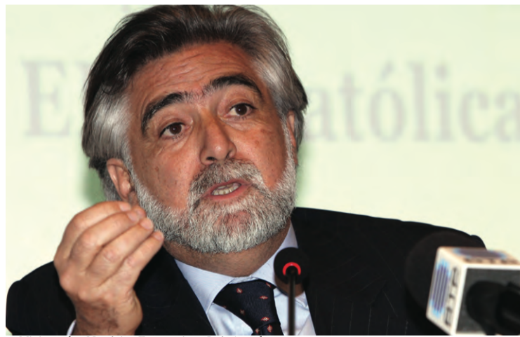
▶ Ministro dos Negócios Estrangeiros, Luís Amado

Questionado pelo Deputado comunista Jorge Machado sobre a divulgação dos resultados das eleições, que se realizaram a 20 de Abril, o Ministro explicou que ela só não aconteceu ainda porque os resultados ainda não estão disponíveis. "Se não estão no 'site' (do Ministério dos Negócios Estrangeiros) é porque ainda não estão disponíveis. Estão a ser apreciadas as queixas e reclama-