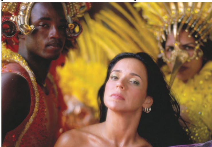
► Daniela Mercury vai cantar em Paris

Daniela é uma cantora que, além dos cuidados com a voz, supervi-