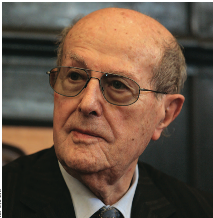
→ Manoel de Oliveira foi homenageado em Cannes

Manoel de Oliveira mantém uma relação muito próxima com o cinema francês, com co-produções