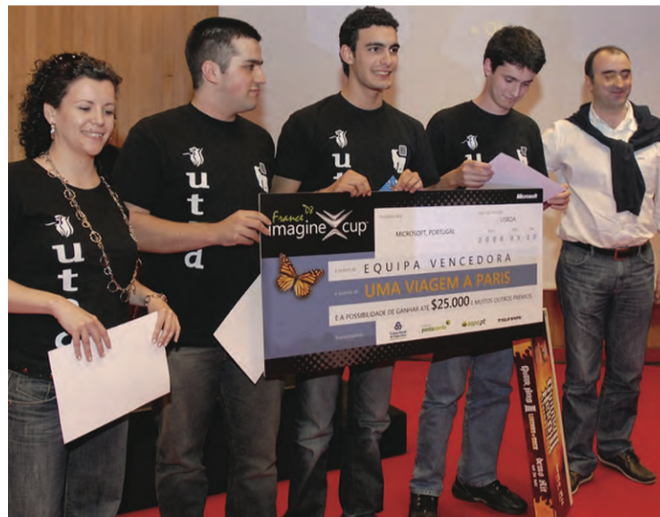
Equipa da UTAD ganhou viagem até Paris

Esta foi a oportunidade para os estudantes desafiarem as suas competências técnicas e criativas, usando o poder da tecnologia para resolver os problemas do mundo. A equipa vencedora, da Universidade de Trás os Montes e Alto Douro, com projecto na área da reutilização de materiais recicláveis, em particular da reciclagem de óleo alimentar, irá representar Portugal na final mundial. Este ano, o desafio proposto aos participantes passa pelo uso de tecnologia e o meio de ajudar a proteger o Ambiente, num lema "Imagina um mundo onde a tecnologia