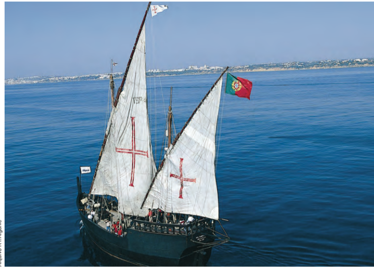
→ Caravela Boa Esperança, tem promovido o Algarve em vários eventos

A embarcação “Boa Esperança” é uma réplica aproximada de uma caravela dos Descobrimentos, construída por especialistas de construção naval e de acordo com o que se sabe das regras da construção naval daquele tempo, mas tendo em atenção as questões de segurança e conforto de hoje em dia.