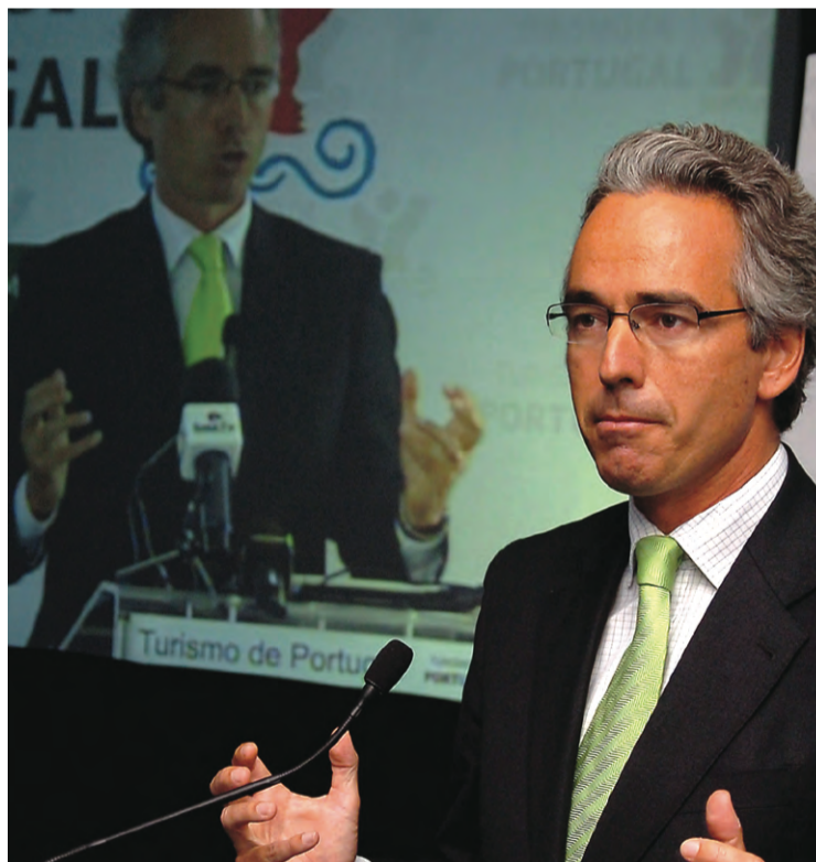
Secretário de Estado do Turismo, Bernardo Trindade

No que respeita ao desempenho do turismo algarvio para 2008, Bernardo Trindade previu que o