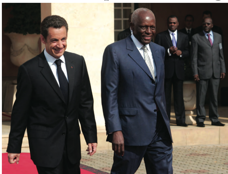
► Nicolas Sarkozy com o Presidente de Angola, José Eduardo dos Santos