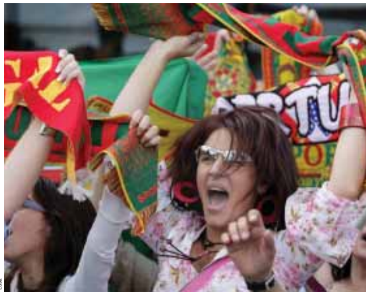
Os Portugueses apoiam a Seleção

No próximo dia 7 de Junho, às 19h45, a equipa nacional portuguesa jogará o seu primeiro jogo do Euro 2008, na Suíça.