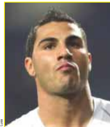
Ricardo Quaresma, Meio campo

21 anos, Manchester United, 12 Internacionalizações. 1 gol pela Selecção. Estreia na Selecção a 01/09/2006. Nenhuma presença em fases finais de Europeus e Mundiais. 9 jogos na qualificação. Nani surgiu na Selecção portuguesa em período de ressaca do Campeonato do Mundo de 2006, tornando-se presença regular.