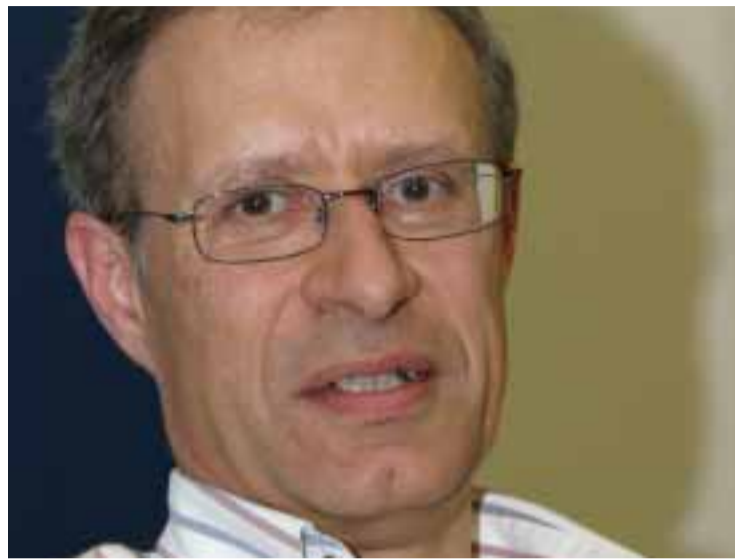
Francisco Louçã em Paris

Considera o líder bloquista que apesar da política de Sarkozy já não afectar os emigrantes portugueses "porque somos europeus, é contudo a altura de lutar contra esta cultura de discriminação que afecta sempre os mais pobres. É relevante a defesa do direito do trabalhador emigrante contra as