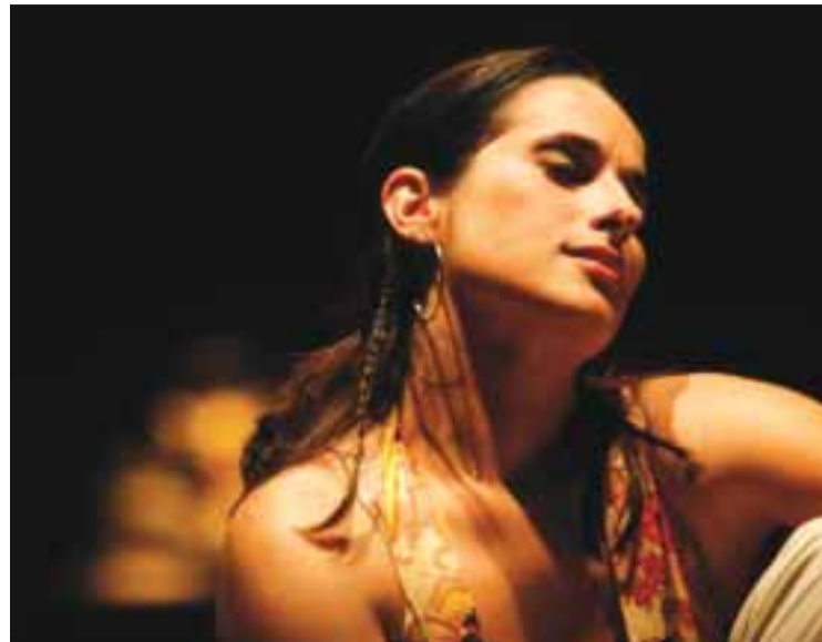
■ Cristina Branco vai cantar no Théâtre du Châtelet