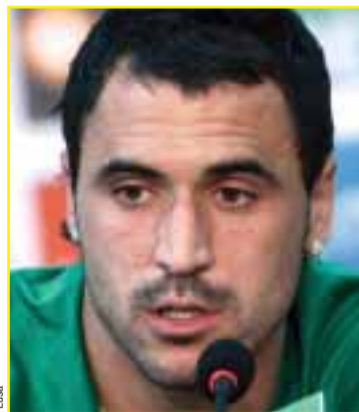
Hugo Almeida, Atacante

31 anos, Benfica, 68 Internacionalizações. 28 golos pela Selecção. Estreia na Selecção a 24/01/1996. 4 presenças em fases finais de Europeus e Mundiais. 10 jogos na qualificação. Referência incontornável no leque de opção para o ataque de Selecção nacional, Nuno Gomes chegou ao grupo há 12 anos, cotando-se como o elemento com maior experiência de quinas ao peito.