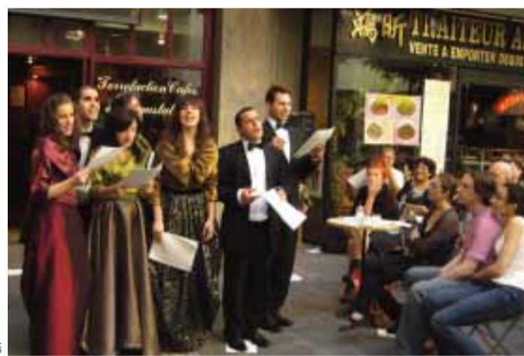
■ Companhia de teatro Cá e Lá

Sábado 14 de Junho , às 18h30, "Quando a poesia evoca o cinema".