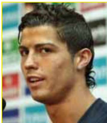
Cristiano Ronaldo, Atacante

30 anos, Barcelona, 52 Internacionalizações. 3 golos pela Selecção. Estreia na Selecção a 29/03/2003. 2 presenças em fases finais de Europeus e Mundiais. 10 jogos na qualificação. Deco foi primeira arma luso-brasileira utilizada no legado de Scolari e pegou de estaca no onze da Selecção portuguesa. Estreou-se frente ao Brasil que o viu nascer.