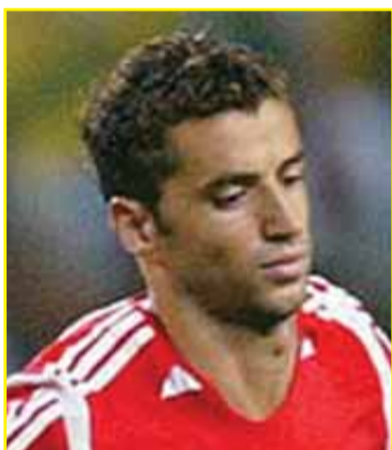
Simão, Meio campo

23 anos, Manchester United, 54 Internacionalizações. 20 golos pela Selecção. Estreia na Selecção a 20/08/2003. 2 presenças em fases finais de Europeus e Mundiais. 13 jogos na qualificação. Actual estandarte da Selecção, Cristiano Ronaldo foi fundamental no Euro-2004 e todos adeptos esperam que apresente os índices elevados que o acompanham.