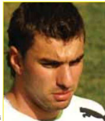
Rui Patrício, Guarda-Redes

32 anos, Benfica, 25 internacionalizações. Estreia na Seleção a 18/08/1999. 3 presenças em fases finais de Europeus e Mundiais. Quim é um dos elementos mais antigos no seio da seleção nacional, onde chegou em 1999. Entre Sporting de Braga e Benfica, o guarda-redes foi crescendo em termos competitivo.