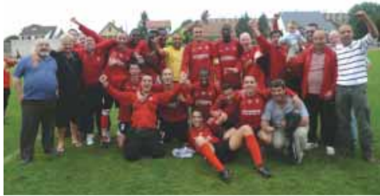
Portugueses de Goussainville festejaram vitória

No cair do pano de mais uma época futebolística do Campeonato francês amador 2007/2008 e em relação às equipas luso-gaulesas que LusoJornal teve acesso e que acompanhou ao longo da temporada, as honras vão para os Portugueses de Goussainville que no Campeonato de Promoção de Honra do (Grupo B) da Liga de Paris, Lusitanos de Saint Maur (b) na 1ª Divisão do Val de Marne (Grupo B) e Sporting Clube de Paris (Futsal), que conquistaram os respectivos Campeonatos. O primeiro subiu à Divisão de Honra Regional (DHR) da Liga de Paris, o segundo ao