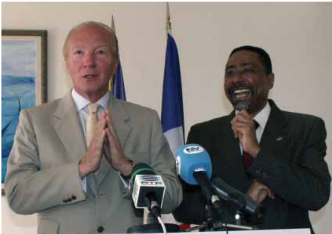
■ Brice Hortefeux em Cabo Verde com o Ministro dos Negócios Estrangeiros Victor Borges

A França preside à União Europeia no segundo semestre deste ano e vai organizar a 20 e 21 de Outubro, em Paris, uma conferência euro-africana sobre as migrações e o desenvolvimento, no se-