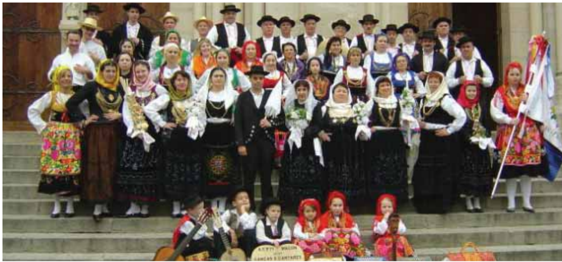
■ Groupe folklorique de Macon

Le groupe représente la région de Viana do Castelo. Il est composé d'une quarantaine de personnes de 4 à 70 ans. Ils se réunissent tous les samedis soirs à partir de 20h30 dans une salle située Parc de l'Abîme à Mâcon pour les répétitions de danse et de musique. «L'activité de l'association est essentiellement le folklore. Nous faisons des sorties afin de faire découvrir ou tout simplement remémorer les danses, les