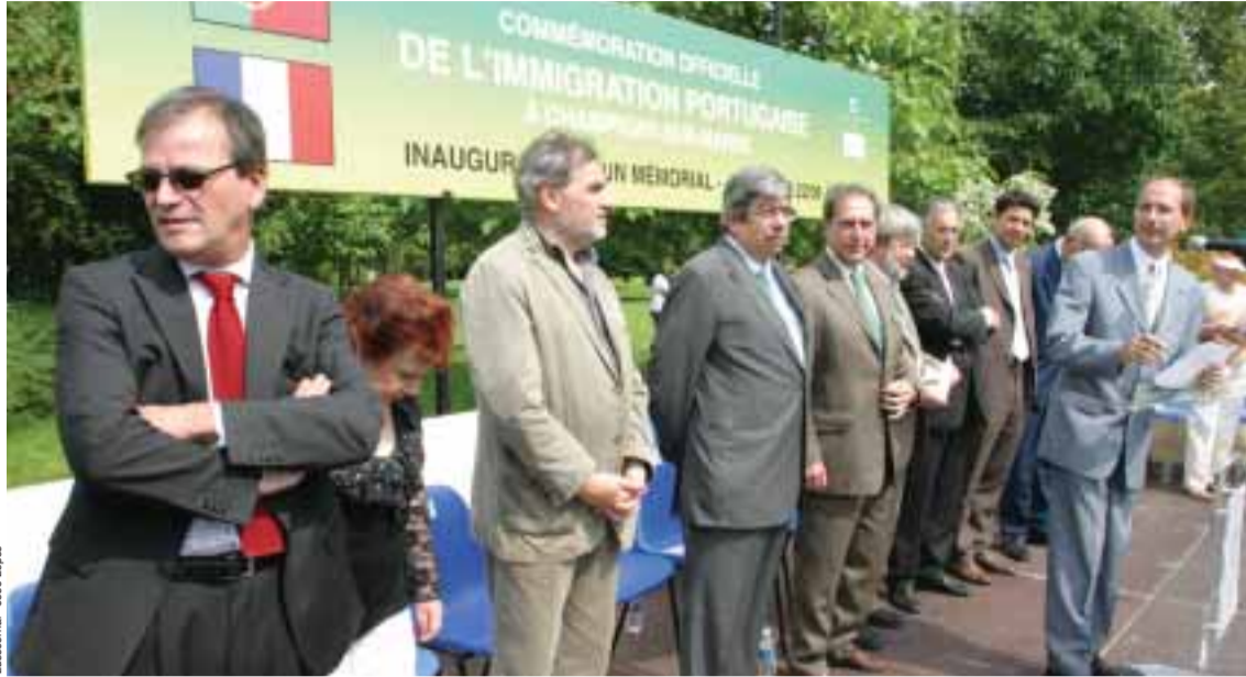
Aspecto da tribuna oficial, presidida pelo Embaixador António Monteiro e onde também está Ferro Rodrigues e João Teotónio Pereira

No domingo passado, dia 22 de Junho, foi inaugurado um Memorial de homenagem aos portugueses de França, no Parc Départementale du Plateau, no sítio onde entre os anos 1956 e 1974, estava o maior bairro de lata da Europa.