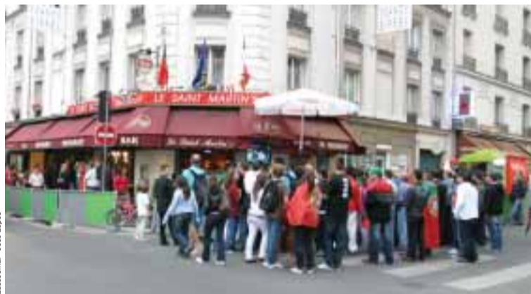
■ Com a falta de ecrãs gigantes em Paris, os Portugueses recorreram aos cafés

Milhares foram os Portugueses que na passada quinta-feira 19 de Junho não puderam deslocar-se ao estádio para assistir aos quar-