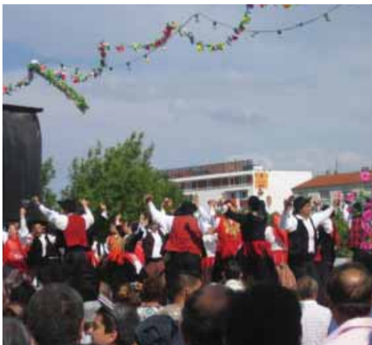
■ Um dos grupos folclóricos na Festa de S. João em Clermont-Ferrand