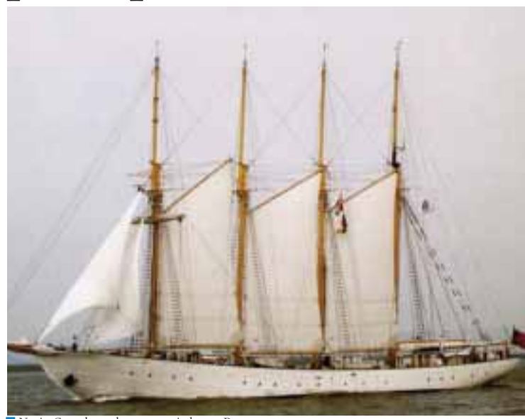
Navio Creoula pode ser apreciado em Rouen

Enquanto bacalhoeiro, o Creoula efectuou 37 campanhas de pesca, até 1973, e navegou o equivalente a mais de dez viagens à volta do mundo. Trouxe para Portugal cer-