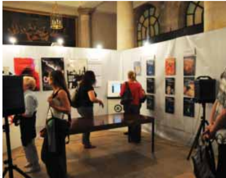
L’exposition-concert à Paris (1 er ) à l’église Sainte Eustache

Ce magazine à pour but d’analyser la culture d’aujourd’hui avec des notions philosophiques en essayant