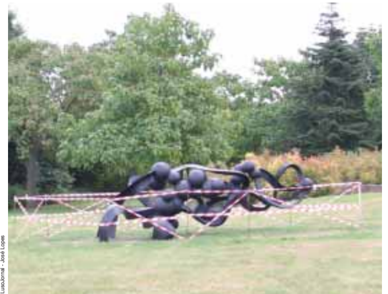
■ Monumento ao emigrante português: derrubado pelo vento?

O Memorial de homenagem aos emigrantes portugueses que recentemente foi inaugurado, com pompa e circunstância em Champigny-sur-Marne está no chão desde a semana passada. Oficialmente, a escultura “caiu devido ao vento”. Várias fontes dão esta “versão oficial” citando a Embaixada de Portugal em França e a Mairie de Champigny. Neste caso, é o trabalho do escultor português Rui Chafes que está em causa por ter escolhido materiais (ferro) demasiado frágeis. É certo que na semana passada o vento soprou com força na região parisiense, mas não se conhecem rajadas causando acidentes com outras estátuas na região. Por isso, também há quem diga, em Champigny, que o monumento foi derrubado, até porque também foram arrancadas as placas que explicavam porque razão o monumento tinha sido erguido. “As placas não caíram com o vento”... dizem os portugueses que comentam o assunto nas conversas de café. E não se excluem duas possibilidades: por um lado, pode haver habitantes de Champigny que não queiram ver o monumento a homenagear