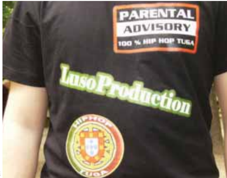
■ Logotipo da LusoProduction

Puis en août 2006, alors âgé de 19 ans, Michel Aires se lance dans une aventure accompagné de certains proches: en effet, il décide de créer «LusoProduction».