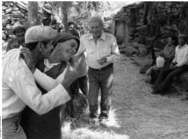
■ Uma das fotografias expostas no Museu da Imagem de Braga