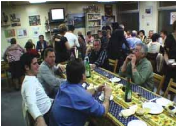
■ Jantar e boa disposição na associação de Ecully, perto de Lyon

Com a aproximação das Festas dos Santos populares sente-se a excitação do momento tão esperado, passam as romarias, e nada como um almoço com os amigos para queimar os últimos dias que antecedem o tão esperado momento... "Et voilà!" Chegaram as férias, esses tão mercedos dias de repouso que nos transportam até à família que aguarda em Portugal a chegada dos seus entes queridos. É verdade, elas estão aí e com elas o regresso às origens. E é assim que, todos os anos, a associação portuguesa da cidade de