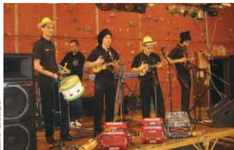
■ Grupo de cantares ao desafio, As Sardinhas, de Riom

O grupo de cantares ao desafio As Sardinhas foi criado recentemente em Riom (63). A ideia nasceu à volta de uma sardinhada e daí veio o nome do grupo. A especialidade é a música tradicional portuguesa e os cantares ao desafio.