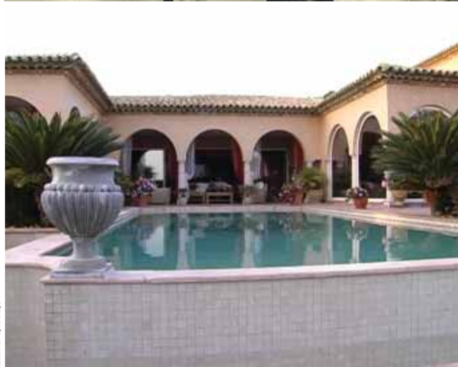
LusoJornal - Sylvie Crespo

O português que constrói casas de luxo na bacia de St. Tropez