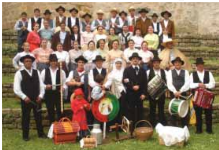
■ Grupo folclórico Os Beirões Alegres

Esta associação é sem dúvida muito dinâmica, talvez devido à juventude que a compõe. Também está virada para as exposições sobre Portugal e sobre os portugueses, assim como para festivais de música portuguesa... Se no resto da França se dá pouca importância ao ensino, aqui a associação conseguiu dinamizar