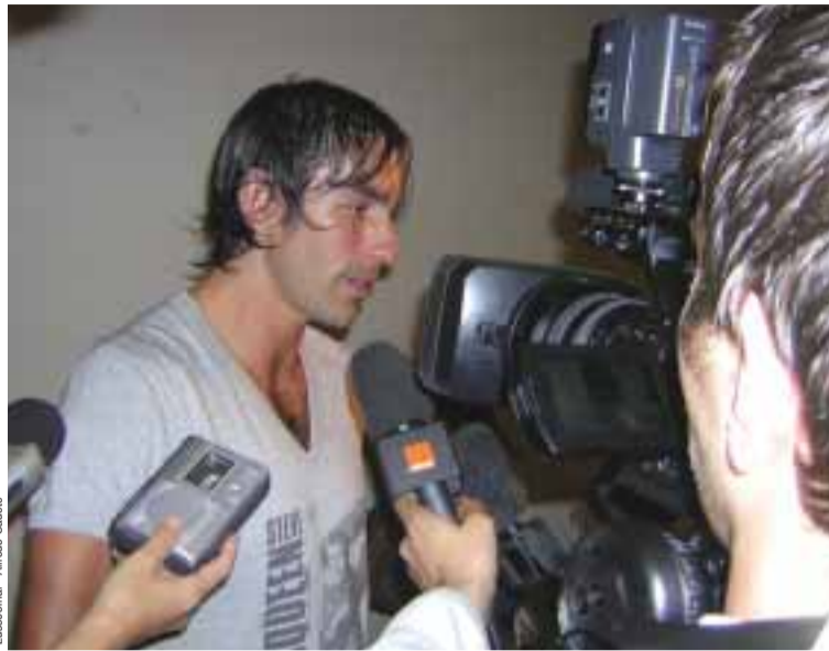
■ Robert Pires, depois do jogo no Stade de France

Quanto ao encontro entre as duas Selecções que começou sob os aplausos de oitenta mil espectado-