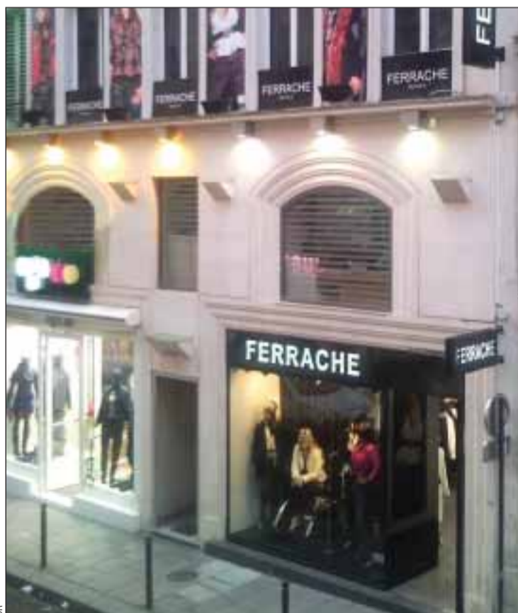
Loja da Ferrache em Paris