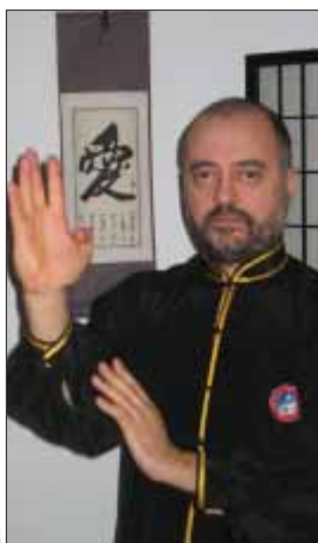
DR Abilio Manuel Monteiro

O órgão vital a cuidar e que fica particularmente vulnerável na estação do Outono é o pulmão. Esta visão holística do indivíduo de-