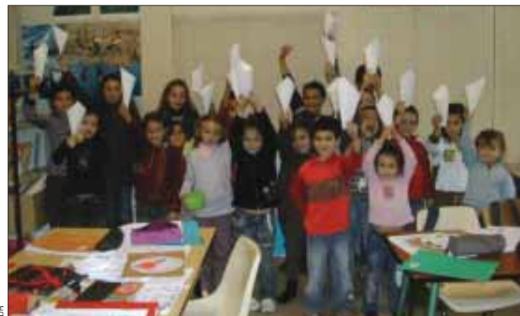
Alunos de português em Valence, revivem tradições portuguesas

■ A Associação de Pais do Curso de Português