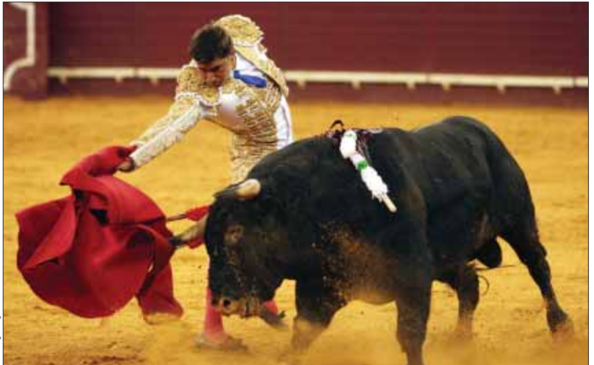
O toureador face ao touro