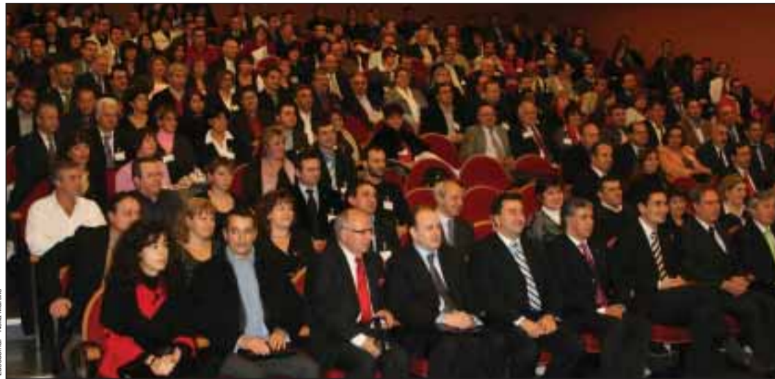
O Encontro contou com cerca de 300 participantes

O Embaixador de Portugal salientou para o facto de cerca de 43% dos Portugueses de França residirem na