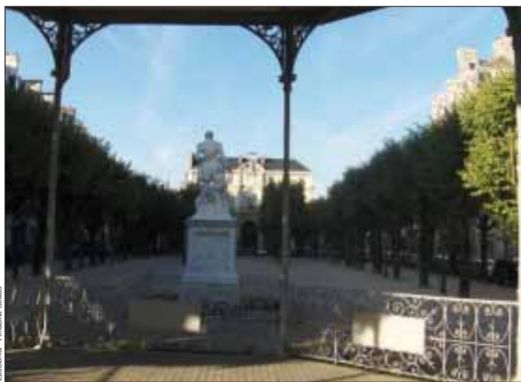
A cidade de Pau vai passar a ter um Cônsul honorário

Um dos pontos mais polémicos da reunião foi a questão da nomeação