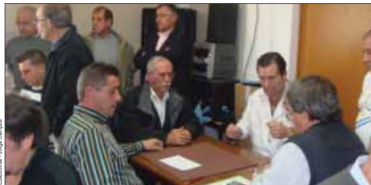
Jornada do Campeonato, na associação de Decines

No sábado passado, dia 16 de Novembro, desenrolou-se mais uma jornada do Campeonato de sueca das associações portuguesas da região de Lyon. A Associação de Decines acolheu as vinte sete equipas do Campeonato, sala cheia, e muito respeito pelos regulamentos apresentados no início do Campeonato.