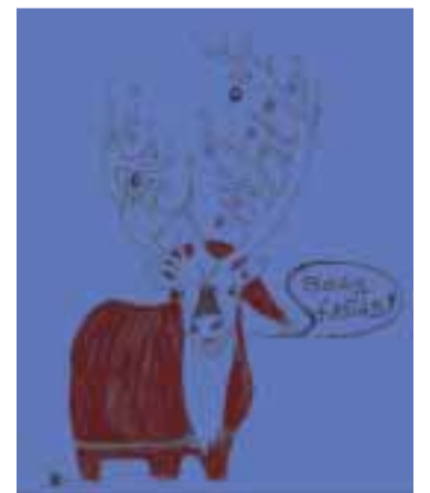
Ganbo de produtividade, ou despedimento por causa de crise? Desenho de Aurélio Pinto