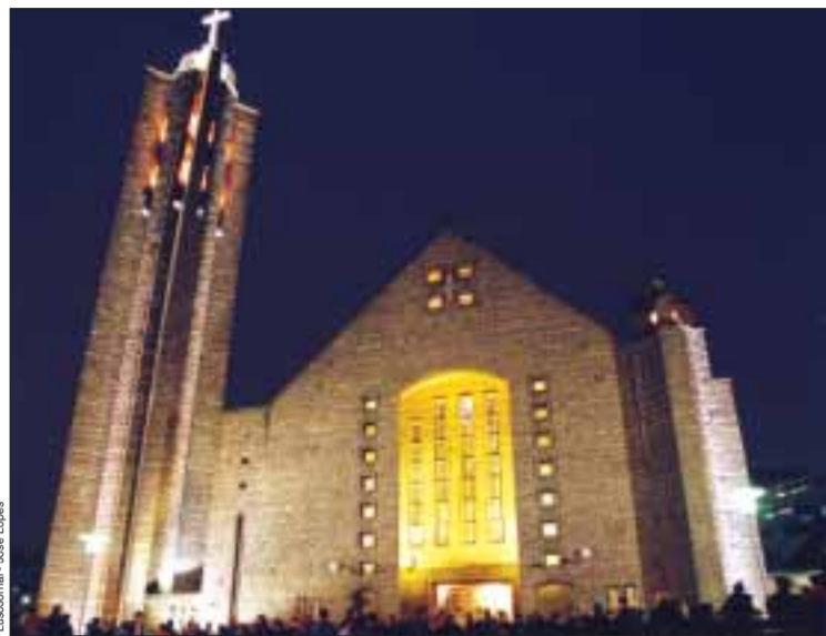
Igreja de Nossa Senhora de Fátima, em Paris