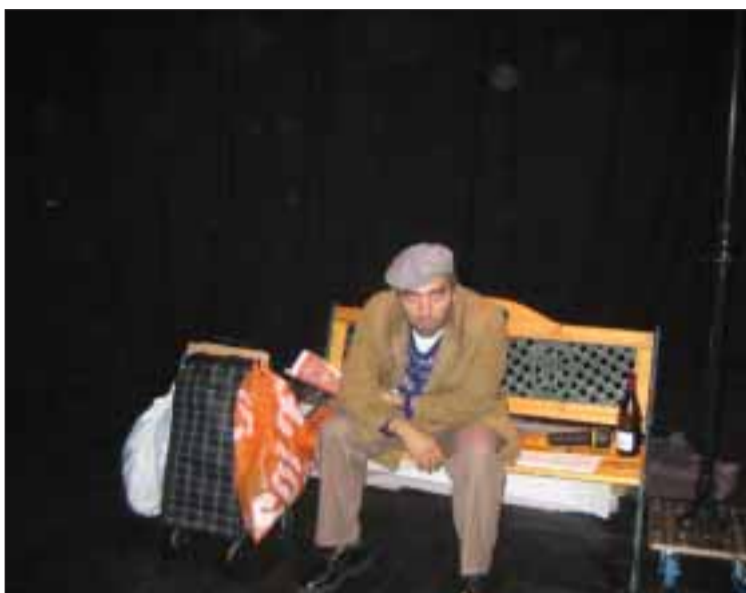
Spectacle 'Resistência' par le groupe de Pontault-Combault

«La salle est disponible pour des activités et a été mise à disposition par le Directeur de la Maison du Portugal pour cette action. Pour cette pièce de théâtre, elle devait être aménagée avec un rideau et des spots de lumières. Une entreprise, proposée par la Maison du Portugal, a été contactée et un devis proposé» explique le Bureau de la CCPF. «Le 5 décembre dernier, la salle a été visitée par un responsable du groupe de théâtre de l'APCS qui a validé la salle à la condition que le matériel demandé soit installé, ce que la CCPF a évidemment accepté. L'entreprise en charge de l'installation s'est aperçue, cette semaine, qu'il n'existait pas de supports pour accrocher le rideau et que les conditions de sécurité pour les lumières étaient insuffisantes. Il n'était donc plus possible d'y programmer ce spectacle.