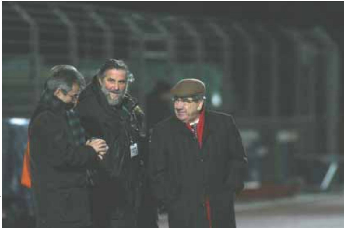
As condições climáticas impediram a realização do jogo

Com os campeonatos nacionais a sofrerem mais uma interrupção, de regresso está a Taça de França com mais uma eliminatória, ou seja os 16 avos de final e aqui com a equipa luso-galesa do Créteil/Lusitanos a ir defrontar no próximo sábado os amadores de Vitré (CFA). "É uma equipa que poderá estar ao nosso