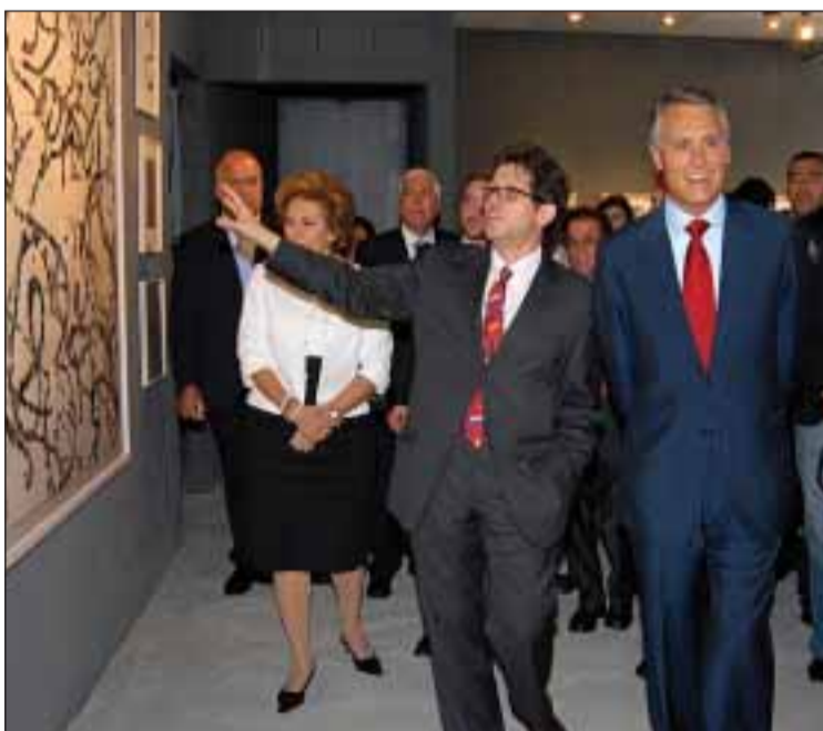
Presidente inaugurou a exposição em Viana do Castelo