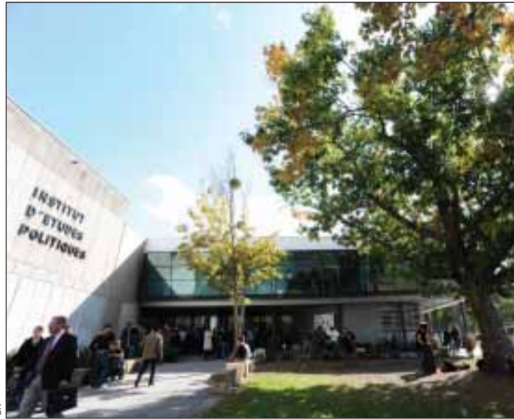
Sciences-Po em Bordeaux

Com um duplo diploma em ciências políticas e sociais, a FIFPO (Filial integrada França Portugal) é uma formação integrada franco-portuguesa em 5 anos, para a obtenção do diploma de 'Sciences-Po' Bordéus e de dois diplomas suplementares: o Master da Universidade de Bordéus IV e o Master da Universidade de Coimbra, Faculdade de Economia, opção Relações Internacionais ou Sociologia. "Os estudantes alternam os estudos em Bordéus ou em Coimbra de ano em ano. A formação generalista de 'Sciences-Po' Bordéus e a importância da metodologia e da