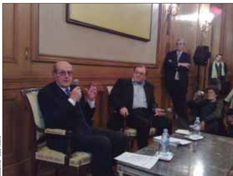
Manoel de Oliveira falou numa Gulbenkian cheia de gente

Manoel de Oliveira é originário de uma família da média-alta burguesia, com antepassados fidalgos, facto que muito influenciaria o teor e as temáticas da sua futura obra cinematográfica. Estudou no Colégio de jesuítas da Guarda (Galiza), dedicou-