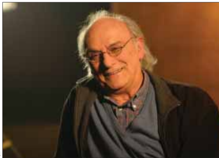
Realizador Carlos Saura

Carlos Saura: Falei muito com os meus assessores e com alguns dos melhores especialistas do fado, em Portugal. É curioso como há tantas opiniões, todas diferentes, sobre este tipo musical. Uns dizem que o fado é brasileiro, há quem pense que no fado há um batido que se dançava,... Tentei que todas essas opiniões viessem para o filme. Não quis falar apenas da parte nostálgica do fado, mas era necessário abrir este mundo muito fechado, essencialmente de Lisboa. Por isso, no filme temos a Mariza com uma visão mais futurista e