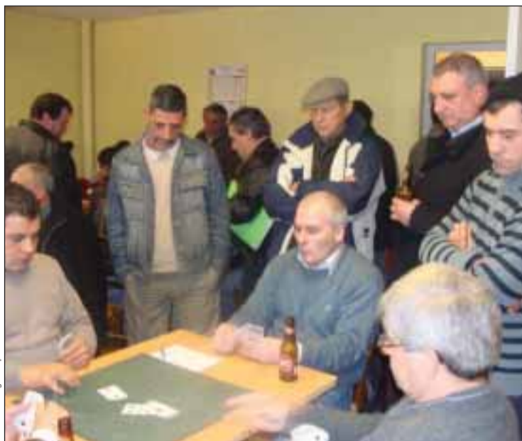
LusoJornal - Jorge Campos

No sábado passado, dia 17 de Janeiro, decorreu a 12ª jornada do Campeonato de sueca inter-associações da região de Lyon. Foi a associação de Futebol de Vaux-en-Velin, que acolheu as equipas de jogadores nos seus novos locais. Algumas modificações na tabela classificativa foram registadas, mas os favoritos continuam a ser Gito e Cardoso com 70 pontos. A próxima jornada será em Bron, na associação Colombe de la Paix, no sábado dia 24 e terá início pelas 15h00. A associação que recebe o Campeonato também vai inaugurar a sua nova sede. Podem visitar e ter mais informações no site do Campeonato, criado para este efeito http://campeonato-desueca.skyrock.com