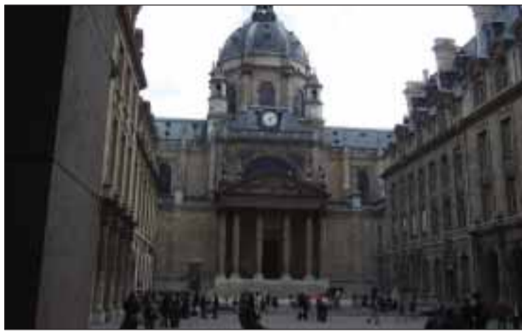
Universidade de Paris Sorbonne