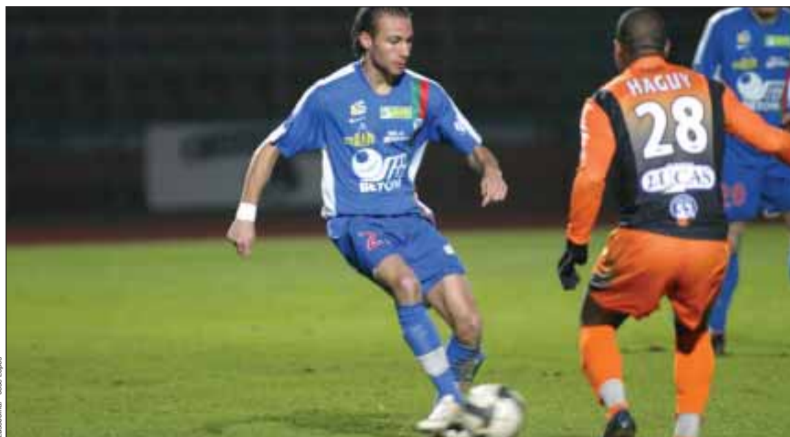
Os jogadores do Créteil/Lusitanos não conseguiram dar a volta ao resultado

No entanto não presenciaram melhor que o empate (0-0) perante o líder Laval, o que ascende a treze empates em vinte e dois jogos.