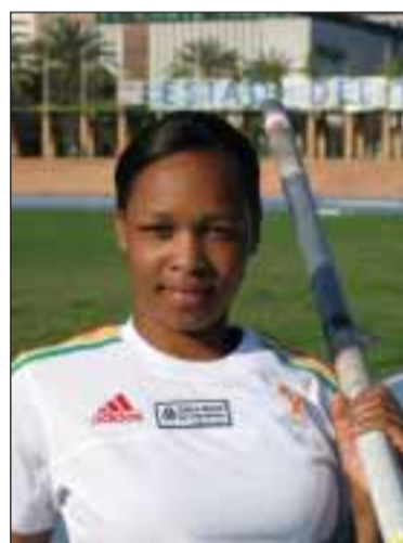
As quatro irmãs com origem cabo-verdiana e nacionalidade portuguesa, fazem alta competição em França