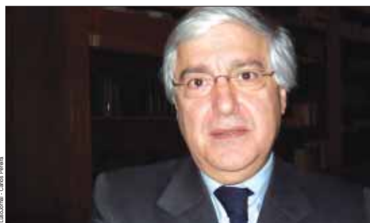
Embaixador Francisco Seixas da Costa

A ironia nisto é que estamos a todos a tentar encontrar saídas da crise, com medidas de carácter