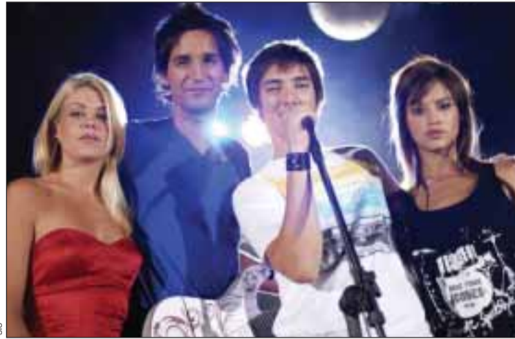
Rebelde tem cenas filmadas em Paris

A SIC internacional apresenta, de segunda a sexta-feira, às 17h30 (hora de Paris), a telenovela Rebelde Way. Quatro histórias, aparentemente distintas, que se vão juntar num espaço propício a aventuras, amores, desamores e mistérios - o Colégio Prestige International School. Pedro, Mia, Lisa e Manuel - quatro fortes personalidades, quatro líderes naturais - são os heróis maiores de uma história que é marcada pelo dia-a-dia de um colégio interno.