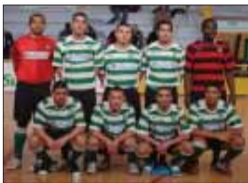
Sporting Club de Paris

Challenge Nacional de Futsal (5ª Jornada) Grupo F Kremlin-Bicêtre Futsal - Sporting Clube de Paris 2-7