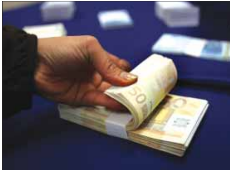
Emigrantes continuam a enviar dinheiro para Portugal

Os portugueses residentes em França e na Suíça, as principais fontes de remessas para Portugal, aumentaram os seus envios de dinheiro. Assim, em 2008 entraram em Portugal, provenientes da França, quase 1.780 milhões de euros (mais 75 milhões que em 2007) e cerca 558 milhões euros