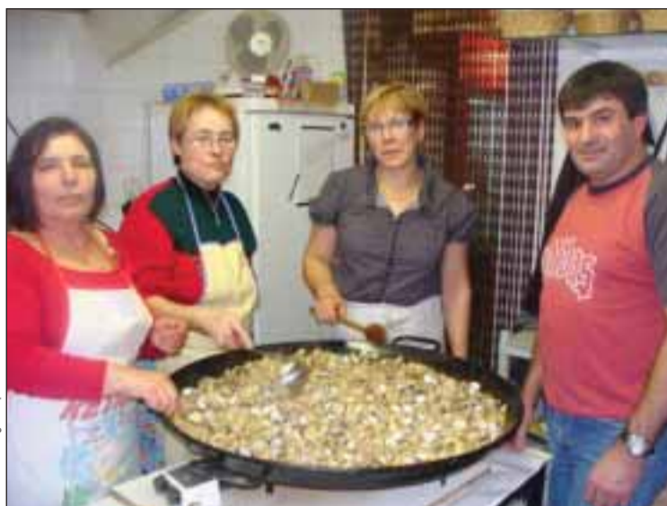
Momentos da preparação do jantar

a aprender a cozinhar e isto desde muito novo. Os meus pais iam trabalhar para o campo e eu ficava em casa e tinha a meu cargo co-