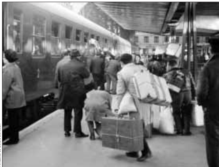
História da emigração portuguesa em debate em Viroflay