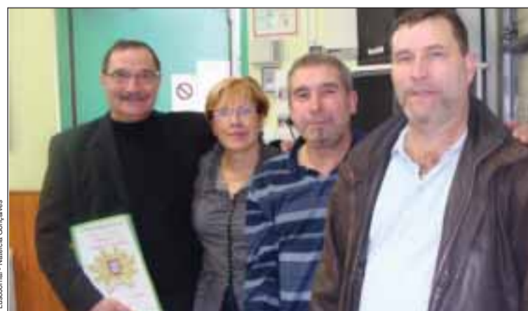
Camaradagem está na ordem do dia do Campeonato de Sueca

No sábado passado, dia 21 de Fevereiro, decorreu a 18ª jornada do Campeonato de sueca inter-associações da região de Lyon.