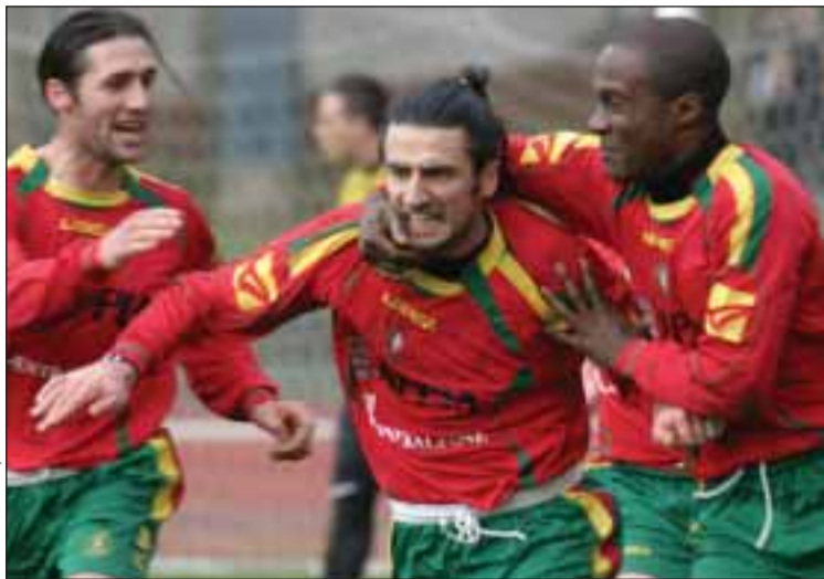
Les joueurs de Lusitanos fêtent un de leurs deux buts