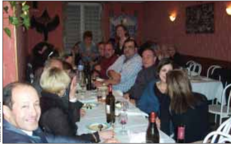
Alguns dos ex-radialistas presentes no encontro