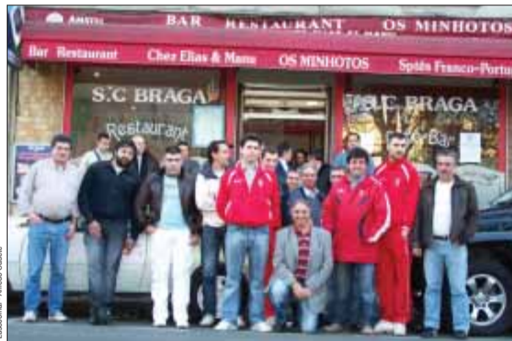
Adeptos do Sporting de Braga, em Ivry