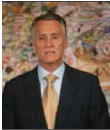
Presidente Cavaco Silva

«Portugal somos todos nós que o amamos e que lhe damos o melhor que somos capazes», acrescentou. O Presidente da República renovou ainda o apelo ao "espírito de portugalidade", que mantém viva a Língua e Cultura Portuguesas. «Jamais percam essa ligação à vossa terra de origem, à terra dos vossos pais e avós, e que continuem a cultivar o uso da Língua de Camões e a rever-se nas realizações da Cultura Portuguesa,