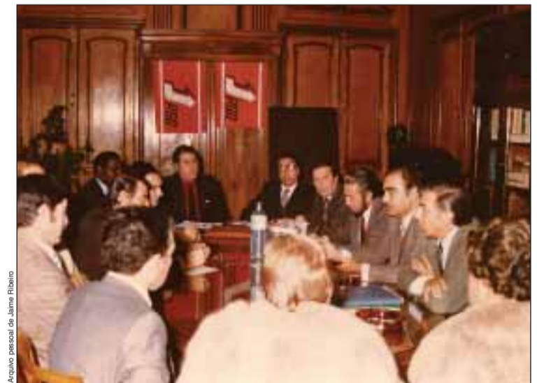
Reunião na sede do PSD/Paris (foto de arquivo)

Lamento que Manuela Ferreira Leite, nessa grande época do nosso Partido em França, não tenha visitado a nossa sede. Na sua deslocação a França, em 14 de Março último, não pude estar presente na reunião e jantar do nosso Partido, que segundo notícias dos jornais e reportagem do LusoJornal, estiveram presentes 250 militantes. Como fundador e amigo de todos os presentes, tenho pena e lamento, pois havia a grande oportunidade de focar os grandes acontecimentos do nosso Partido em França, sem esquecer os nomes dos nossos Primeiros-Ministros que visitaram e reconheceram o nosso e meu trabalho. Junto uma fotografia da nossa sede, que infelizmente já não