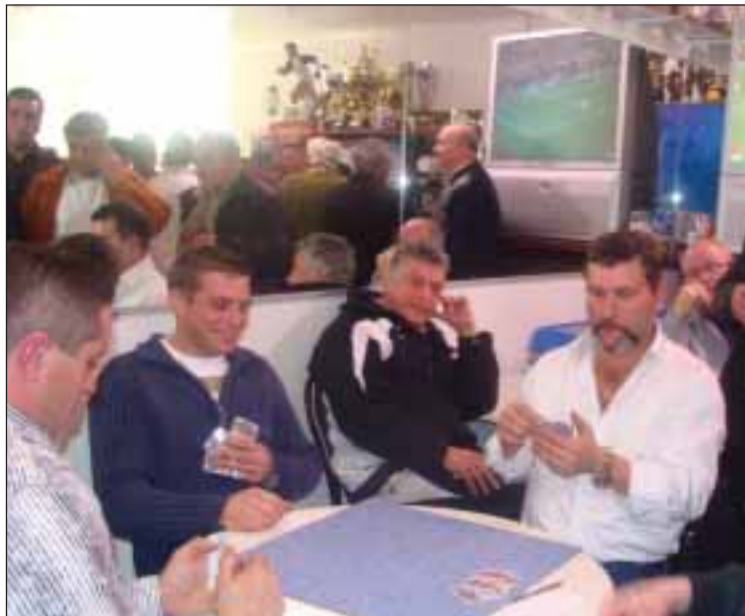
Aspecto parcial dos jogos

No sábado 21 de Março, a Associação Desportiva Portuguesa de Vaux-en-Velin (69) acolheu na sua sede, a 23ª jornada do Campeonato de sueca inter-associações da região de Lyon.