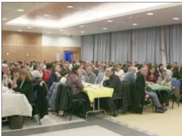
Aspecto de um dos jantares da associação

A associação conta com 600 aderentes que estão de parabéns "por nunca terem baixado os braços, terem mantido uma luta viva e constante contra a injustiça de que eram vítimas, e conseguirem