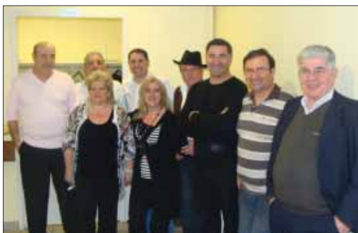
Dirigentes da associação

Foi tomada a decisão de alterar os estatutos da associação, modificando a frequência das eleições que passou a ser de cinco para três anos. A equi-