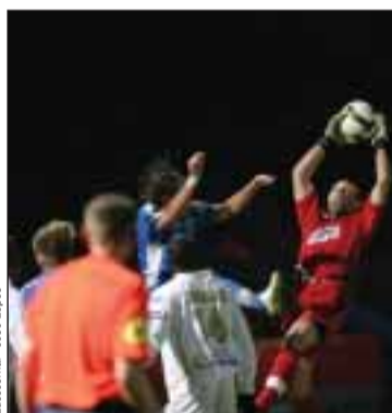
Vitória permite respirar