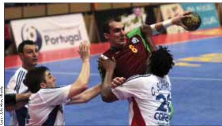
Portugal perdeu face à França

A Selecção portuguesa de andebol perdeu na semana passada por 31-24 com a sua congénere francesa, campeã olímpica e do Mundo, em encontro de apuramento para o campeonato da Europa de 2010, na Póvoa de Varzim.