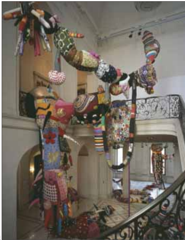
Aspet partiel de l'exposition vue de l'escalier principal