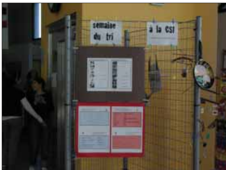
Aspecto parcial da exposição

O programa, que desde há vários anos tem vindo a ser implantado neste estabelecimento escolar com um êxito sempre crescente, contou uma vez mais com a colaboração dos docentes afectos às mais variadas áreas disciplinares, das Ciências da Natureza (Sciences de la vie et de la terre) aos Trabalhos Manuais (Technologie) e à Educação Visual (Arts plastiques), passando pelas disciplinas de línguas (as quais, no caso da CSIG, cobrem a língua de Molière - Francês tout court e Francês língua estrangeira -, para além de seis outras línguas - alemão, árabe, castelhano, inglês, italiano e português -, que os alunos têm a possibilidade de abordar, ou como idiomas estrangeiros, ou enquanto suas línguas próprias e de desenvolvimento pleno, nomeadamente enquanto instrumento de aprendizagem da literatura expressa nessas mesmas línguas ou da História e da Geografia, perspectivadas