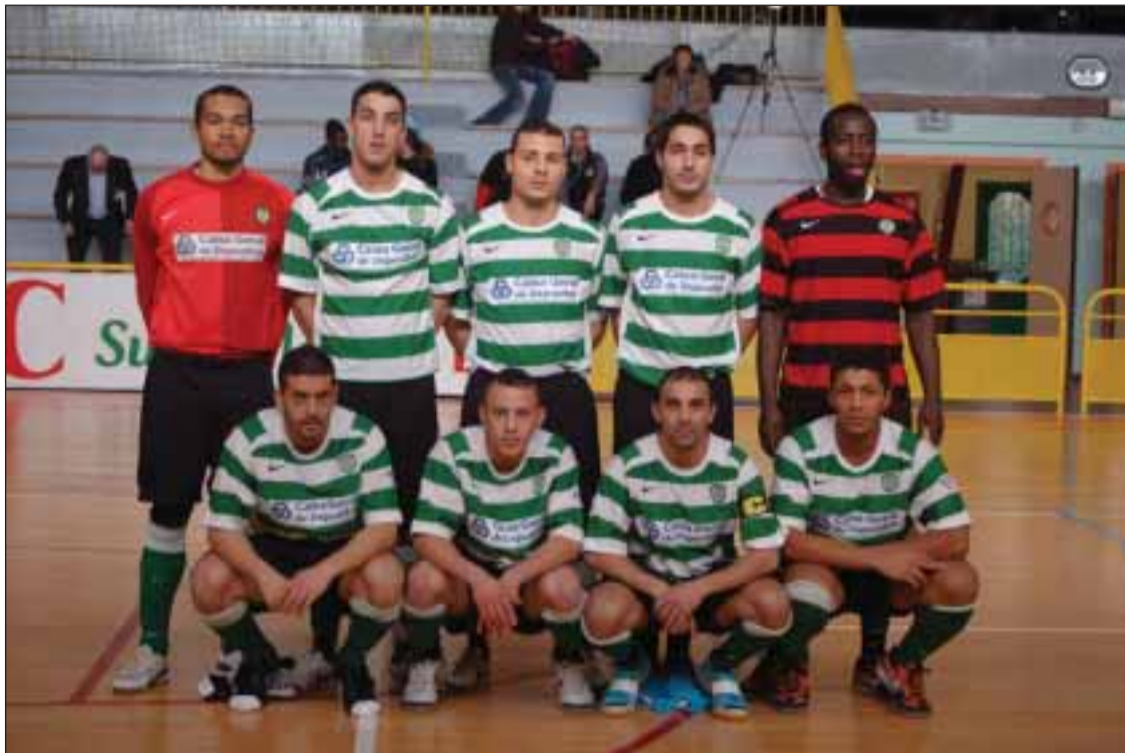
Equipa de futsal do Sporting Clube de Paris com três internacionais na Selecção de França