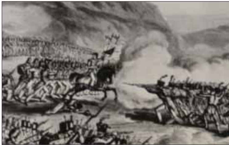
Ilustração sobre as Invasões francesas em Portugal

Segundo os historiadores portugueses, Portugal nunca se tinha restabelecido do terramoto de 1755, porque desde essa data nunca parou de ter