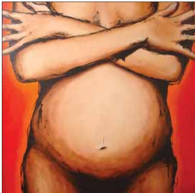
'Mater' de Ricardo Passos - Acrílico sobre tela (80 x 80 cm)

Ricardo Passos nasceu em 1963, e desde muito cedo se apaixonou pelas artes plásticas em geral. Efectuou até à actualidade, mais de 80 exposições, individuais e colectivas, no país e no estrangeiro. Concluiu o Curso da Escola de Artes Decorativas António Arroio e o Curso Superior de Marketing e Publicidade do IADE, e ainda o Curso de Pintura da Sociedade Nacional de Belas Artes. Frequentou também, o Curso de Design de Joalharia Contemporânea da Escola Contacto Directo. A sua actividade profissional envolve-se essencialmente na área da Pintura e do Design Gráfico, o que lhe permite exercitar quotidianamente noções de equilíbrio formal e conceptual, apu-