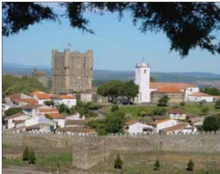
Cidadela de Bragança

A comitiva transmontana chega a Paris no sábado dia 18 de Abril e segue para Estrasburgo na segunda-feira, dia 20. A Casa de Trás-os-Montes de Pavillons-sous-Bois (93) está a preparar um programa para os dois dias de estadia em Paris. Eduardo Lapa, Presidente da associação confirmou ao LusoJornal que os autarcas vão almoçar num 'bateau-mouche' no rio Sena, no domingo e depois vão ser recebidos na Mairie de Pavillons-sous-Bois, cidade com a qual Bragança está geminada. O jantar está previsto para Pavillons-sous-Bois e Eduardo Lapa já recebeu a confirmação da presença do Embaixador Francisco Seixas da Costa e do Cônsul-Geral Luis Ferraz. "Também foi formalizado um convite ao Deputado Carlos Gonçalves. Ele ainda não nos respondeu, mas sabemos que está sempre nas actividades organizadas pela Comunidade,