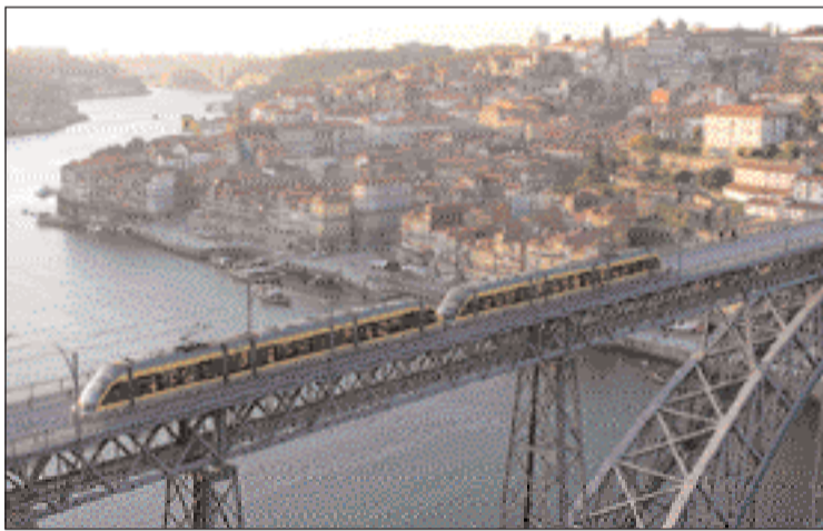
Metro do Porto

Outre l'exposition de photographies, il y aura, sur place, la distribution gratuite de documentation et de Cartes postales originales. Cette exposition sera également l'occasion pour Dário Silva de faire un reportage photographique sur le Tram de Montpellier, en