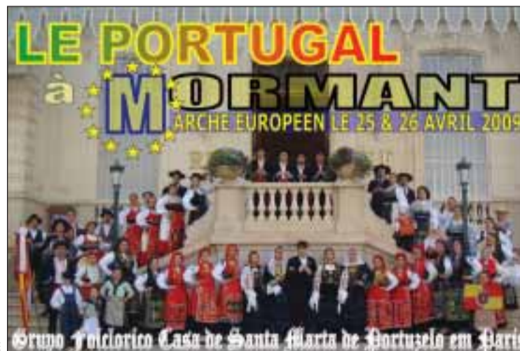
Affiche du Marché européen

Du côté portugais on comptera avec la présence du groupe folklorique 'Casa de Santa Marta de Portuzelo em Paris' qui défilera à partir de 16h30. Ainsi que divers produits typiques de l'ancien Portugal, seront