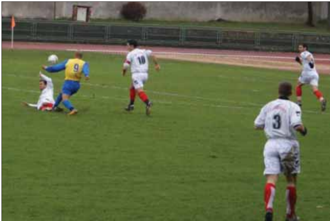
Les Lusitanos à terre pour ce match face à Yerres

Pour être objectif, les saint-mauriens auraient dû profiter de leur première demi-heure qui les a vu dominer totalement leur adver-