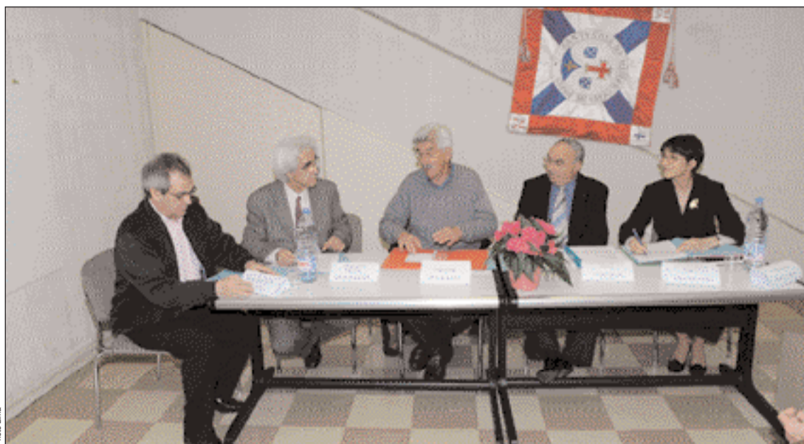
Mesa da Assembleia Geral da Santa Casa da Misericórdia de Paris

Recentemente a Santa Casa da Misericórdia de Paris, editou o livro "Os Portugueses em França na hora da reforma". Para que as receitas equilibrem os gastos com a impressão do livro, que ascendem a mais de 7.500 euros, faltam ainda vender 160 livros, foi anunciado na Assembleia Geral.