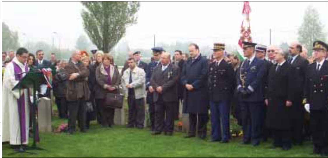
Homenagem aos soldados portugueses no Cemitério Militar Português de Richebourg

Na Batalha de La Lys, o Corpo Expedicionário Português teve de combater face aos alemães, quando já estava preparado para regressar a Lisboa. As tropas portuguesas saíram derrotadas no dia 9 de Abril de 1918. "Só nesse dia, entre mortos, feridos e prisioneiros, Portugal perdeu cerca de 7.000 homens" explica o Coronel Paulo Mateus. "Hoje é difícil compreender em que condições se combatia naquela altura. Ainda de manhã quando vinha para aqui, com chuva e com tempo encoberto, pensei na-