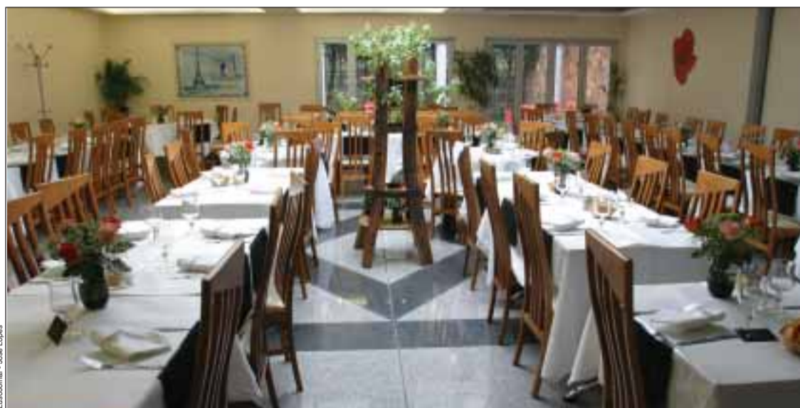
Aspecto geral da sala do Restaurante Le Lieutades, em Gentilly

Portugueses e Franceses adoptaram o restaurante pelo seu ambiente familiar para aquelas refeições que duram horas ou aquelas que vêm do trabalho e que procuram