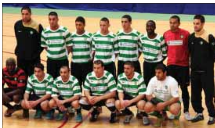
Sporting Club de Paris / Futsal

Quanto à atribuição do terceiro e quarto lugar que foi disputado antes