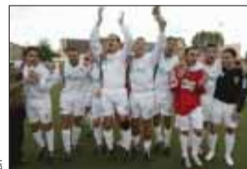
Moments de fête

en cinq ans. L'entrepreneur révolutionne le petit club régional et lui donne une autre dimension. Pour cela, il met quelques moyens et instaure des primes de matches. Les Saint-Mauriens du Portugal y arriveront en avance sur le programme, l'année où elle