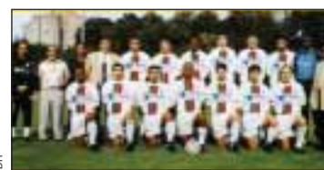
DR équipe 1999-2000