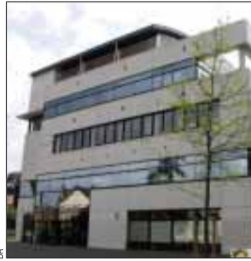
Collège Jean Moulin, à Chaville