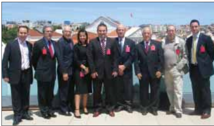
Membros da Comissão Cívica do CCP reunidos em Lisboa

No encontro que a Comissão Cívica e Política do CCP manteve com a Associação Nacional das Freguesias