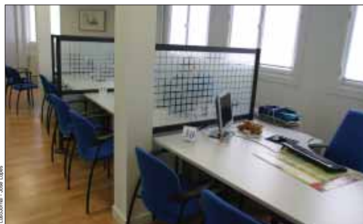
Os Consulados de Portugal podem fechar no dia 4 de Junho

O Sindicato denuncia os atrasos na negociação sobre a actualização salarial de 2009, consideran-