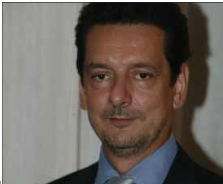
Embaixador de França em Portugal, Denis Delbourg

A Air Liquide está actualmente a construir em Sines um novo centro de produção, um investimento de 50 milhões de euros que estará operacional no final de 2009. Além do projecto de Sines, o grupo consagrou 20 milhões de euros para a construção