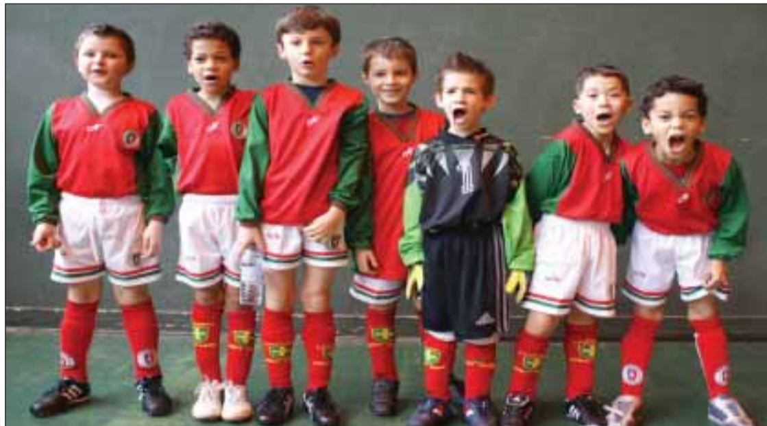
DR Génération 'Made in Lusitanos'

L'année 2009 marque le début de notre nouvelle politique de formation «Made in Lusitanos», dont l'objectif est de fournir à terme notre équipe principale avec des joueurs formés au club, porteurs des valeurs de combativité, d'ambition et de respect qui sont la marque de fabrique de l'US Lusitanos de Saint-Maur.