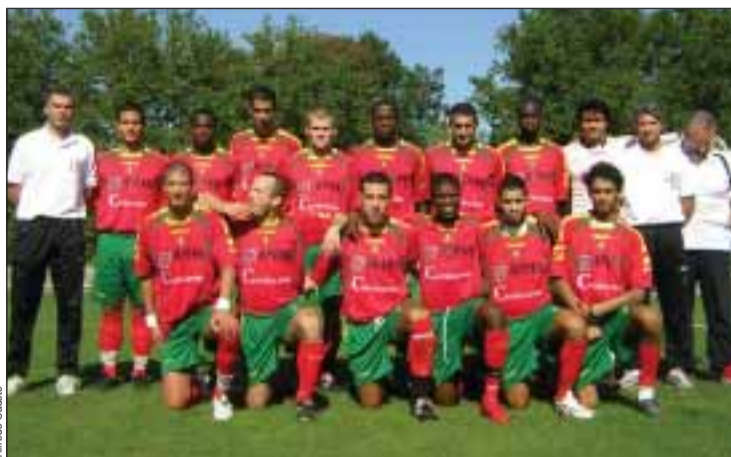
Equipa sénior US Lusitanos de Saint Maur