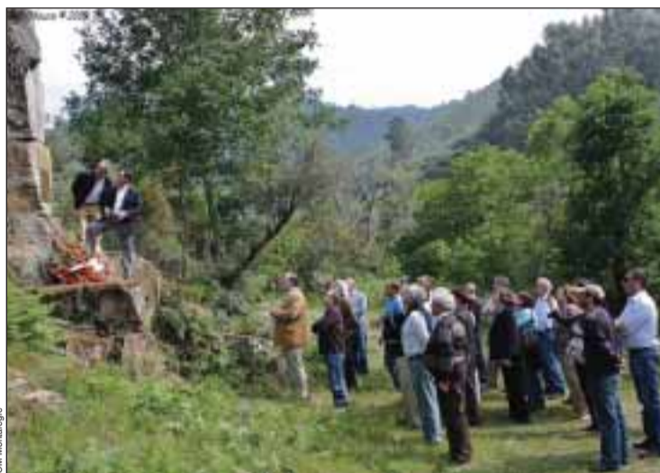
Inauguração das placas junto da Ponte da Misarela

Integrado nas comemorações do bicentenário das invasões francesas, dia 23 de Maio, na Ponte da Misarela, foi descerrada uma lápide descritiva dos principais acontecimentos históricos a esta ponte associados. À noite, no Auditório Municipal de Montalegre, teve lugar um serão onde, entre outros, foram apresentados factos desconhecidos associados à efeméride.