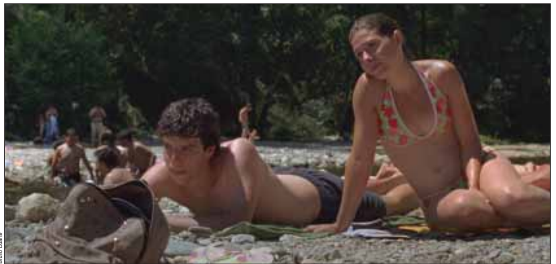
Imagens do filme "Aquele Querido Mês de Agosto" de Miguel Gomes

Originário de Lisboa, Miguel Gomes frequentou a escola de Teatro e de Cinema e foi durante alguns anos crítico de cinema na imprensa portuguesa. Com aproximadamente 150 min, 'Aquele Querido Mês de Agosto' é um filme no filme onde o