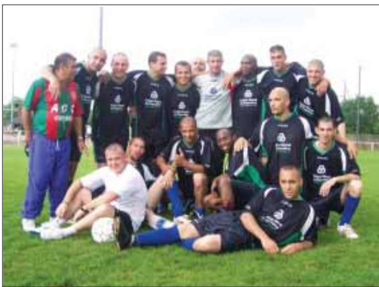
Equipa organizadora e vencedora do Torneio