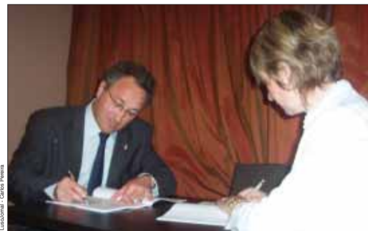
Moment de la signature de l'accord entre BCP et Orange

Pour l'instant c'est un accord signé pour la Communauté portugaise mais la banque BCP réfléchit déjà