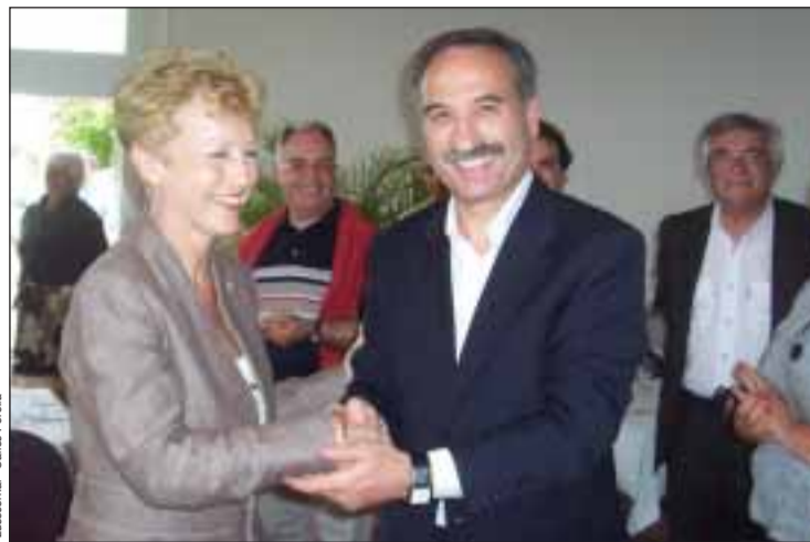
Presidentes das duas Câmaras cumprimentam-se em Les Ulis

"Estamos muito interessados por esta aproximação com a cidade de Les Ulis, embora já temos uma gemi-