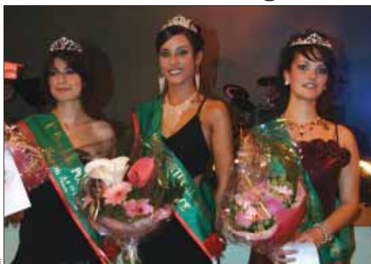
Les trois élués du concours de Guebwiller