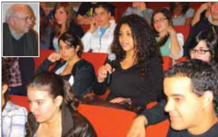
Les élèves de portugais en dialogue avec l'écrivain brésilien

Journaliste de renom, Luís Fernando Veríssimo a commencé sa carrière dans le quotidien 'Zero Hora', en publiant des chroniques et des textes humoristiques. Il a également