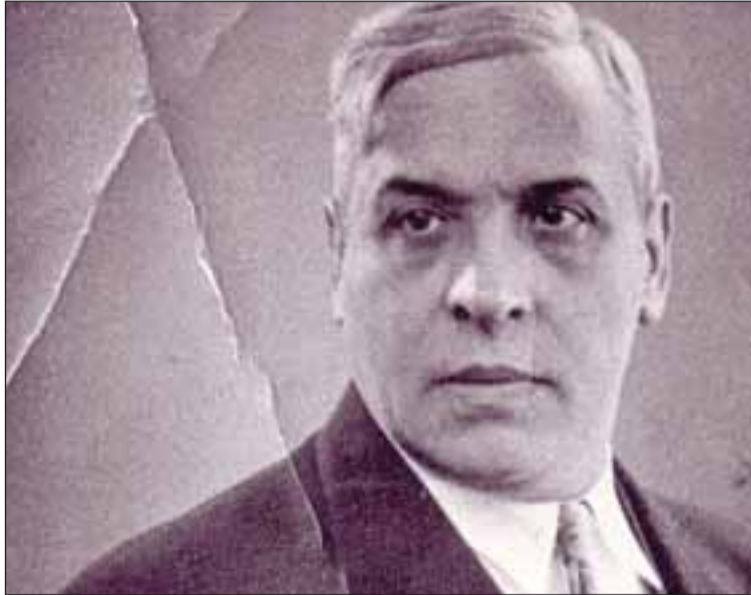
Aristides de Sousa Mendes foi Cônsul de Portugal em Bordéus

A France 2 exibiu na semana passada um filme sobre Aristides de Sousa Mendes e deu a conhecer a acção humanitária do diplomata português na 2ª Guerra Mundial. "Desobedecer" é o nome do filme, exibido na sexta-feira da semana passada pelo canal público de televisão, que aborda um pouco da