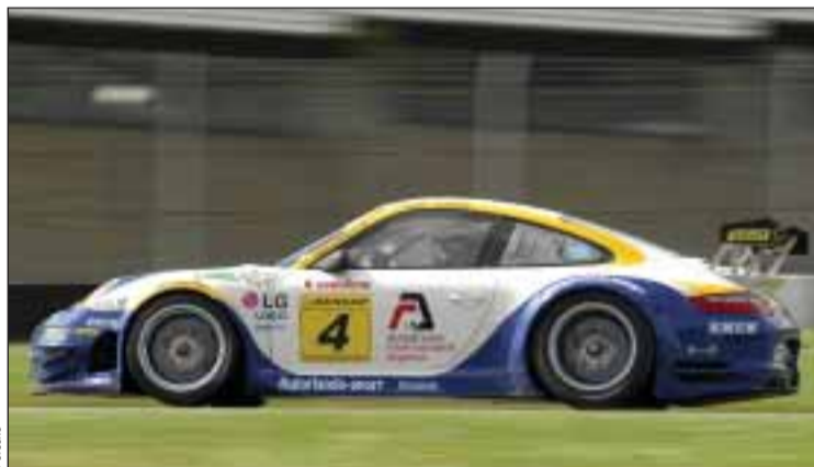
Porsche 997 RSR de Manuel Gião e Pedro Couceiro

O bonito circuito francês é considerado um dos mais exigentes do calendário mas até isso representa para a dupla portuguesa um factor adicional de motivação: «Tem tudo para ser um bom fim-de-semana para nós. É uma pista que se adapta bastante bem ao estilo do Porsche e onde poderemos certamente tirar o melhor partido possível da nossa máquina», disse Pedro Couceiro.