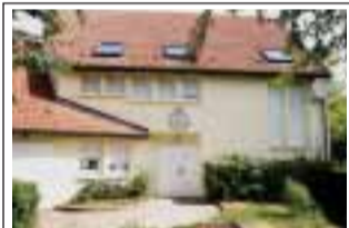
Casa de Portugal 620 rue Mansart 78370 Plaisir