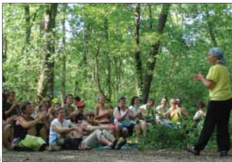
Conteuse de l'association en pleine session

Un buffet multinational permettra de découvrir des spécialités venues du monde entier. O Sol de Portugal proposera un échantillon de diverses spécialités gastronomiques du Portugal.