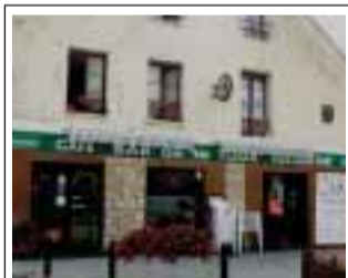
Café Bar de la Tour 1 place de la Croix Blanche 78310 Maurepas