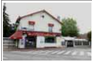
Le Nord du Portugal 62 rue de Romilly 78600 Le Mesnil le Roi

LusoJornal est distribué gratuitement dans plusieurs lieux de passage habituelle de nos lecteurs. En voici quelques exemples: