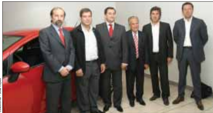
Momento da entrega do Fiat ao vencedor do sorteio