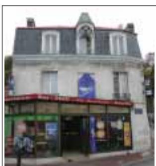
Restaurante la Fontaine 24 place Général de Gaulle 78380 Bougival

LusoJornal remercie tous ces points de distribution.