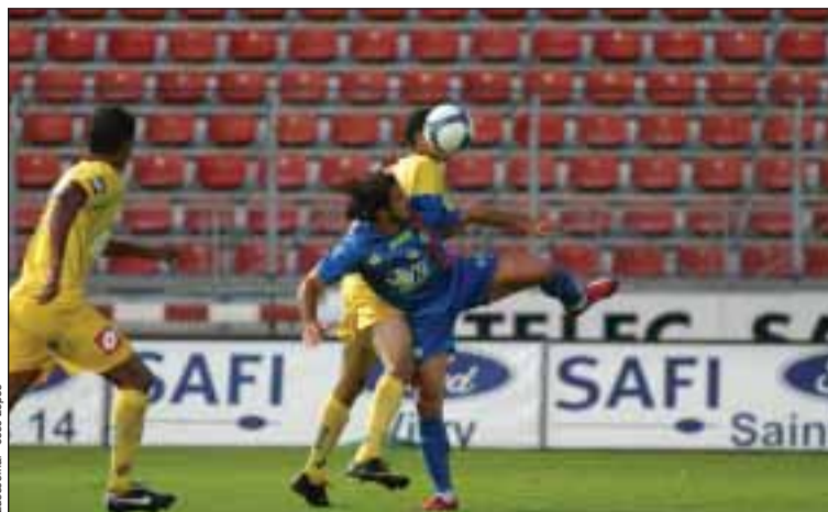
O mas importante foi mesmo a vitória

Como o resultado indica, os cerca de quinhentos espectadores que se deslocaram ao estádio Domini-