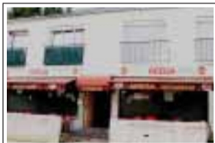
Resto Adega 2 place du petit pont 78310 Maurepas