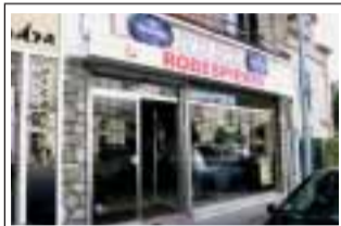
Le Robespierre (Beira Minho) 94 boulevard Devaux 78300 Poissy