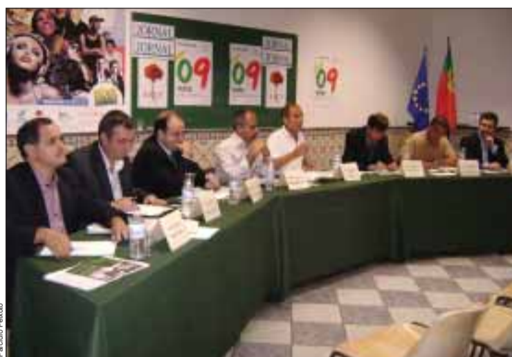
Aspecto geral da mesa do debate em Pontault-Combault