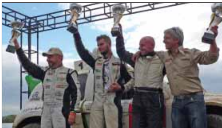
Segundo lugar do pódio, muito aplaudido