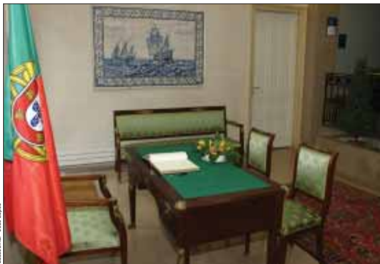
Os funcionários ameaçam paralisar os Consulados