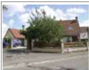
OliGril 6/8 rue du Moulin à Vent 78310 Coignieres

LusoJornal remercie tous ces points de distribution.