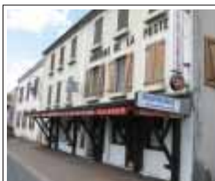
Restaurante L'Auberge de la Poste 142 route Nationale 10 78310 Coignieres