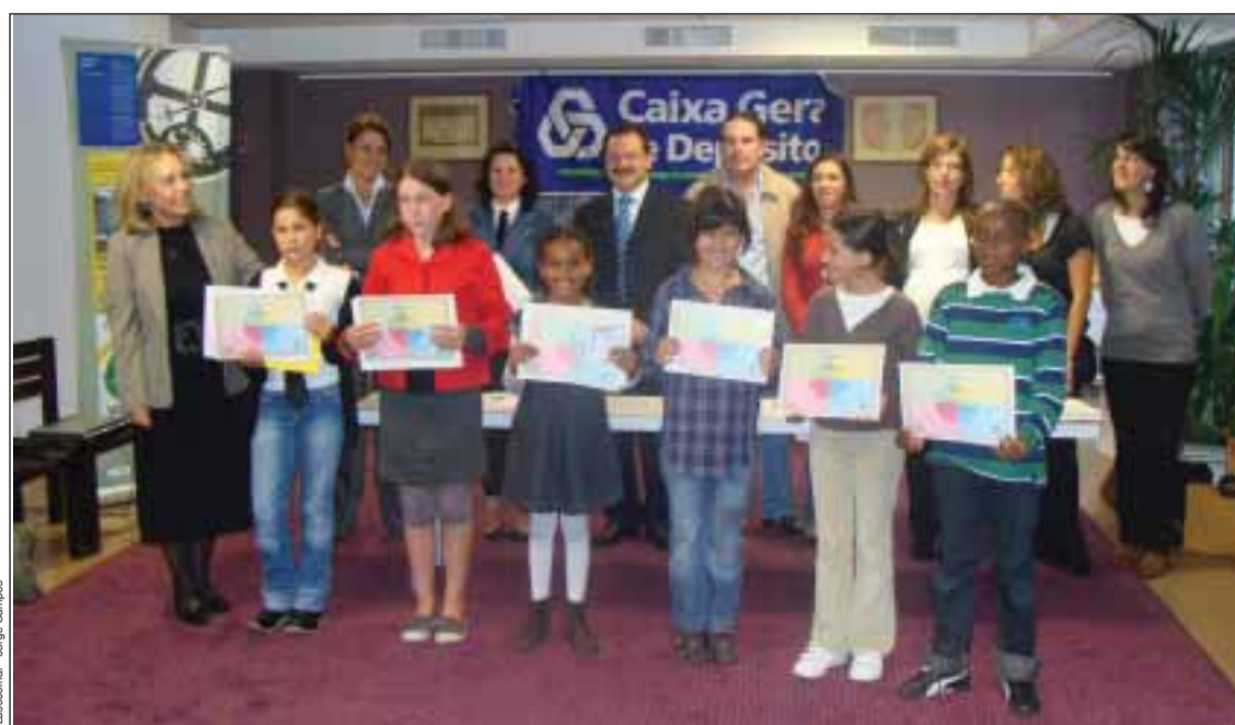
Entrega dos prémios, no Consulado de Portugal em Lyon

Durante o ano lectivo pretende-se fazer uma auto-avaliação da evolução de cada aluno na aquisição de competências em língua portuguesa. No início do ano é distribuído aos alunos um portefólio, dividido por cores, em que cada cor corresponde a uma competência e a etapas que devem ser alcançadas: escrita, leitura, compreensão e produção oral. Os alunos devem fazer um trabalho através destas competências, com recurso à internet. A produção dos trabalhos divide-se entre o controlo da evolução de capacidades durante as aulas e continua em casa graças à baixa carga horária das crianças. Com a ajuda dos encarregados de educação e dos docentes, cada aluno pode elaborar uma obra que reflecta o seu conhecimento da língua e da cultura portuguesas, assim como a sua im-