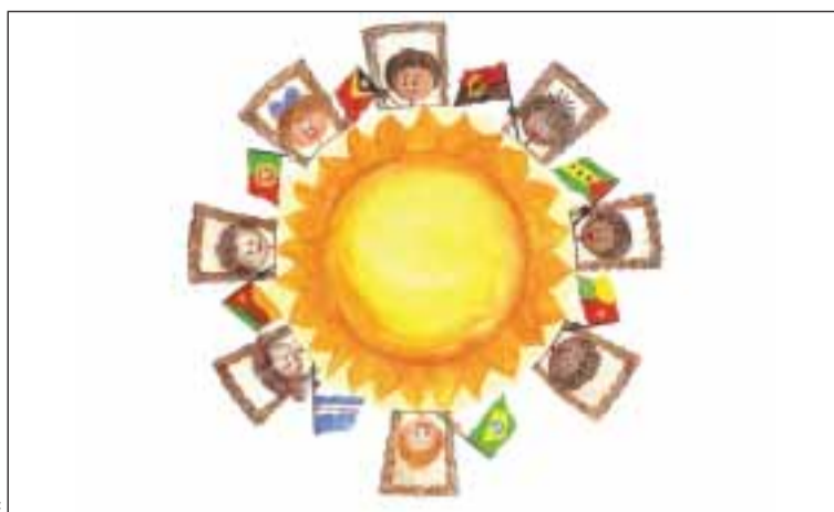
Um sol e oito janelas

A aprendizagem do Português - o Sol - far-se-á através do recurso a canções, cantigas de roda, lenga-lengas, jogos e histórias tradicionais e contemporâneas, adivinhas e poesia