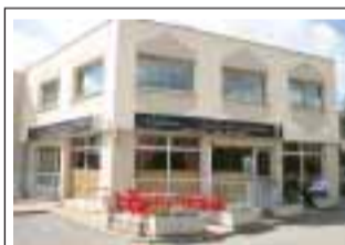
Supermercado Lusitano 4 rue Moulin à Vent 78310 Coignieres