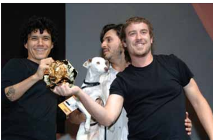
Um dos prémios ganhos em Cannes pela Leo Burnett Lisboa

Foi na Leo Burnett onde aprendeu tudo sobre publicidade, e é aqui que surgem ideias novas e origi-