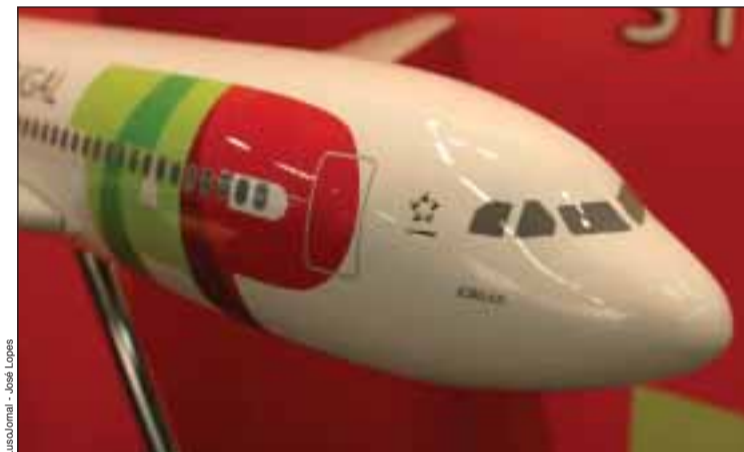
La TAP Portugal a une nouvelle ligne vers Alger

Jusqu'au 3 octobre, la compagnie nationale TAP Portugal lance une super-promotion vers Lisbonne et Porto, à partir de 97 euros TTC. Au départ de Paris et de Lyon le billet aller/retour est à partir de 97 euros TTC, tandis qu'au départ de Marseille, Nice et Toulouse le prix du billet est à partir de 128 euros TTC.