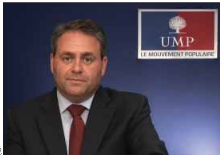
Xavier Bertrand termina o seu discurso em português

Le bon résultat de la Droite et du Centre Droit européens aux dernières élections européennes n'est pas le fruit du hasard, certainement pas le fruit du hasard. Les droites européennes sont pragmatiques, elles n'abordent pas les problèmes avec des grandes théories idéologiques comme le font les socialistes. Elles ont des valeurs, le travail, la famille. Et elles proposent en plus des solutions pratiques, voilà ce qu'attendent aujourd'hui nos concitoyens, voilà ce qu'attendent aujourd'hui les peuples d'Europe. Et c'est aussi ce que veulent les Portugais, j'en ai la conviction. C'est pourquoi le PSD