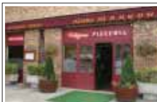
Pizzeria Vitigno Place de Bassigny 78310 Maurepas