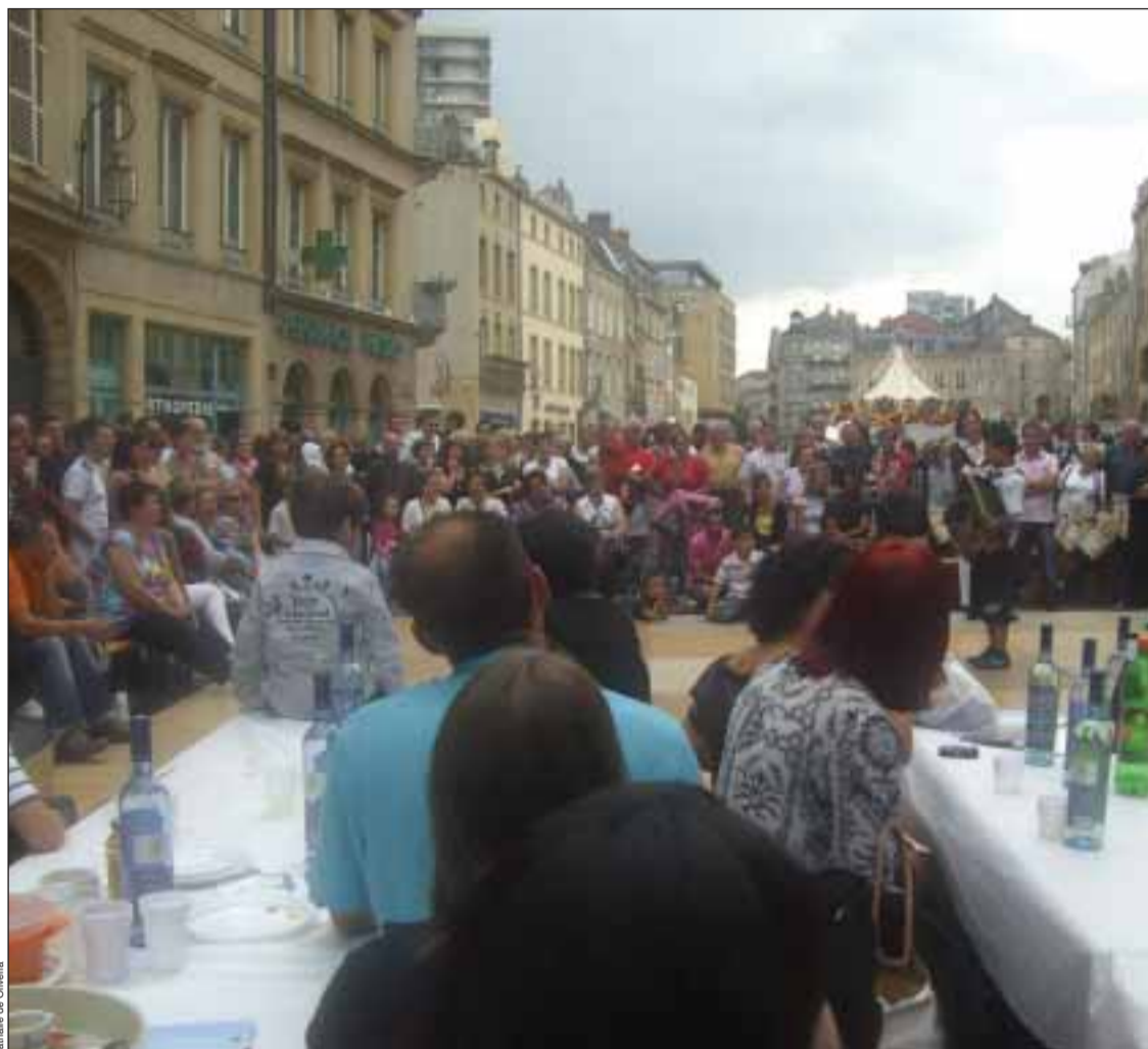
Piquenique português numa das praças centrais de Metz

A generosidade e a alegria da Comunidade portuguesa foram