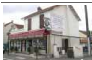
Restaurante O Luso 65 avenue Henri Barbusse 78210 St. Cyr l'Ecole