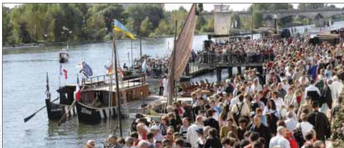
Des milliers de visiteurs sont attendus sur les bords de la Loire

Quant au public, il va pouvoir également goûter aux recettes gastronomiques du Portugal tout en s'initiant à la dégustation du Porto: Présence de Porto Cruz avec dégustation de Porto, le Musée du Douro et le char-