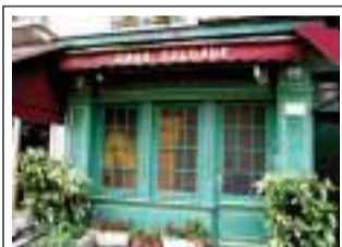
Casa Saudade 20 rue Général Leclerc 78000 Versailles