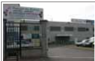
Le Portugal des Saveurs 94-98 av. Jean Mermoz 93120 La Courneuve