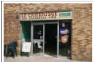
Le Cambridge Café Place de Bassigny 78310 Maurepas