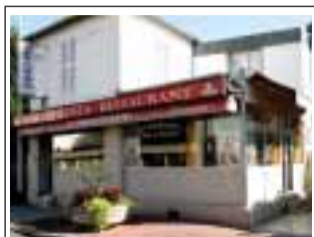
Café Restaurant Costa 49 rue du Président Wilson 78230 Le Pecq

LusoJornal est distribué gratuitement dans plusieurs lieux de passage habituelle de nos lecteurs. En voici quelques exemples: