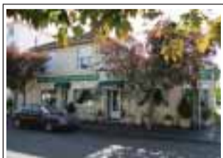
Restaurante Les Jardins de Montesson 29 Bld. de la République 78360 Montesson

LusoJornal remercie tous ces points de distribution.