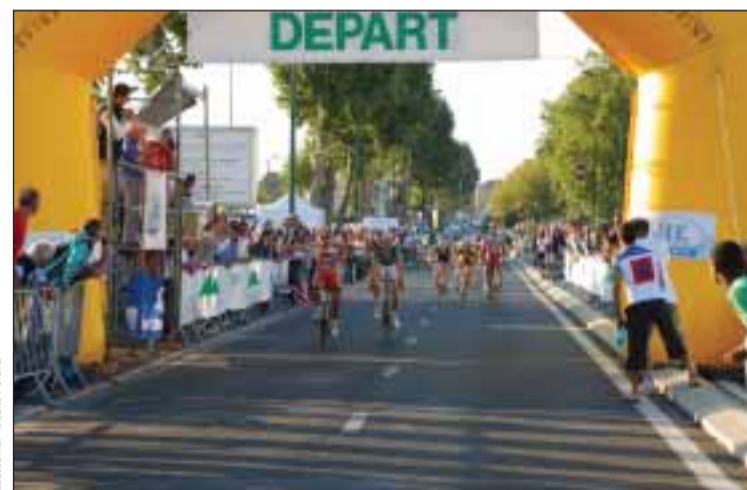
Arrivée de cyclistes, à Epinay-sur-Seine

La saison route se termine en apothéose pour le C.S.M. Epinay-sur-Seine - section cyclisme avec La Bruno Guerreiro qui a eu lieu le dimanche 27 septembre.