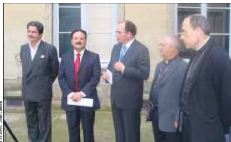
Inauguração da exposição

Cerca de 150 tesouros da arte sacra do Baixo Alentejo, com destaque para pintura, escultura e artes decorativas, são mostrados a partir da semana passada em Lyon. Intitulada "Portugal Eternel - Patrimoine de la Région de l'Alentejo", a mostra está patente ao público no Museu de Arte Religiosa de Fourvière até 3 de Janeiro.