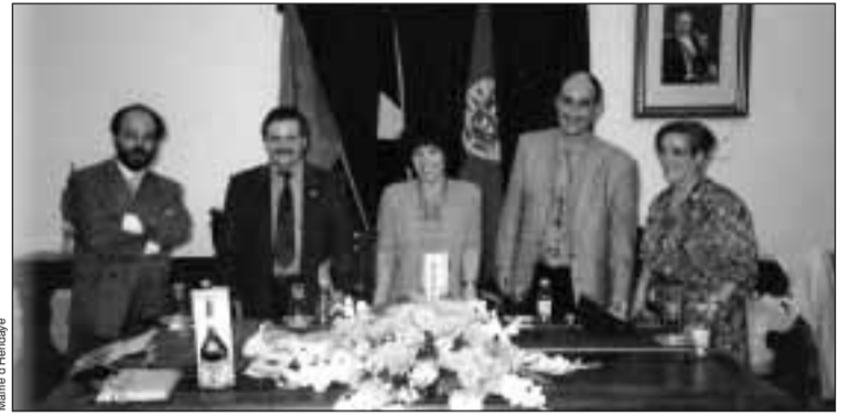
Le 7 octobre 1994 (photo d'archives)

Une Semaine culturelle portugaise pour commémorer le 15ème anniversaire du jumelage avec Viana do Castelo, aura lieu à Hendaye du 11 au 24 octobre.