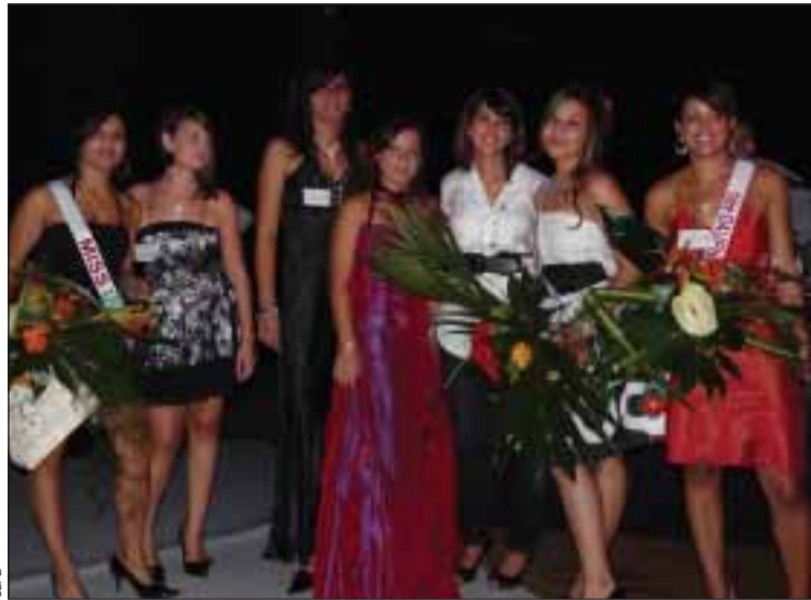
Concours Miss ULFE 2009

L'Association franco-portugaise ULFE, Union Luso Française Européenne de Dijon, a organisé le samedi 26 septembre, au Centre Pierre Jacques, à Fontaine-lès-Dijon, son Bal de rentrée. La soirée a rassemblé plus de 200 personnes.