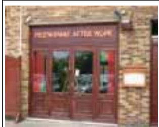
Restaurant After Work 1 rue de Bassigny 78310 Maurepas