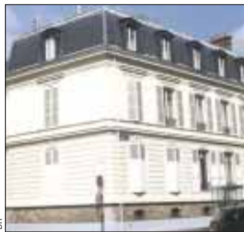
Antigo Consulado em Versailles