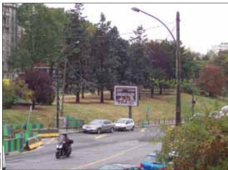
O futuro jardim, em obras para acolher o tramway de Paris

O jardim situa-se no ângulo entre o boulevard d'Algérie e a avenue de