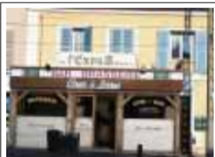
Bar-Restaurant l'Exona 2 Bld Jean Jaurés 91100 Corbeil-Essonnes