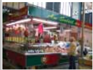
Au Soleil du Portugal ETS Mendes Marché de Corbeil-Essonnes 91100 Corbeil-Essonnes

LusoJornal est distribué gratuitement dans plusieurs lieux de passage habituelle de nos lecteurs. En voici quelques exemples: