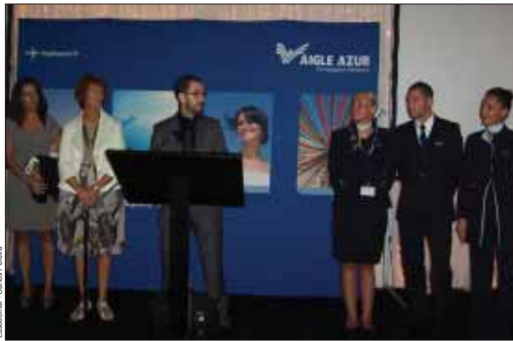
Le jeune Directeur général d'Aigle Azur, à Madère

Régionale du Tourisme espère qu'avec cette opération plus de 30.000 touristes français visiteront