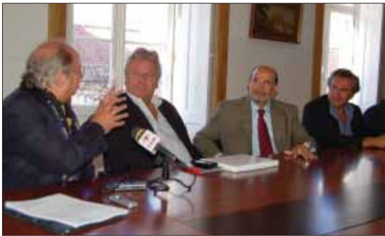
Conferência de imprensa para apresentação do filme

A curiosidade da jornalista leva o maestro a recordar uma série de eventos passados no longínquo mês de Junho de 1940, quando, aos 10 anos de idade, e ainda com esse no-