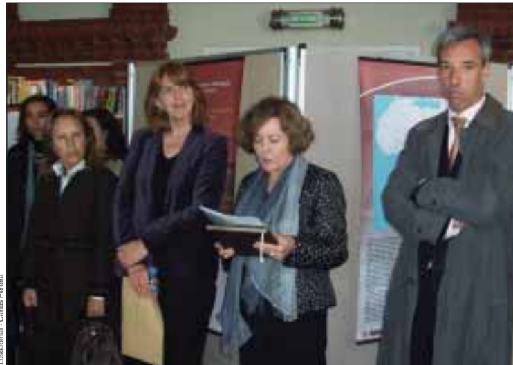
Momento da inauguração da exposição