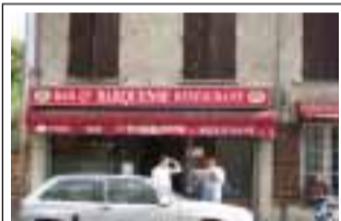
Bar-Rest. O'Barquense Rue Papetarie 91100 Corbeil-Essonnes