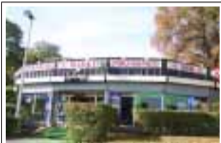
Bar-Restaurant Le Biblos Parc Mousseau 91000 Evry