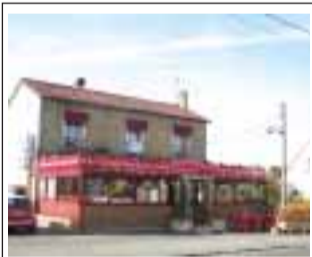
Restaurante Le Lusitanos 132 Bld. Kennedy 91100 Corbeil-Essonnes