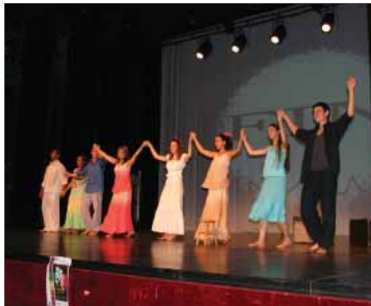
Grupo de teatro Os Sugos

une programmation cinématographique non seulement en province, mais aussi dans plusieurs villes de la région parisienne et