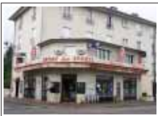
Restaurante des Sports 100 rue St.Spire 91100 Corbeil-Essonnes

LusoJornal remercie tous ces points de distribution.