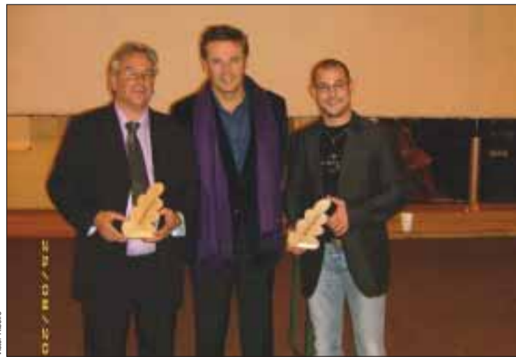
O maire da cidade com os premiados portugueses

O Benfica de Yerres foi reconhecido pela "função social" que tem exercido ao longo dos anos, visto ter em actividade cerca de 200 atletas praticantes desde os 7 anos até aos veteranos. A Mairie de Yerres financia o clube, através de algum apoio financeiro atribuído duas vezes por ano, e com o empréstimo permanente das