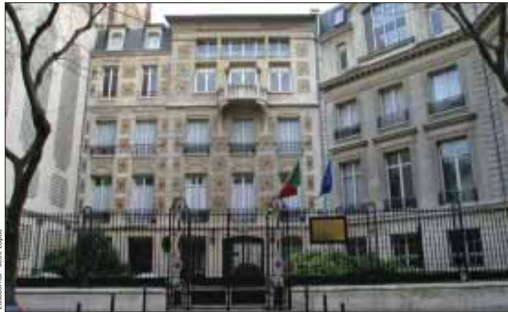
Fachada do Consulado de Portugal em Paris

Também os Cônsules de Estrasburgo e Bordéus e a Vice-Cônsul em