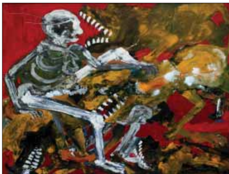
“Domador da terra vermelha”, acrílico 140x160, 2009