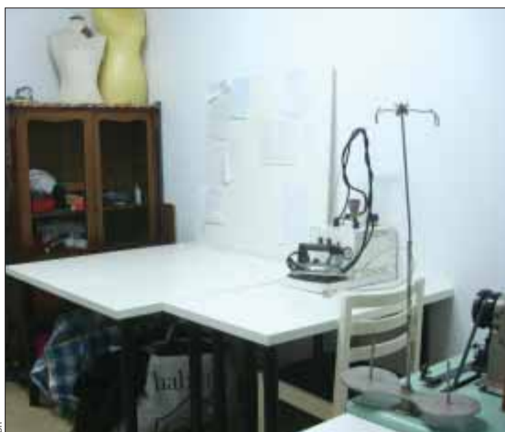
Atelier de Manuela Ribeiro

Un projet artistique participatif qui appelle à la créativité de cha-