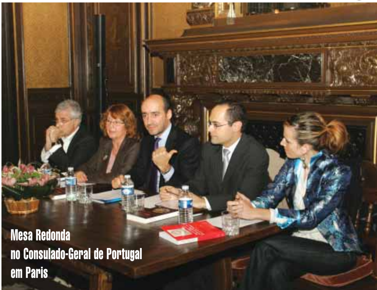
Mesa Redonda no Consulado-Geral de Portugal em Paris

Consulados de Portugal em França devem nomear nas próximas semanas os membros dos Conselhos Consultivos das áreas consulares (pag 3)