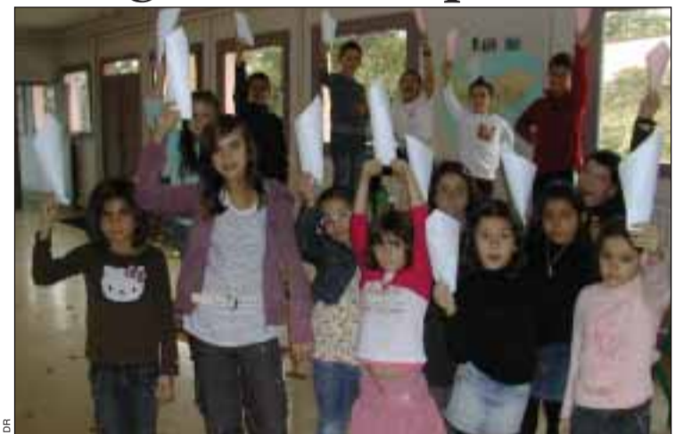
Alunos da escola de Feysin