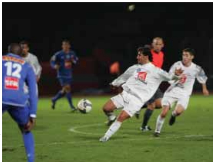
Os jogadores do Créteil dizem adeus à Taça de França