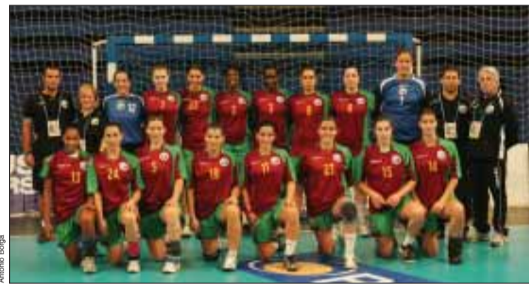
Seleccção de Portugal, em Paris

A selecção portuguesa feminina de andebol terminou no domingo passado, no quarto e último lugar da sétima edição do Torneio de Paris desta modalidade, depois de perder com a congénere de Montenegro por 25-22, contabilizando, assim, três derrotas no mesmo número de jogos disputados.