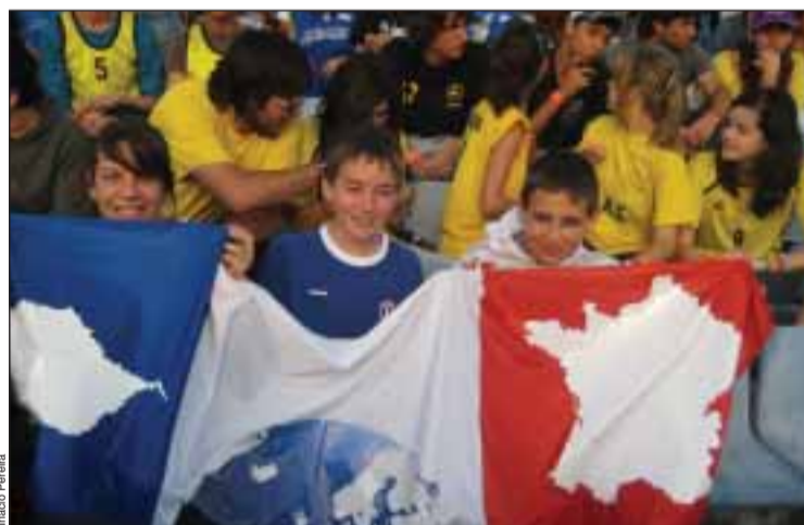
Participantes na Festa de 2009