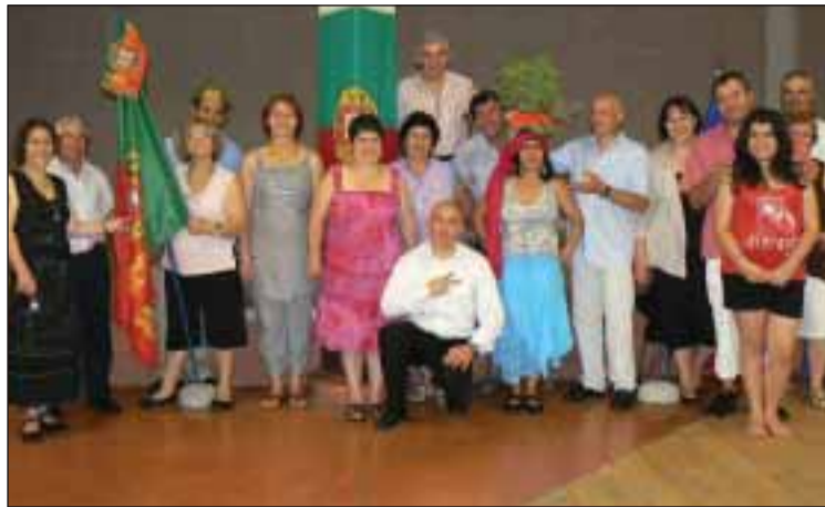
Portugueses da Albi festejam vitória no Campeonato de Futsal