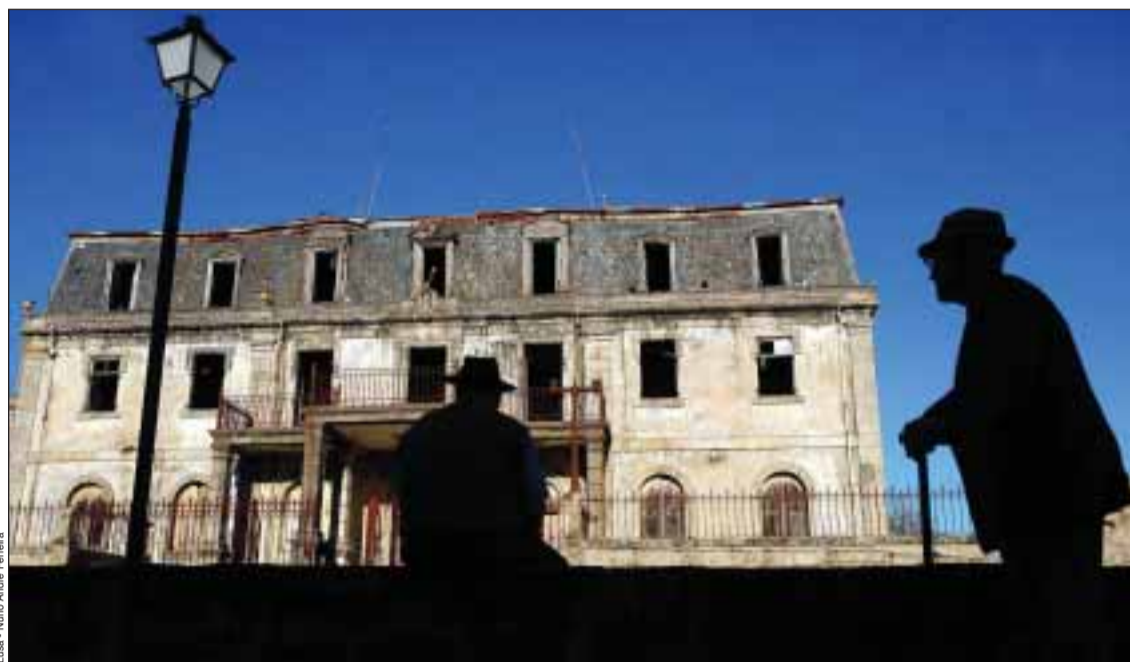
Casa do Passal, em Cabanas de Viriato - Cada onde morou Aristides de Sousa Mendes, hoje em ruínas

Por considerar que a Fundação não pode ficar de braços cruzados e