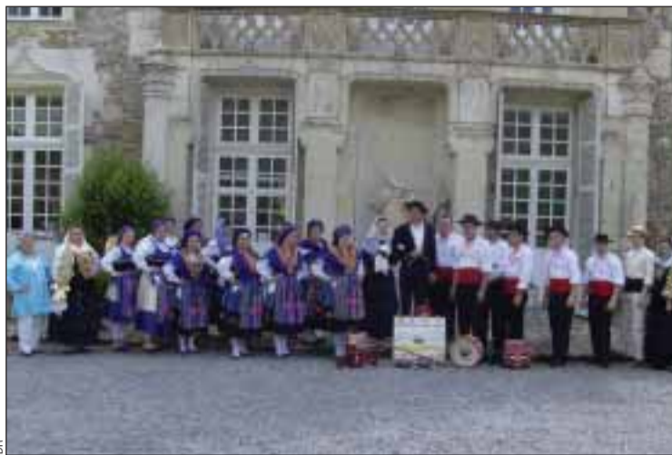
Groupe de folklore 'Estrelas de Portugal' de Nantes Pin-Sec

L'ACP de Nantes Pin-Sec existe depuis 1988 et compte environ une cinquantaine d'adhérents; elle tourne beaucoup autour de son groupe de folklore 'Estrelas do Minho' qui attire des nombreux adeptes d'âges très variés. Le groupe représente la