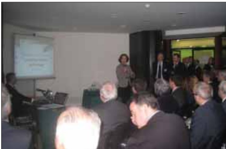
Intervenção de Anne Marie Idrac à Lisboa

Le 1 er février, la Mission Economique Ubifrance de Lisboa organisait son premier événement commercial, une journée de Rencontres Acheteurs autour de «la Grande Vitesse au Portugal» visant à favoriser des partenariats bilatéraux sur ces très grands projets: un réseau de 550 Km pour un investissement de 8,2 M d'euros, trois axes prévus (Lisboa-Madrid, Lisboa-Porto et Porto-Vigo) pour une mise en service étalée entre 2013 et 2015.