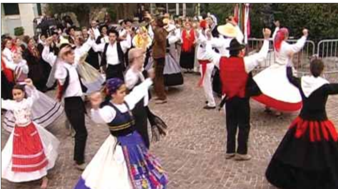
Grupo folclórico dos Portugueses do Mónaco - um dos melhores grupos de região

O grupo tem cerca de 50 elementos, muitos deles jovens da segunda geração, que prometem dar continuidade ao folclore, mas como em