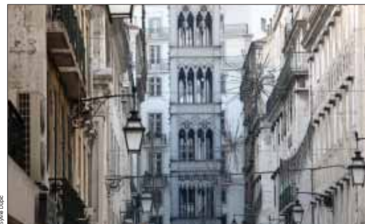
Lisboa by Sylvie Dupic

La plupart des photos ont été prises l'année dernière et cette année, et avec cette exposition, Sylvie Dupic espère faire remémorer au public portugais - qu'elle espère sera nom-