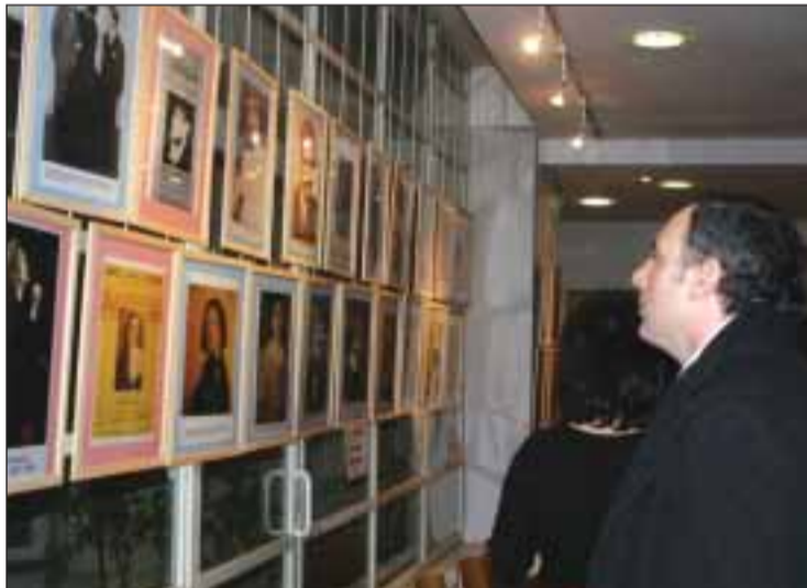
Exposição sobre Fado, no Consulado de Portugal em Paris