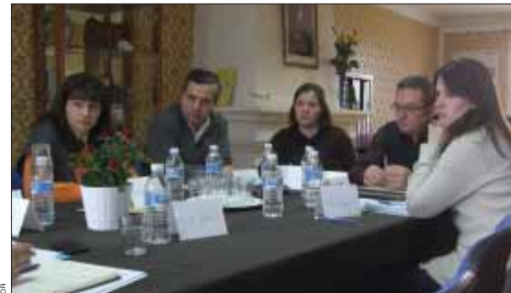
Aspecto parcial da reunião do Conselho Consultivo em Nantes