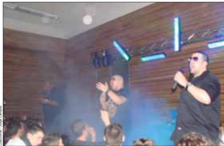
O grupo La Harissa, na região de Lyon

Com seis álbuns no seu ativo e uma agenda de concertos repleta até ao fim-do-ano, Os La Harissa vão cantar não só em França (onde Dijon, Clermont-Ferrand, Mulouse, esperam a