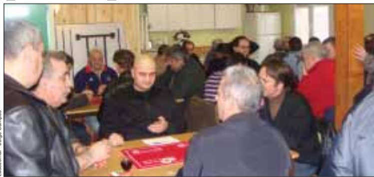
Jogadores em pleno Campeonato, em Decines

No passado sábado dia 13 de fevereiro, a Associação portuguesa de Decines (69) acolheu mais uma jornada do Campeonato de sueca inter-associações da região de Lyon e organizou um almoço com uma ementa bem portuguesa: “Bacalhau com batata a murro”.