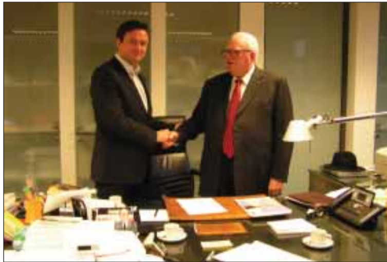
Bruno Cavaco avec Pierre Mauroy

Pierre Mauroy, de son bureau, la stature imposante, me raconta avec bienveillance l'histoire de cette vitrine: «La Bataille de La Lys pendant la première guerre mondiale dans le Nord-Pas de Calais plaça le Corps Expéditionnaire Portugais en première ligne du combat. De nombreux soldats sont morts ou ont été prisonniers. Les Allemands pour humilier les soldats, lors d'un été très chaud,