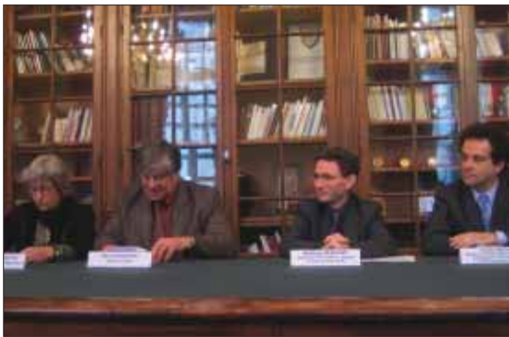
Moment de la signature de la convention

Un accord de coopération entre la ville de Braga et de Clermont-Fer-