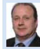
■ Carlos Gonçalves Deputado (PSD) à Assembleia da República

Uma das condições essenciais para a boa aplicação de políticas dirigidas a um sector de governação, como o das Comunidades portuguesas, é conhecer o universo de cidadãos a que elas se destinam pois só dessa forma teremos uma real noção do impacto da sua aplicação e das consequências positivas ou negativas que poderão gerar junto das pessoas.