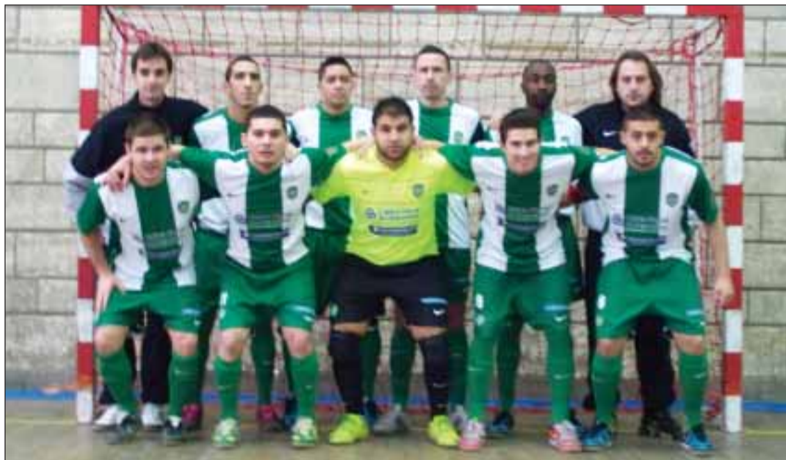
Sporting Club de Paris, a melhor equipa francesa de futsal