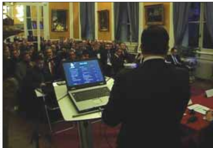
Aspecto da Assembleia Geral da CCIFP

Os dirigentes da CCIFP passaram em revista as atividades realizadas