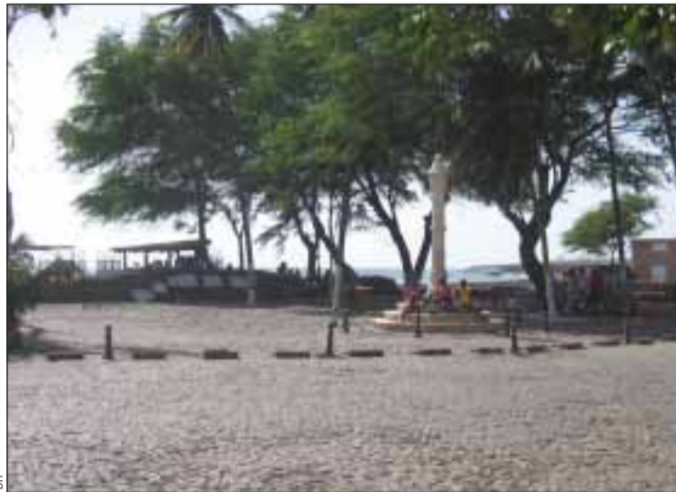
Pelourinho, Cidade Velha, Cabo Verde

de Santiago faz charneira entre o espaço lusófono, onde se inclui (é membro da UCCLA), e o vasto espaço de língua e cultura francesas", afirmou Manuel de Pina.