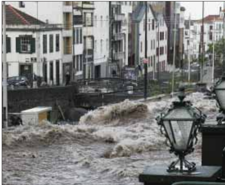
Funchal: as ruas transformaram-se em torrentes de água