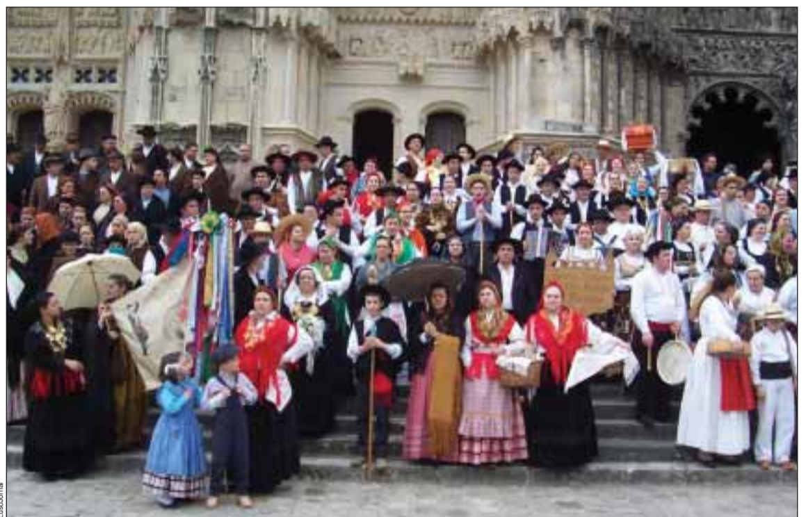
Grupos de folclore no Festival da Federação, em Bourges (foto de arquivo)

Assim, serão abordados os temas seguintes: A etnografia, as tradições e o folclore; as influências da representação do folclore português no século XX; estudos etnográficos: as recolhas: trabalho campo/validação; as fontes de investigação histórica; a dança