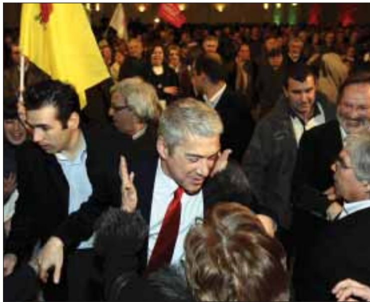
José Sócrates diz-se "acarinhado" pelo Partido