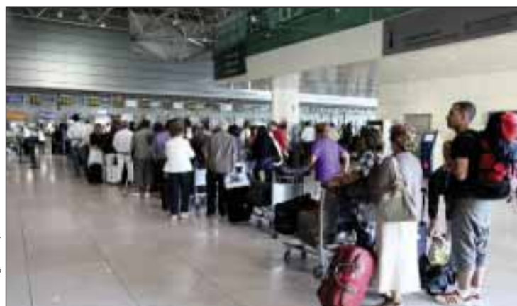
Aeroporto de Lisboa

niz, é composta por "pessoas com formação, muitas vezes com cursos superiores, cursos profissionais ou cursos técnicos, que não têm saída profissional em Portugal" e que precisam de procurar emprego fora para pagar as prestações da hipoteca da casa em Portugal.