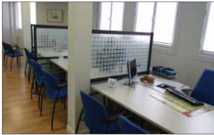
Consulados podem fechar no dia 4 de março

"Temos muitas razões para fazer greve" diz o Comunicado do STCDE. "Queremos estatutos profissionais respeitados, queremos a atualização devida, equiparações salariais e respeito pelo salário mínimo nacional, queremos avaliação justa, competente e honesta, queremos segurança social para todos e queremos créditos sindicais conforme acordado". Por todas estas razões, o STCDE adere à greve nacional da função pública marcada para o dia 4 de Março, quinta-feira da próxima semana. Os dirigentes do STCDE dizem que o Governo, tem-se "recusando a responder aos pedidos de abertura de negociações, pretende aplicar a prevalência da legislação local aos trabalhadores dos serviços externos, conforme consta dos contratos que vem mandando assinar, à revelia do Regime de Contrato de Trabalho em Funções Públicas" e mostram-se também solidários para com os trabalhadores do Instituto Camões. "O Gover-