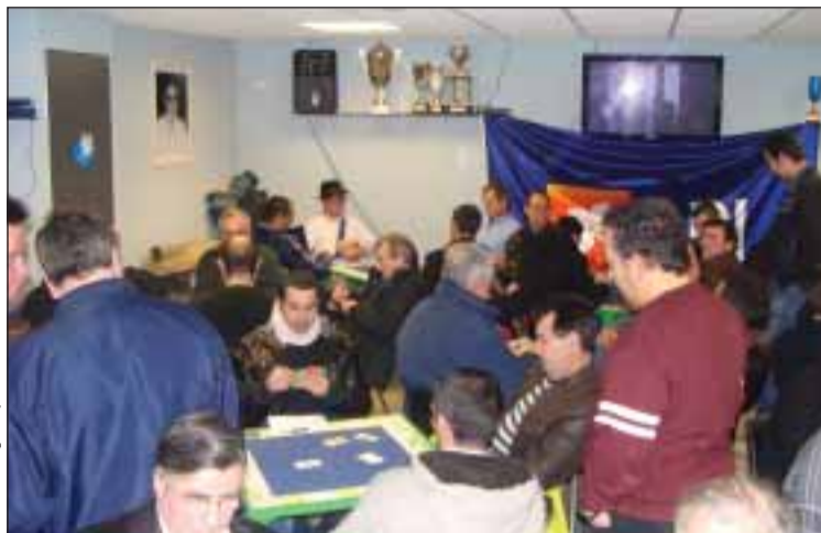
Aspecto geral da sala de jogos

No grupo de folclore, contando os músicos (concertina, bombo e guitarras) e os dançarinos, cerca de cinquenta pessoas fazem viver e reviver as nossas tradições musicais, nos cantares e nas danças. Todos os sábados, a partir das 19h00 até às 22h30, nos