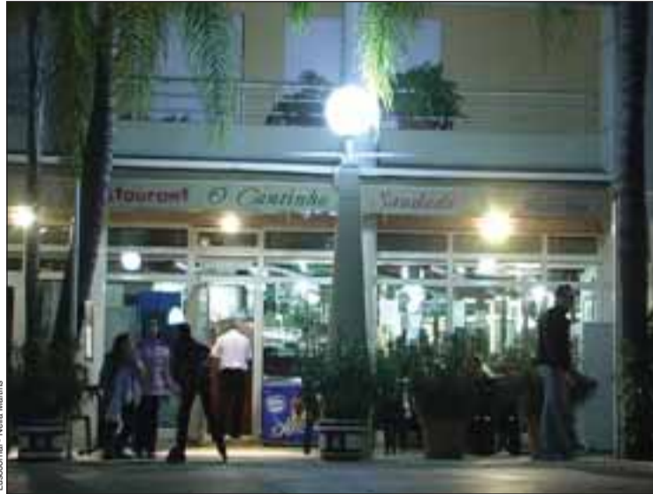
Restaurante O Cantinho da Saudade, em Beausoleil