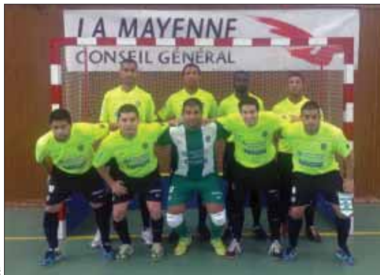
Sporting Club de Paris, uma das melhores equipas de futsal