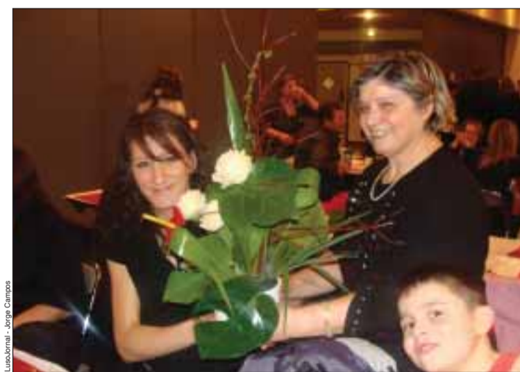
Houve convívio... e flores, em Neuville

"Temos uma boa notícia para dar. Abandonámos os nossos antigos locais onde funcionava a sede, devido à não conformidade das instalações, mas hoje é já uma nova realidade, pois já nos foram entregues as cha-