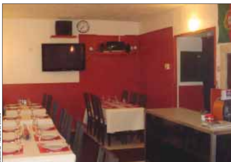
Aspet partiel de l'intérieur du restaurant Oliveira's

Plus en contrebas, à la naissance de la rue des Allemands, le 'Si Senhor', fruit d'un mariage ibérique, vous invite à embrasser le continent ibérique tout entier. Les amateurs de charcuterie et de fromages aux heures décalées ne s'y tromperont pas.