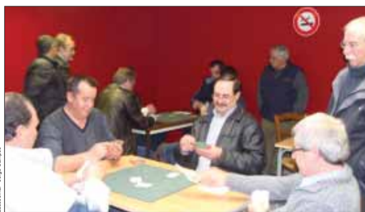
Jogadores do Campeonato de sueca em Decines

Os músicos, com duas concertinas, bombos, ferrinhos e cavaquinho, acompanham também quatro cantadeiras. Um grupo de bombos “Os amigos Rio Lima Alto Minho” fazem parte também desta associação, e