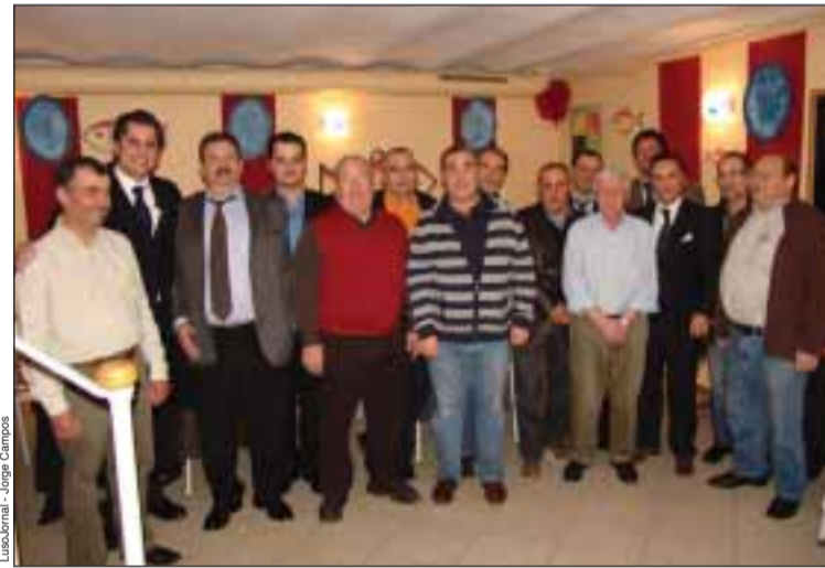
'Compadres' de Lyon em dia de Assembleia Geral

A Academia do Bacalhau de Lyon juntou-se para mais um jantar de confraternização, no dia 26 de fevereiro, tal como acontece todas as últimas sextas-feiras de cada mês.