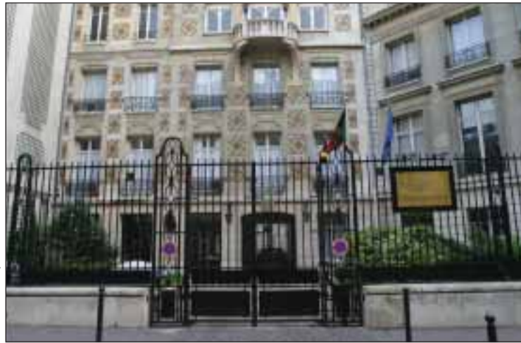
O Consulado geral de Portugal em Paris esteve praticamente fechado