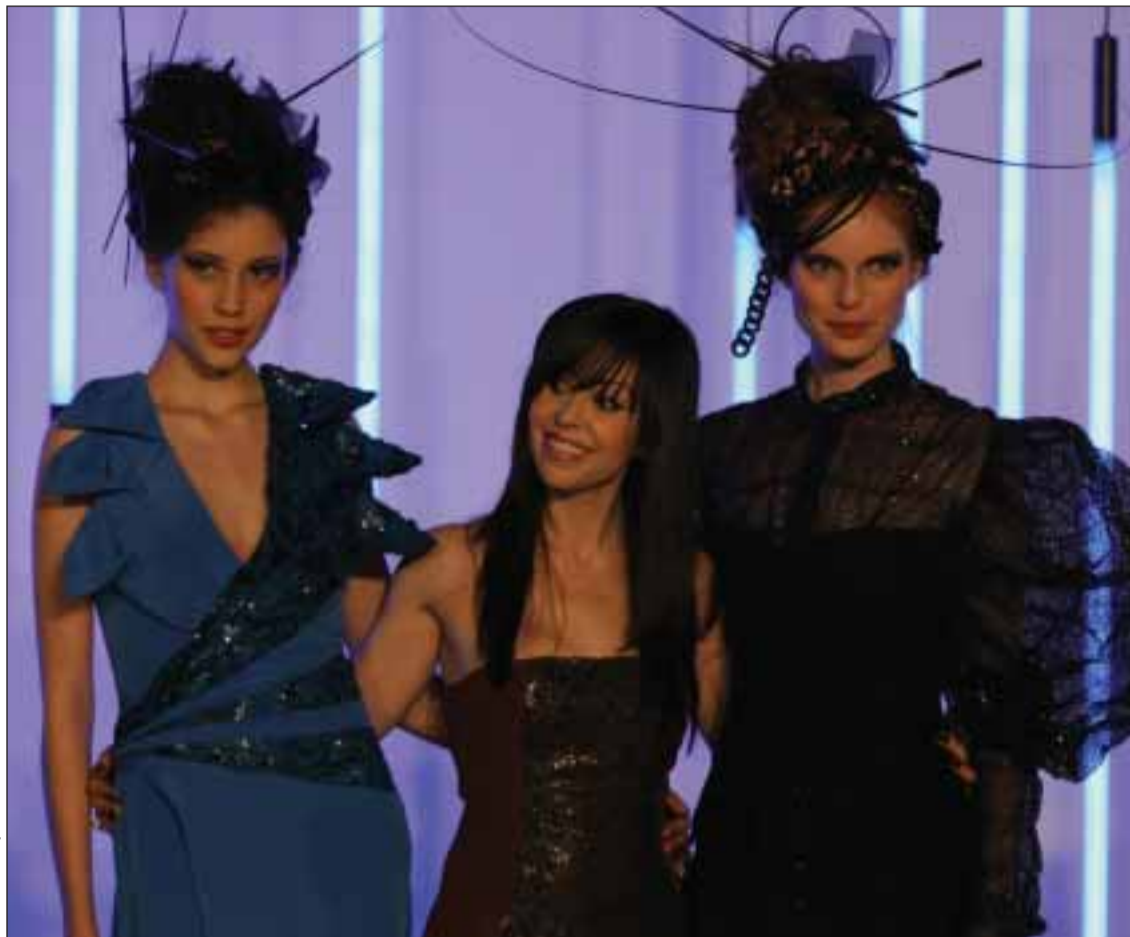
Fátima Lopes com os seus modelos, em Paris

Fátima Lopes prometeu brevemente um grande evento de moda na Madeira. "Nasci numa ilha paradisíaca e supostamente nada de mal podia acontecer lá. É incrível porque ainda no ano passado tinha pensado neste tema, e