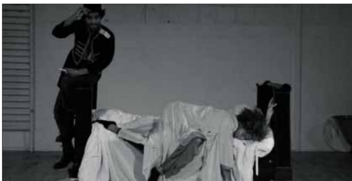
'Vénus', de Suzan-Lori Parks