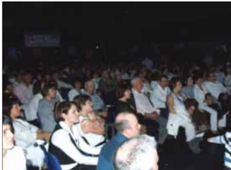
Muito público em Orsay

A associação Terra Lusa tem por objetivo divulgar e promover a cultura e as tradições portuguesas, mas também dos países lusófonos. Desta feita o tema era a cultura e tradições do nordeste brasileiro. Com a sala Jaques Tati em Orsay completamente lotada, "foi com grande alegria e satisfação" que foram recebidos todos os que vieram participar nesta festa.