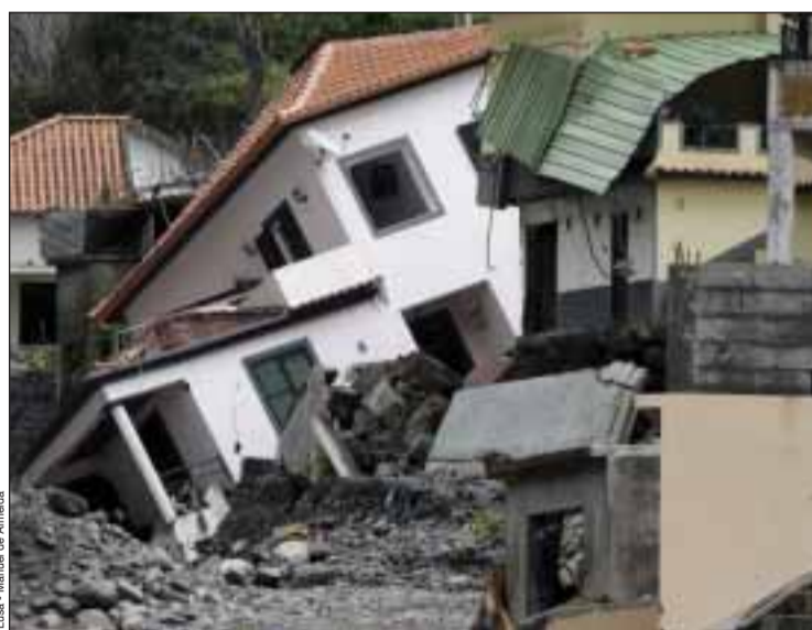
Estado devastador de uma parte da ilha

O diretor comercial da Top of Travel queixa-se de uma cobertura “distorcida” das consequências da catástrofe natural na Madeira pela comunicação social francesa. “Os media portaram-se como imbecis, como é hábito. Apenas dois ou três por cento da