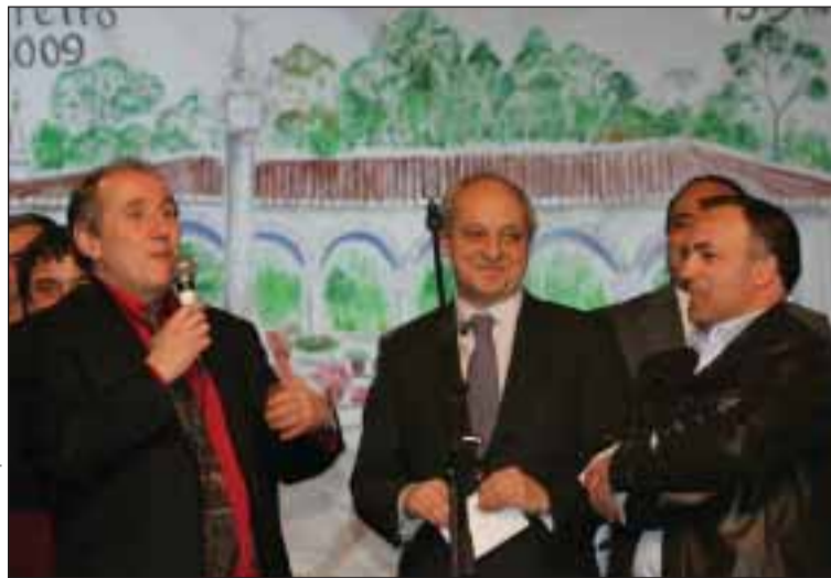
Inauguração da Feira, com discursos das personalidades

“Esta feira não está só aberta aos Portugueses. Se vir bem, temos muita