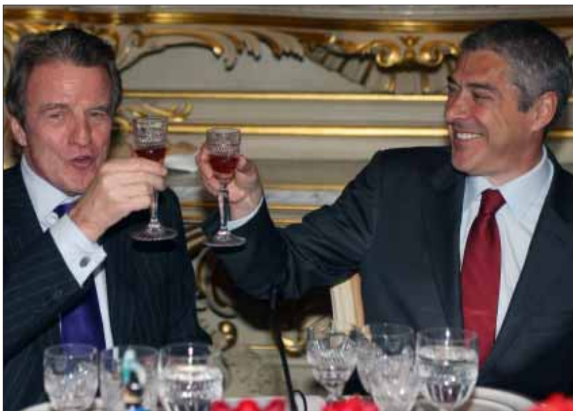
Bernard Kouchener, Ministro dos Negócios Estrangeiros, com José Sócrates

A política externa da França depende por parte dos objetivos e princípios da Organização das Nações Unidas, objetivos em conformidade com os ideais implícitos da tradição republicana francesa. Desde 1945, a França sempre defendeu a ONU da qual é o quarto maior contribuinte financeiro, com 81 milhões de euros em 2005, para o orçamento da Organização, e 80 milhões de