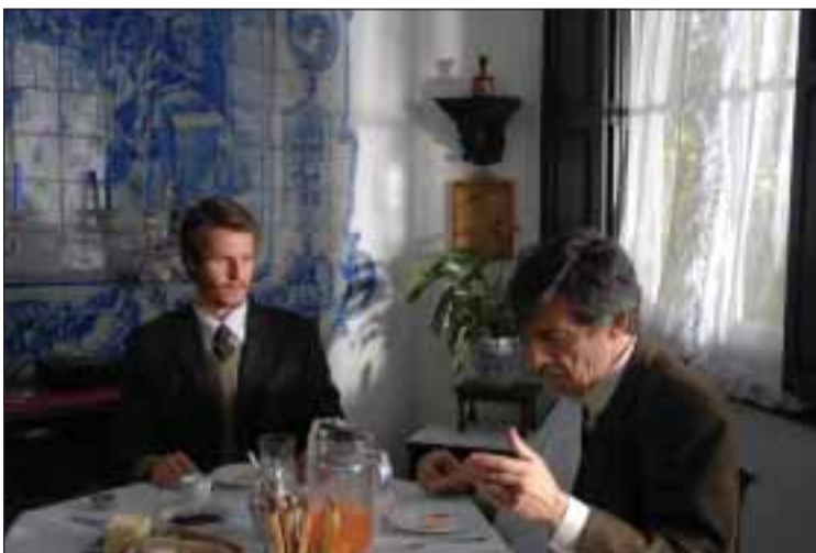
'Singularités d'une jeune fille blonde' de Manoel de Oliveira