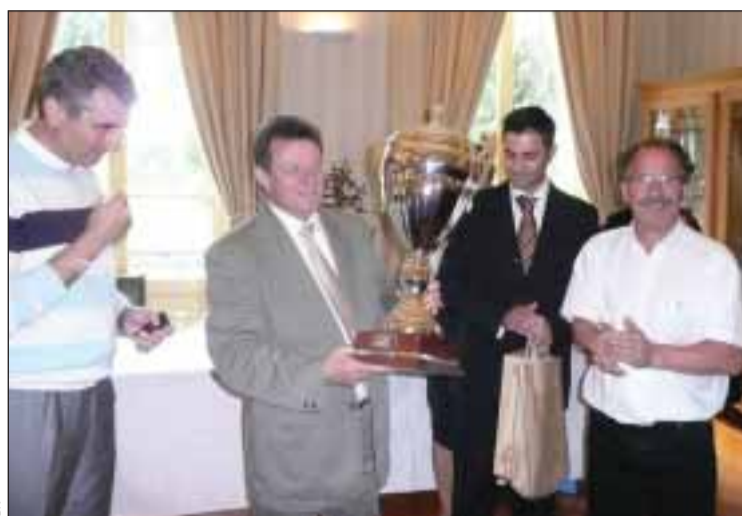
A associação recebe um trofeu na Mairie

Segundo o Secretário, o objetivo das festas e bailes, é de cativar mais sócios e ser convivial. “As pessoas não