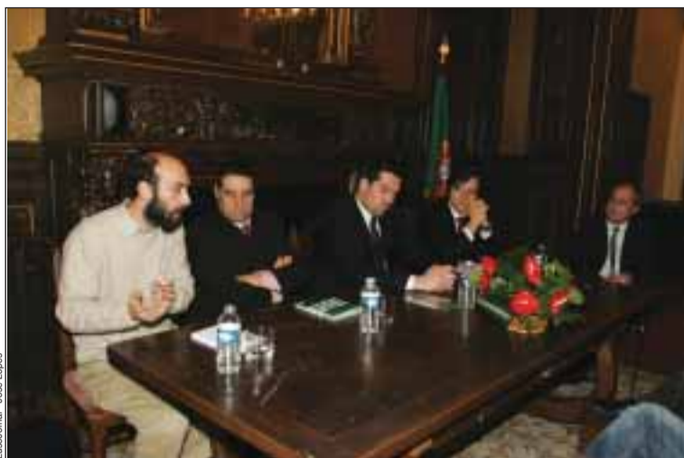
Intervenientes na Mesa redonda organizada pelo LusoJornal