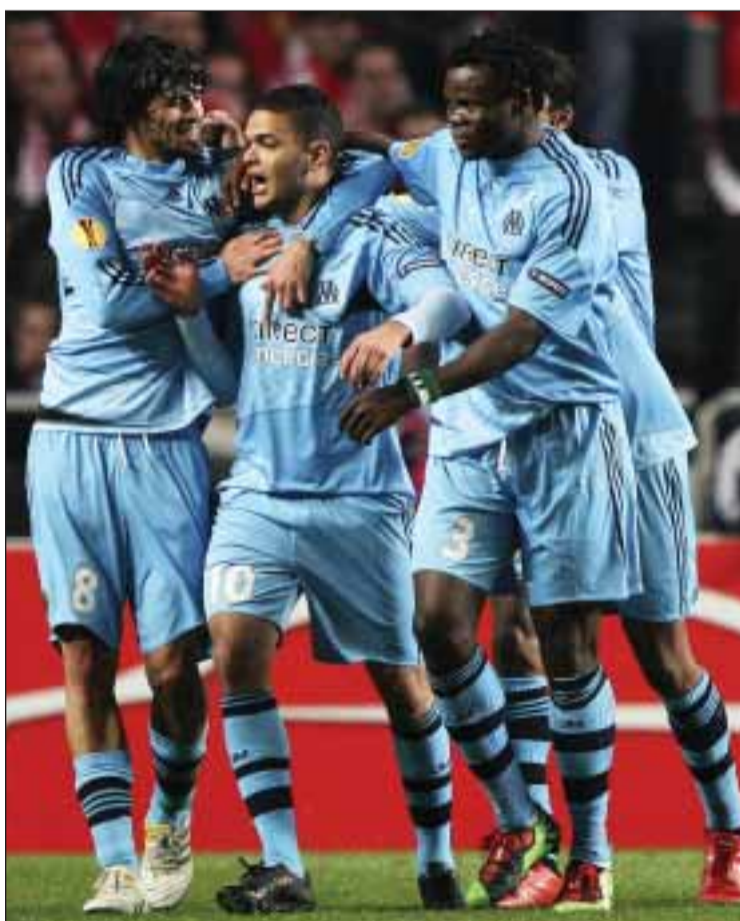
Jogadores do Marseille festejam o golo

"Mesmo tendo empatado no momento em que estávamos um pouco menos bem, não merecíamos perder", afirmou Didier Deschamps, em referência ao golo da igualdade apontado por Ben Arfa, ao minuto 90, depois de Maxi Pereira ter inaugurado o marcador no