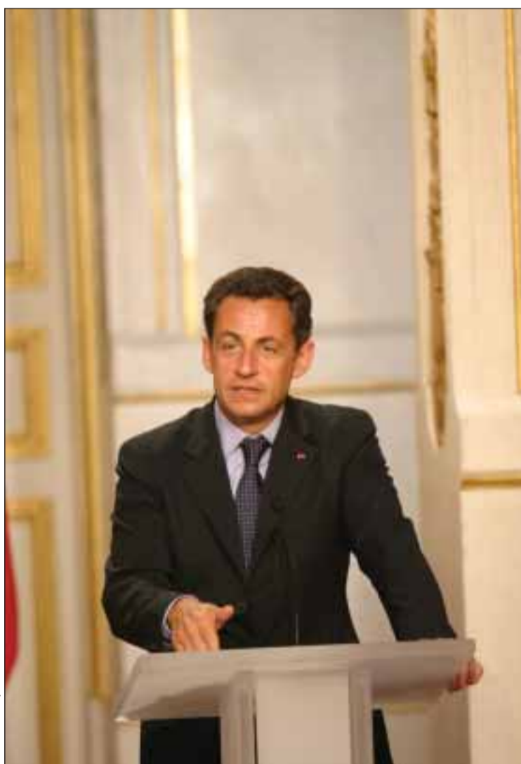
Nicolas Sarkozy, Presidente da República francesa

2. O segundo princípio reside no 'interesse específico sem ideologia'. Os interesses podem ser múltiplos. Existem interesses políticos, mas existem também interesses económicos e culturais, como a língua francesa. Esta preocupação sempre esteve no centro da atividade diplomática de todos os países. Parece-nos preocupante, um Ministro dos negócios estrangeiros ter dito recentemente e publicamente, que era preciso substituí-la por uma diplomacia de mera "influência" (no sentido de amizades regionais). Nesse assunto podemos lembrar-nos da intervenção do General de Gaulle no Conselho dos Ministros quando um deles falava dos "nossos amigos americanos": "«Monsieur le Ministre, un grand pays n'a pas d'amis, il n'a que des intérêts!»". Cada preocupação ideológica deve ser