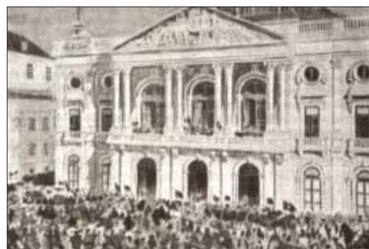
Câmara Municipal de Lisboa

Né à Seia, Afonso Costa a fait des études de Droit à l'Université de Coimbra. Avocat, professeur universitaire, politique, républicain, portugais d'Etat et un des principaux artisans pour l'établissement de la République au Portugal, il est incontestablement une de ses figures dominantes. C'est lui qui a publié la loi de séparation entre l'Église et l'État, l'expulsion des jésuites, le droit de la famille et du divorce, l'abolition de la conscience rigoureuse en matière religieuse, la légalisation des communautés non catholiques, l'interdiction