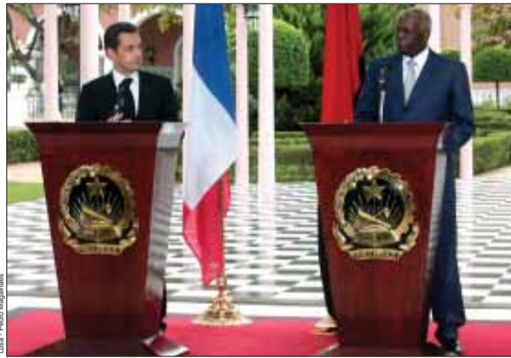
Nicolas Sarkozy com o Presidente angolano

A França e o Médio-Oriente: a criação de uma União Mediterrânea para reforçar as cooperações entre os países do Mediterrâneo.