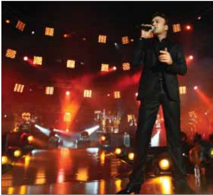
Tony Carreira, cantor romântico

O cantor de Dourdan (94), vocalista do grupo Irmãos Cinco, que animavam espectáculos não só na região parisiense mas também em toda a França e nos países vizinhos, mudou-se de malas e bagagens para Portugal. Mas continua a ter um “carinho particular” pela França. “Eu comecei a cantar em França é um facto e não só no aspeto da carreira, mas tam-