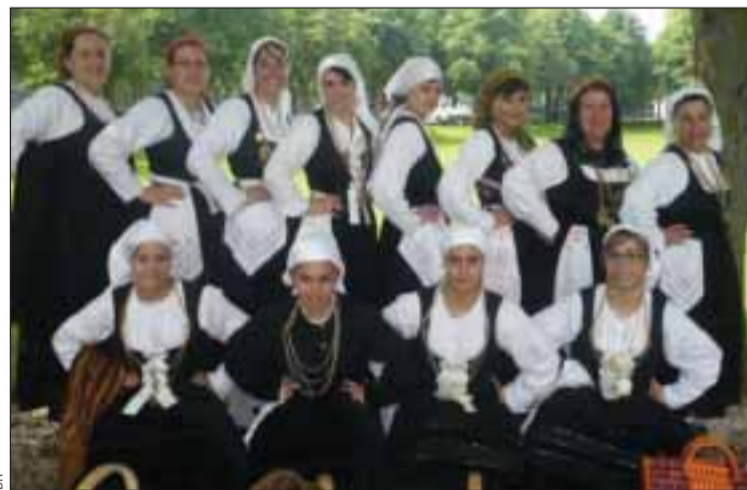
Rancho folclórico Lavradeiras do Alto Minho, da associação Soleil du Portugal de Yverres (91)

A associação 'Soleil du Portugal' de Yverres (91) festeja o seu 23º aniversário no próximo 17 e 18 de abril. Começando no sábado a partir das 21 horas com um encontro amigável de concertinas que terá lugar na sala René Fallet, em Crosne (91). No dia seguinte a partir das 14h30, um festival folclórico percorrerá as ruas animado por diversos grupos convidados: 'Juventude' de Villeneuve-le-Roi, 'Rosas de Portugal' de Villabé, 'Flores do Lima' de Villeneuve-St Georges, 'Lavradeiras de Santa Maria' de Boulogne, 'Aventureiros' de Thiais e 'Flores do Lima' de Villiers-le-Bel.