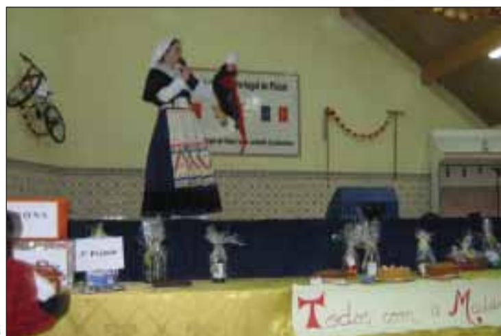
Todos com a Madeira, em Plaisir