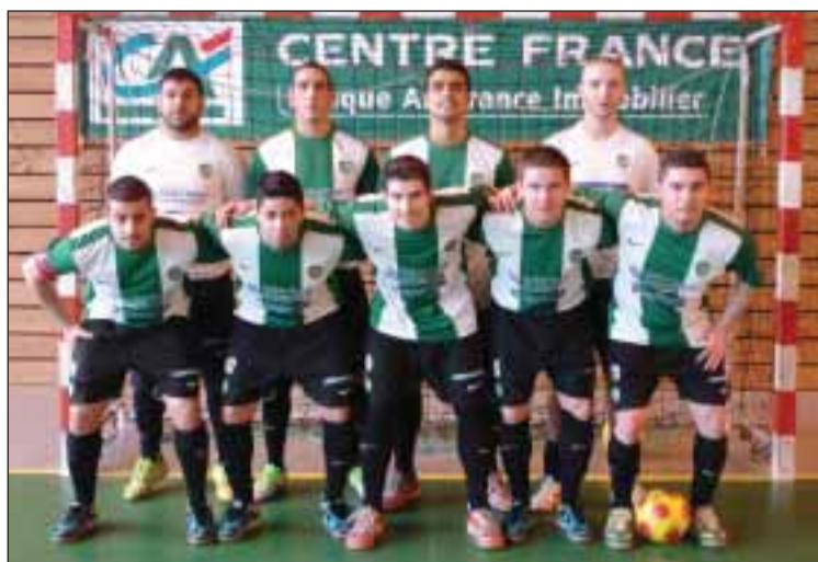
Sporting Club de Paris