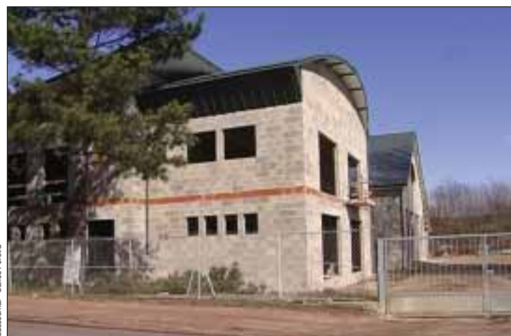
Casa de Portugal em construção em Dijon

marães, esteve presente para várias animações.