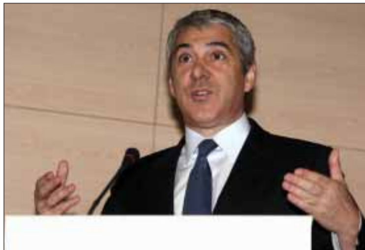
Luiza - Paulo Novais José Sócrates, Primeiro Ministro de Portugal

Esta participação como interveniente do Primeiro-Ministro português terá lugar em continuidade com a Cimeira Luso-Francesa, que se realizará durante o mesmo dia, na capital francesa. "A presença de Sua Excelência o Primeiro-Ministro de Portugal no nosso evento é uma verdadeira honra para a CCIFP. Isto confirma, a nosso ver, que o Fórum