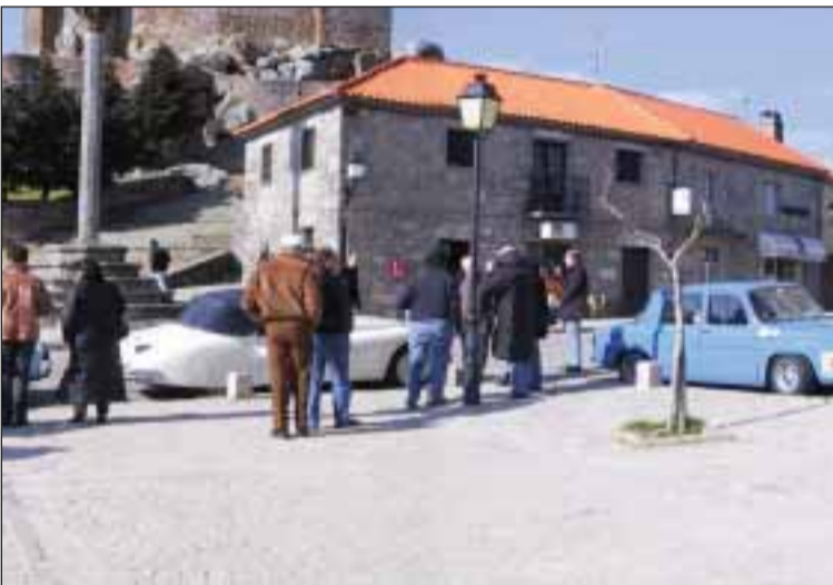
A caravana para todos os anos em Penedono (arquivo)

O 6º Rali dos Castelos com carros antigos, organizado pelo "Historic Racing Club" de Toulouse, vai partir no próximo dia 23 de abril de Toulouse, para regressar à "cidade côr de rosa" no dia 2 de maio, depois de passar por Peniche, Setúbal e Évora, entre outras cidades.