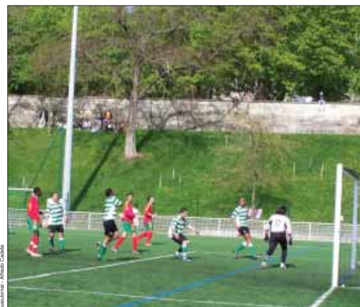
O Sporting Club de Paris em pleno ataque