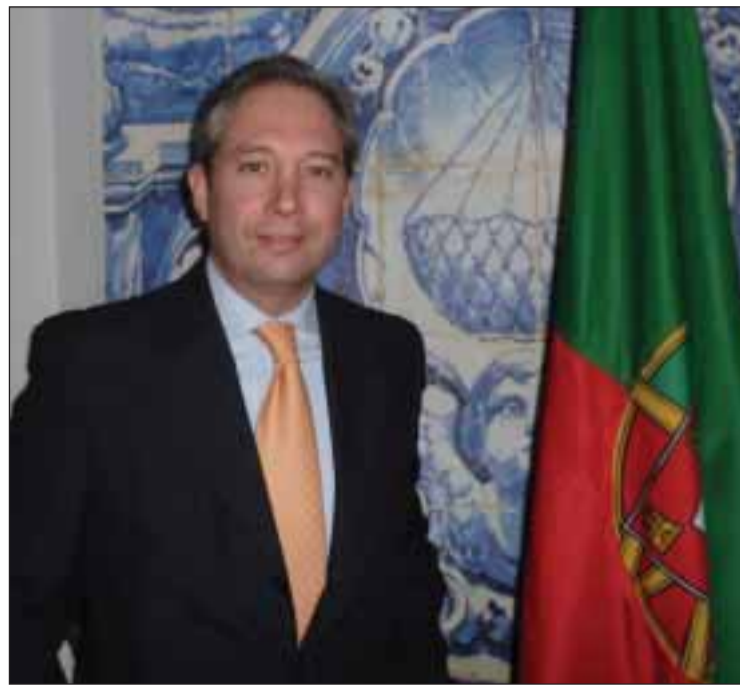
Cônsul-geral de Portugal em Lyon, António Barroso

O Cônsul anuncia uma reunião para o próximo mês de maio, mesmo sabendo que “o mais difícil é encontrar uma altura que permita a participação de todos”.