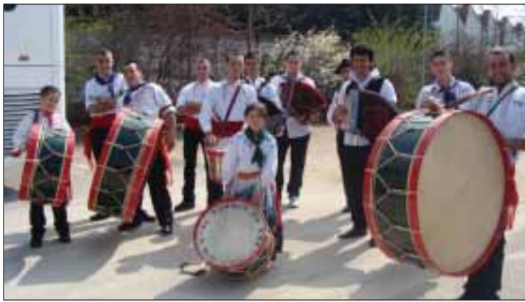
Grupo de bombos de St Martin d'Heyres

Esta associação existe desde a entrada de Portugal na CEE e daí o nome "Estrelas da Europa". Durante alguns tempos houve uma paragem e em outubro de 2008, um renascer do grupo folclórico que conta hoje com novas caras e novos músicos: quatro concertinas, duas violas, ferriños, bombos e cavaquinhos. São cerca de doze pares de dançarinos, onde a juventude tem lugar de desta-