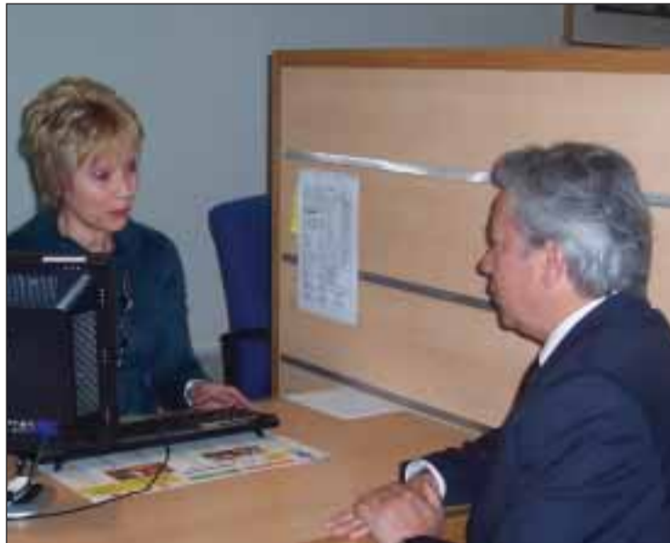
António Braga é atendido no Consulado de Portugal em Paris

Qualquer cidadão português, em qualquer ponto da rede consular ou diplomática portuguesa, pode, "com grande eficácia e em muito pouco tempo", tratar de documentos ou outros assuntos com a administração pública, salientou António Braga à imprensa. "Uma operação tão simples ou complexa como fazer o Cartão do Cidadão ou o Passaporte eletrónico é possível em qualquer parte do mundo e significa que a reforma consular nos dá hoje esta garantia de qualificação dos serviços e o exercício pleno de cidadania onde exista um Consulado ou uma Embaixada", acrescentou o Secretário de