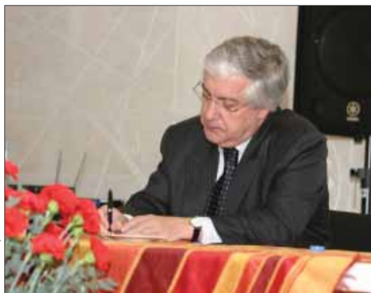
Francisco Seixas da Costa

“A administração Obama criou uma grande expectativa, não apenas de um reforço da relação institucionalizada União Europeia-Estados Unidos, mas também de uma maior abertura dos EUA para explorarem, ao nível das organi-