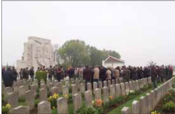
Cerimónia no Cemitério Militar Português de Richebourg

A presença dos soldados portugueses na região e a instalação de muitos deles em França, foi conside-