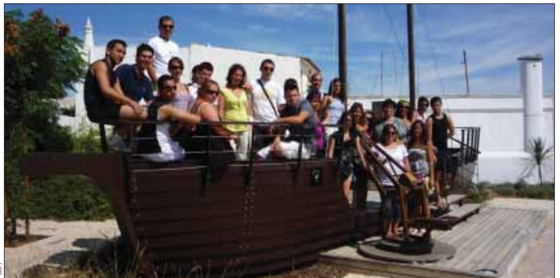
Jovens participantes no Encontro do ano passado

A participação no encontro é gratuita. O alojamento, a alimentação, os transportes em Espinho e as atividades serão ao encargo dos parcei-