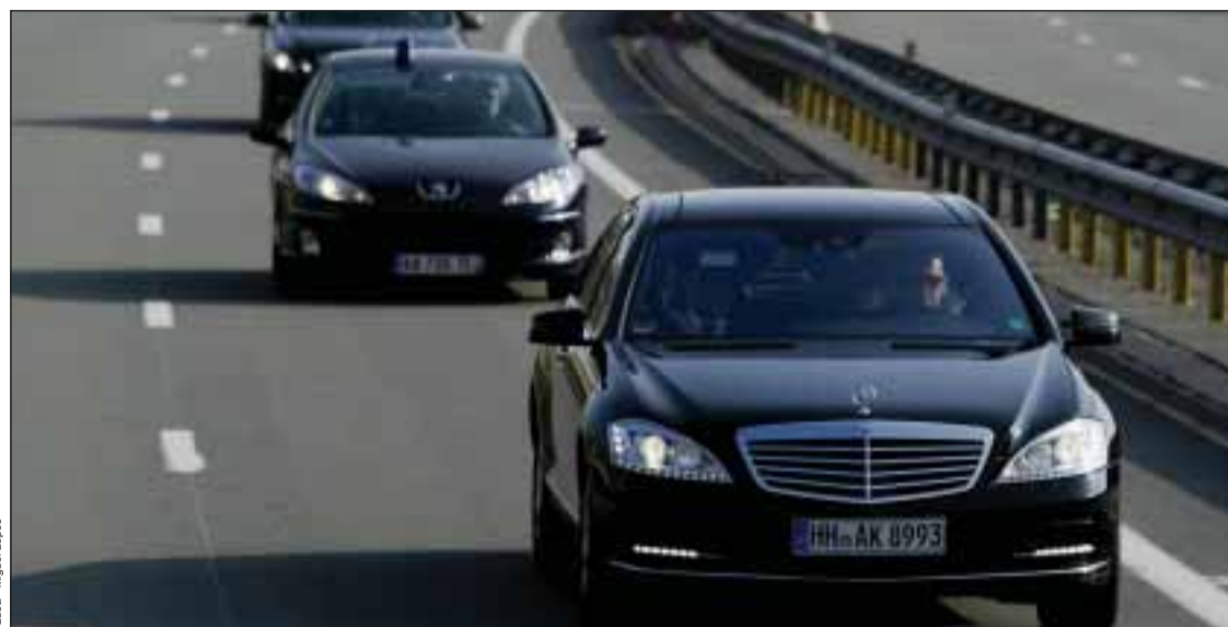
Cavaco Silva atravessou a França de carro numa comitiva que também levou 3 autocarros