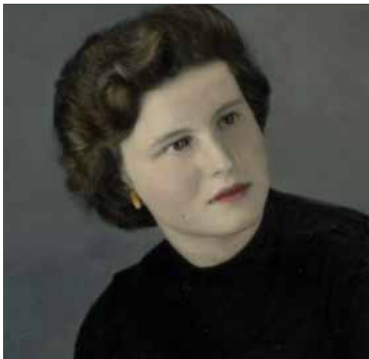
Uma das poucas fotografias que a família tem

descontos para a CNAV e pagava as prestações na Delegação de Versailles, no entanto a mesma instituição só fornece informações pessoalmente ou seja terá alguém que se deslocar a Paris para o fazer” diz a