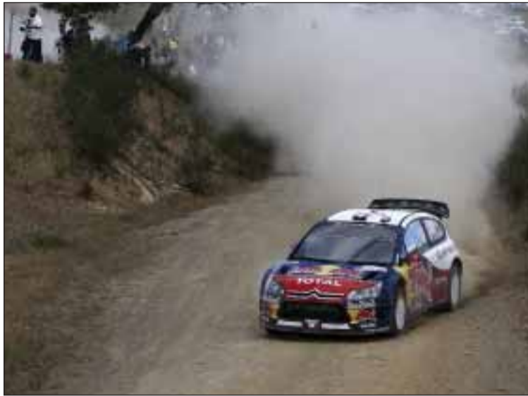
Sébastien Loeb foi segundo em Portugal mas lidera o Campeonato

Apesar do segundo posto, Loeb, que tentava uma terceira vitória em Portugal, não fez uma má operação, até porque ganhou terreno aos dois Ford que o perseguiam na classificação, alargando para 50 pontos a vantagem sobre o finlandês Mikko Hirvonen, que foi apenas quarto em Portugal e é terceiro da geral, e para 54 pontos sobre Latvala, agora quarto no Campeonato.