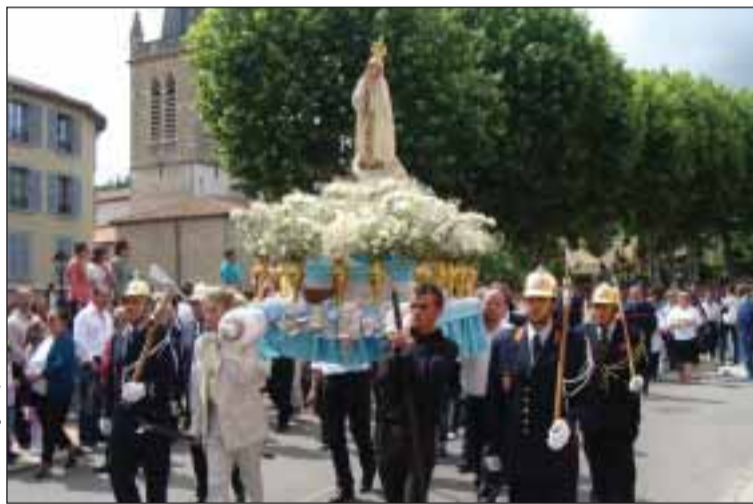
Procissão em Montluel

No fim-de-semana passado, dias 29 e 30 de maio, decorreu a peregrinação em honra de Nossa Senhora de Fátima, em Montluel, na região de L'Ain, região vizinha da região Rhône onde a Comunidade portuguesa é muito numerosa.