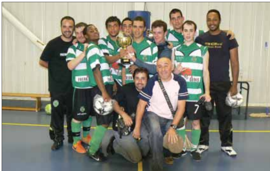
Sporting Futsal de Albi tem razões para festejar

Campeão da Divisão Excellence com subida ao nível Regional na próxima época, e de volta no ginásio onde tinha conquistado duas semanas antes a Taça do Tarn de Futsal, a equipa da Associação Desportiva e Cultural dos Portugueses de Albi, o Sporting Futsal Club, conseguiu um terceiro título ao conquistar a Taça do Challenge Distrital Tarnais de Futsal ao vencer a equipa do Conseil Général du Tarn por 5-2. O calor e o fim da época pesaram nas pernas das duas equipas. Com uma grande equipa do Conseil Général na primeira par-