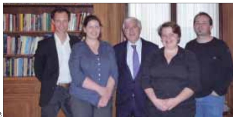
Embaixador com bloguistas

Um grupo de bloguistas franceses, com posições influentes em áreas tão diversas como a literatura, o ambiente ou a gastronomia, teve um encontro com o Embaixador português em França, Francisco Seixas da Costa, ele próprio autor do blogue "Duas ou três coisas".