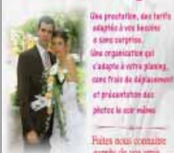
PHOTO LIMA Specialiste de la Photo de Mariage

Une prestation, des tarifs adaptés à vos besoins et sans surprise. Une organisation qui s'adapte à votre planning, sans frais de déplacement et présentation des photos le soir même.