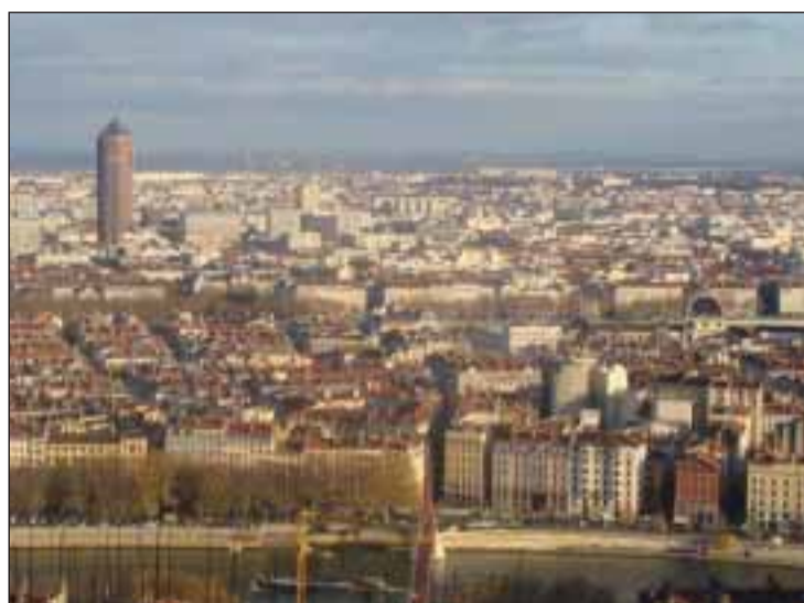
Cidade de Lyon, que vai acolher o Embaixador de Portugal

Nesse mesmo dia, já em Lyon, manterá um encontro com o Prefeito da Região Rhône-Alpes, Jacques Gérault, visitará o Consulado-Geral de Portugal e terá a possibilidade de conhecer as figuras mais representativas da Comunidade portuguesa de Lyon e Região Rhône-Alpes num “cocktail dînatoire” oferecido pelo Cônsul-Geral de Portu-