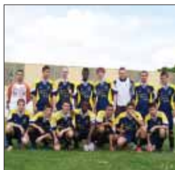
Equipa de Arpajon

Com a sua juventude e os seus conhecimentos, porque trabalhou ao lado de muitos grandes profissionais de futebol português, e depois de ter encontrado residência nos arredores de Arpajon (Essonne), foi contratado