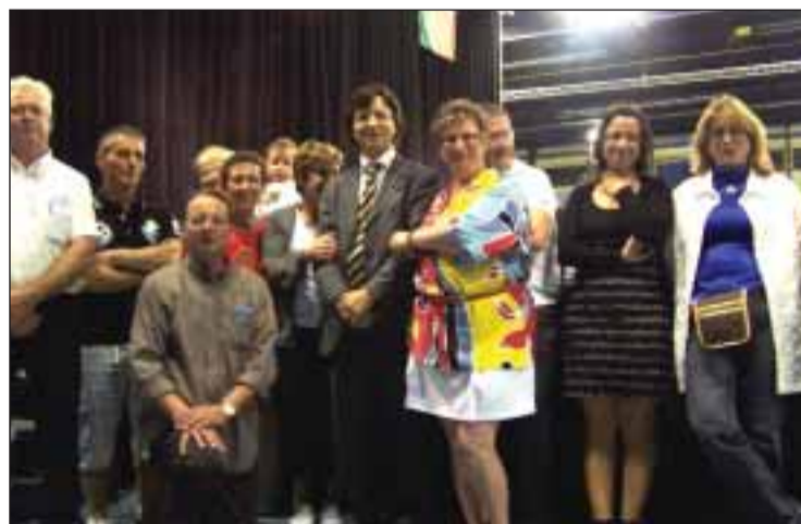
Cônsul-adjunto Pedro Monteiro, em Issoudun

A segunda edição do Festival de folclore franco-português realizado em Issoudun (Indre - 36), uma cidade entre Vierzon e Châteauroux contou com a presença do Cônsul-Geral adjunto de Portugal, Pedro Monteiro. Segundo os dirigentes da associação cultural franco-portuguesa Amizade, organizadora do evento, tratou-se da primeira presença de um representante de um Consulado numa iniciativa da Comu-