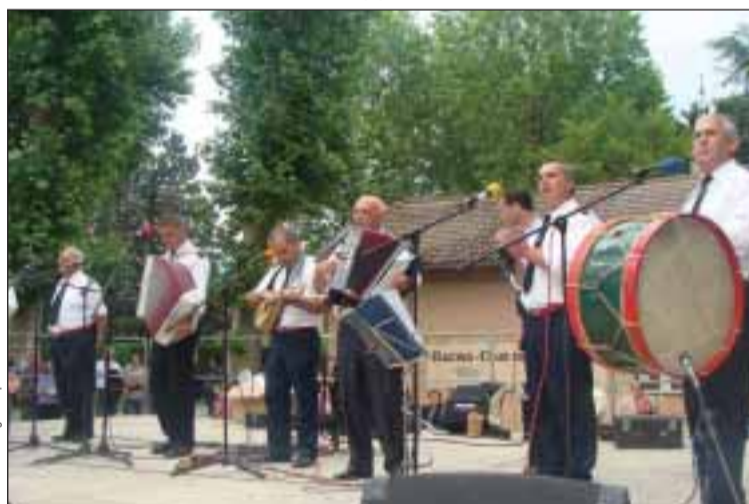
Grupo musical dos Bombeiros Voluntários de Guimarães

Nos Bombeiros Voluntários de Guimarães existem duas formações musicais: uma fanfarra e um conjunto de música regional, tradicional e popular portuguesa.