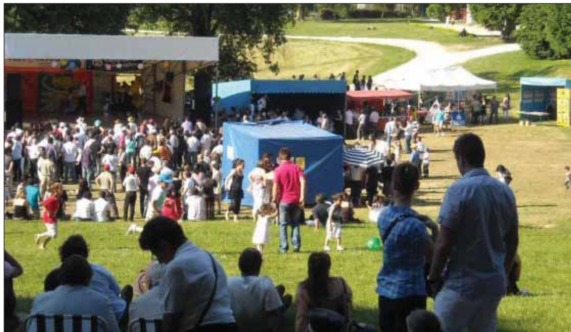
Aspetto do parque onde se realizou a festa

A notar também a reunião de duas "Casas dos Arcos de Valdevez": a de Paris e a de Lisboa, para a maior felicidade dos seus Presidentes, Francis-