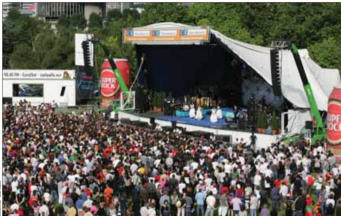
Muita gente na Festa da Rádio Alfa