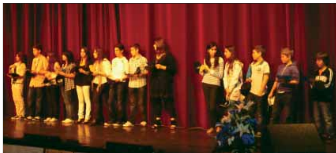
Alunos premiados em Neuilly-sur-Seine

O Embaixador congratulou-se com o facto de poder partilhar com uma parte da Comunidade portuguesa um pouco do pouco tempo de que dispunha para dar satisfação às múltiplas solicita-