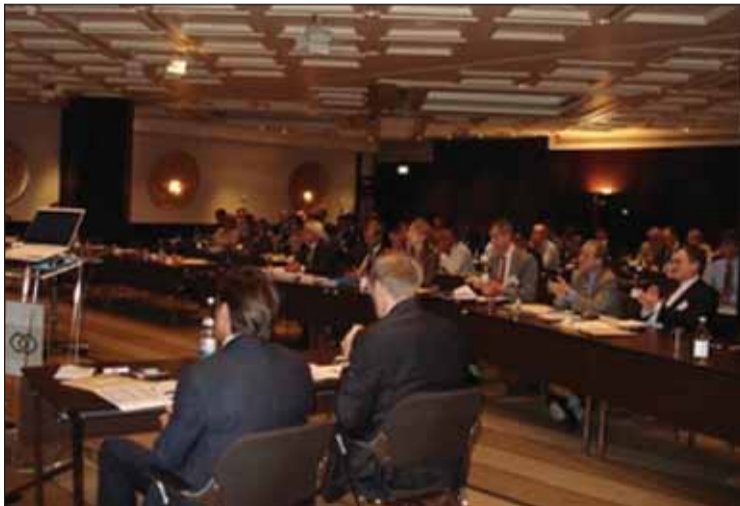
Réunion organisée par Ubifrance, à Lisbonne

L'offre française couvrait une vaste gamme d'activités: conseil (ingénierie, simulation, planification, organisation, stratégie), travaux publics, contrôle technique, gestion du trafic et sécurité aérienne, équipements