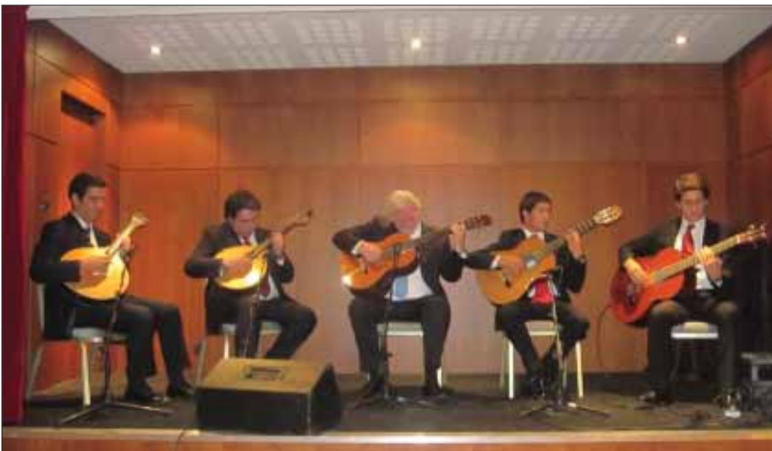
Grupo de guitarras portuguesas tocou em Toulouse

Ainda antes do jantar os representantes da empresa estilista VIP - Very Importante Portuguese - e um grupo de jovens manequins, deram a co-