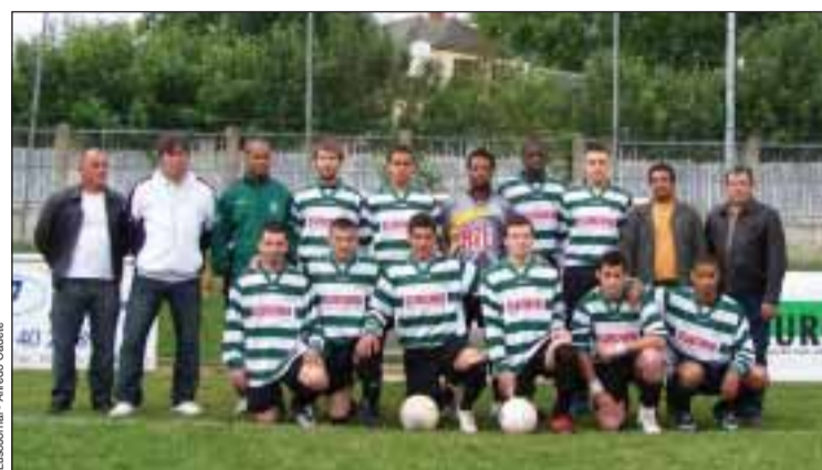
Sporting de Pontault-Combault

Pela negativa, sete equipas tiveram um Campeonato dececionante, onde a maior deceção vai para os Lusitanos de Saint-Maur (Divisão de Honra da Liga de Paris) que depois de seis épocas neste Campeonato, e após uma grande mudança no elenco diretivo, em que o real objetivo era a subida ao CFA 2, infelizmente acabou por não acontecer, e pior ainda, no cair do pano, não conseguiram evitar a despromoção à Divião Superior Regional.