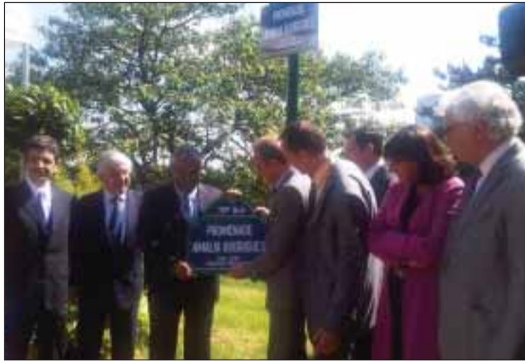
Inauguração da 'Promenade Amália Rodrigues'

No programa o Maire abordou igualmente o seu apoio para que o fado seja reconhecido como uma riqueza universal do património da humani-