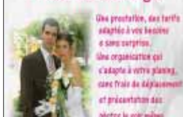
PHOTO LIMA Specialiste de la Photo de Mariage

Une prestation, des tarifs adaptés à vos besoins et sans surprise. Une organisation qui s'adapte à votre planning, sans frais de déplacement et présentation des photos le soir même.