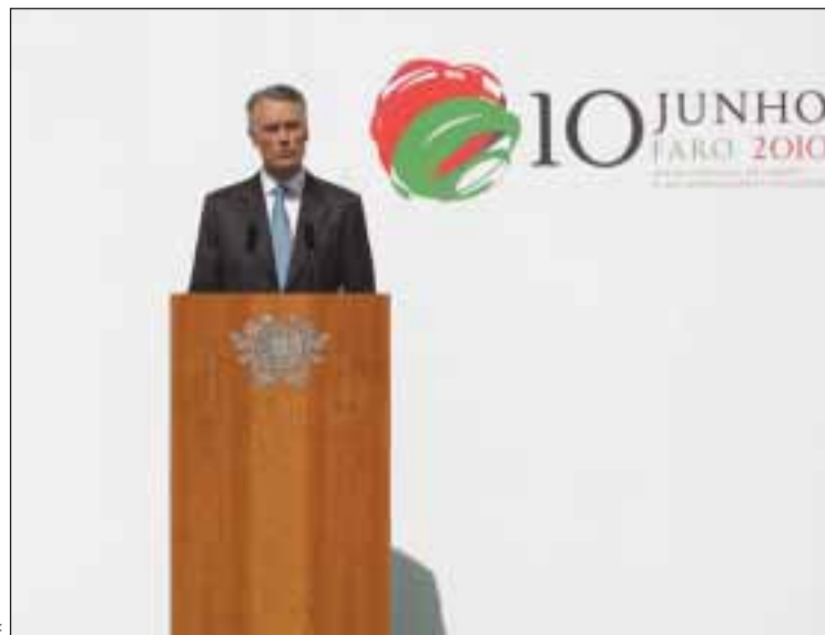
Cavaco Silva discursa em Faro

Orgulhamo-nos ao verificar como as Comunidades portuguesas souberam adaptar-se e estabelecer laços nos países de acolhimento. Alegramo-nos com o prestígio que aí alcançaram, prestígio que muito contribui para a afirmação de