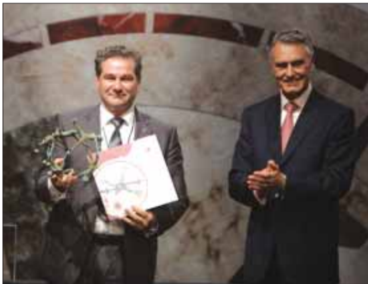
Cavaco Silva entregou prémio a Isidoro Fartaria

Este ano, houve 81 candidaturas. Os candidatos têm entre 29 e 91 anos e há representantes de todos os continentes, oriundos de 26 países. No