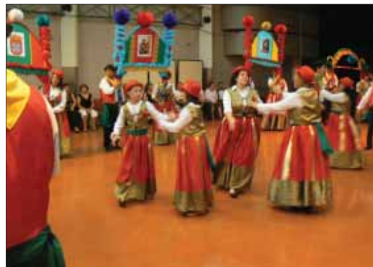
Grupo de Marchas em pleno espetáculo

Depois de ter ganho três títulos (Campeonato Futsal du Tarn, Taça do Tarn de Futsal e Challenge Distrital de Futsal) com a sua equipa de futsal, a Associação Desportiva e Cultural dos Portugueses de Albi (81) organizou no fim-de-semana passado a segunda edição do Desfile de Marchas dos Santos Populares na região Midi-Pyrénées.