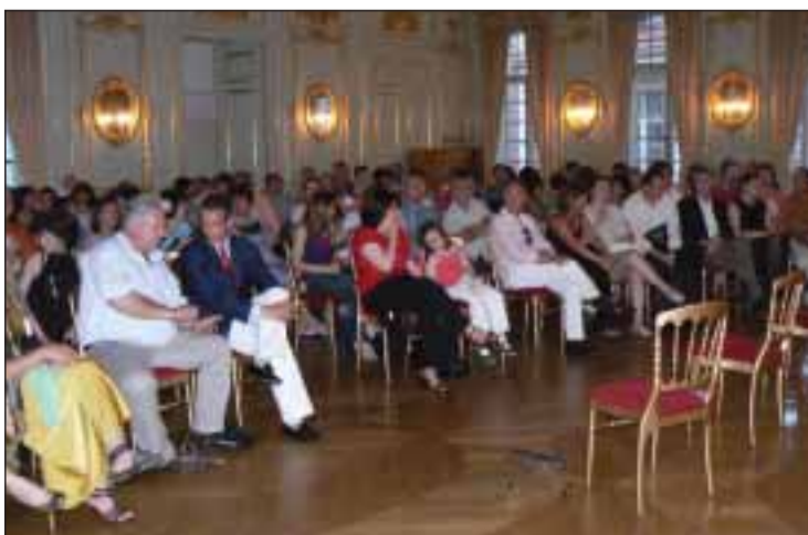
Beaucoup de monde pour assister à la Soirée fado de l'ACPS

Cette salle qui est en elle-même, un lieu enchanteur et qui, selon l'histoire a reçu le grand Maître, donne beaucoup de son ambiance, de son charme et un certain mystère mais, par contre, exige implicitement la réciprocité.