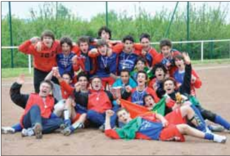
A alegria de quem ganha...

No passado dia 13 de maio, realizou-se o Torneio anual de futebol do Liceu Internacional de St Germain-en-Laye, o qual foi ganho pela terceira vez consecutiva, pela equipa das Secções portuguesa e italiana denominada os "IP".