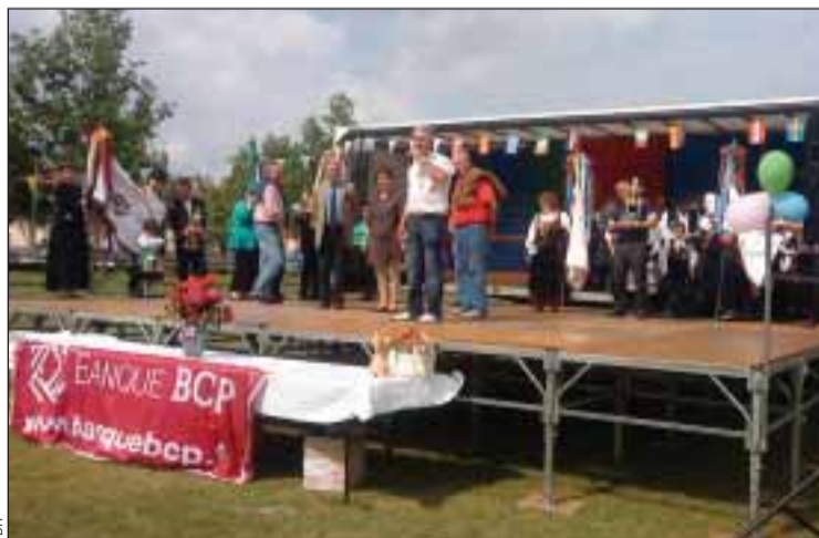
O tempo foi clemente e contribuiu para uma boa festa

Como habitualmente, encontravam-se presentes, a Maire de Meung-