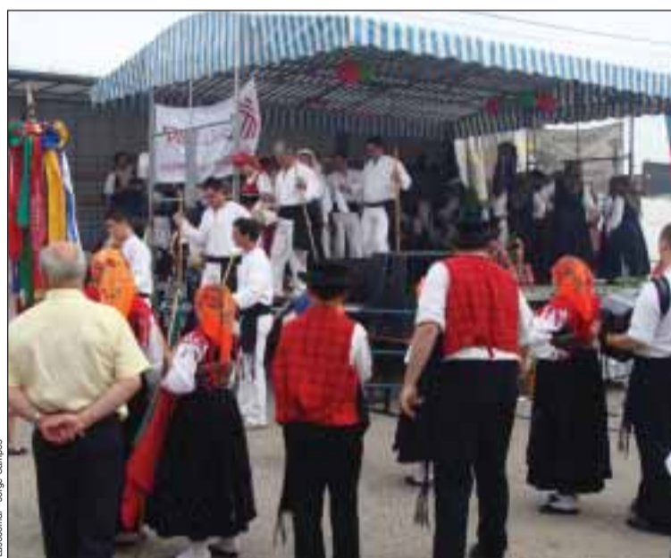
Foi momento de festa em Vaux-en-Vellin

A Associação Estrelas do Minho de Vaux-en-Vellin organizou o seu 28.º Festival de folclore com seis grupos de folclore vindos de vários pontos da região Rhône-Alpes e da região de Paris.