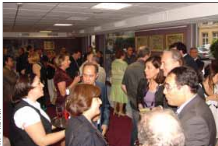
Recepção do 10 de Junho no Consulado de Portugal em Lyon

"Pensei que era importante receber aqui, na Casa de Portugal, e neste Dia nacional de Portugal, dia simbólico, todos estes representantes de instituições e de países nos-