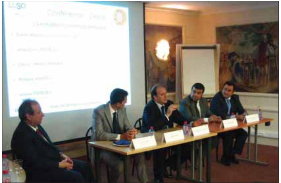
Conferência-Debate organizado pela LusoForum no quadro do 10 de junho