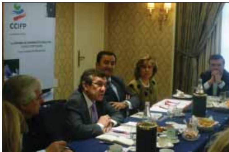
Pequeno almoço no Hotel Prince de Galles

mucho nos últimos anos, é um país que se modernizou e hoje tem atividades de ponta reconhecidas mundialmente" disse Fernando Serrasqueiro numa entrevista ao LusoJornal. O Secretário de Estado veio dizer aos empresários que invistam em Portugal, que contactem mais com Portugal. "Portugal está hoje na linha da frente no setor das energias renováveis, esta que é uma preocupação de muitos países. Ora Portugal tem hoje um conjunto de empresas que podem estabelecer parcerias, para trazer para aqui aquilo que tem sido os principais objetivos em termos energéticos" disse o Secretário de Estado.