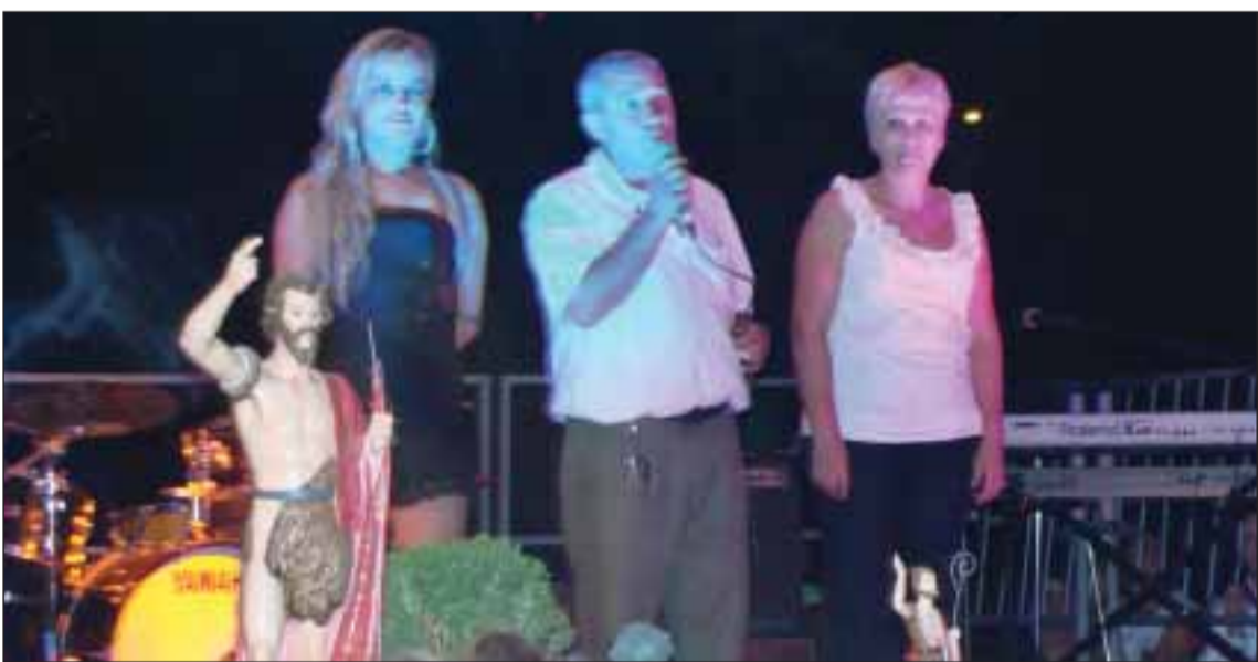
Discursos durante a Festa de S. João em Decines