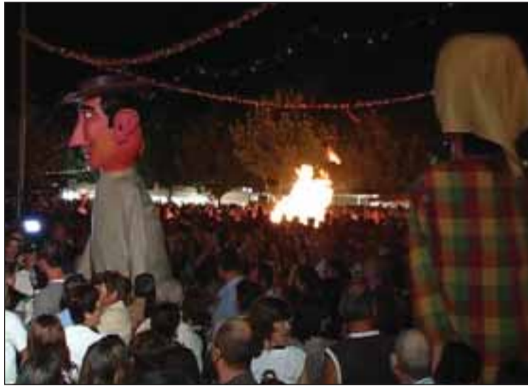
Muita gente no sábado à noite, em Clermont-Ferrand