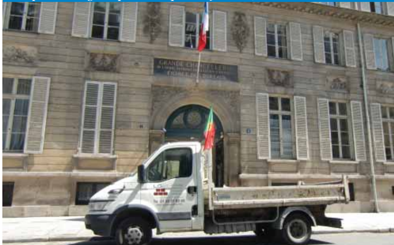
Os adeptos de Portugal em pleno Paris

Fête portugaise. Repas typiquement portugais et animations avec des groupes de folklore et Gérard Addat et ses danseuses brésiliennes. Animation dansante avec Paulo. Organisée par l'Association Dompierre Portugal. Salle Laurent Grillet, à Dompierre sur Besbre (03). Infos: 04.70.42.98.18.