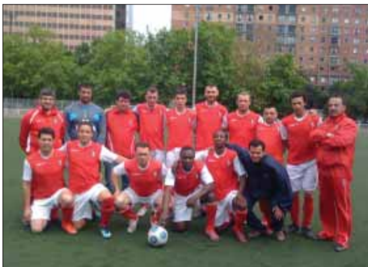
Minbotos de Braga