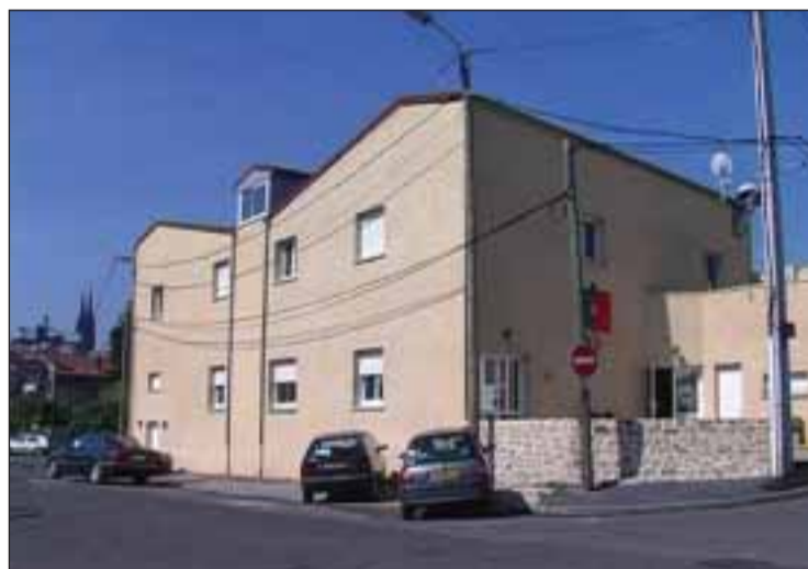
Casa de Portugal em Clermont-Ferrand