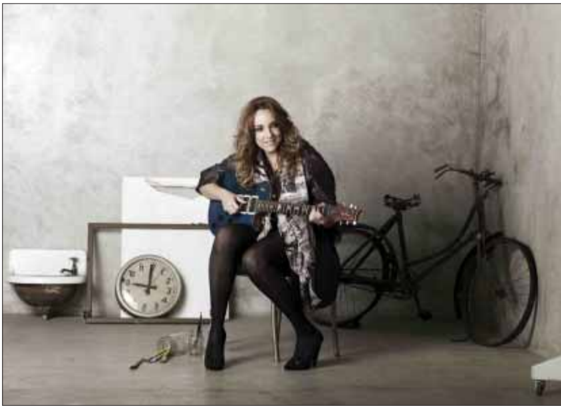
Ana Carolina em concerto no Cabaré Sauvage, em Paris

Filha de uma bailarina com um baterista de bossa nova e jazz, a gaúcha Adriana Calcanhoto começou a cantar profissionalmente em casas noturnas de Porto Alegre. Ainda nos anos 80, estreou espetáculos como "Batom", sucesso de público, e apresentou em Porto Alegre e São Paulo shows em homenagem à sua conterrânea mais célebre, Elis Regina. Nos anos 90, alcançou projeção nacional. Gravou "Enguiço", seu primeiro disco, em 1990, com o qual conquistou no mesmo ano o prêmio Sharp de revelação feminina. A ele, seguiu-se uma sólida carreira de vários álbuns e sucessos. A apresentação de Adriana Calcanhoto no Cabaret Sauvage faz parte da digressão europeia de "Trobar Nova".