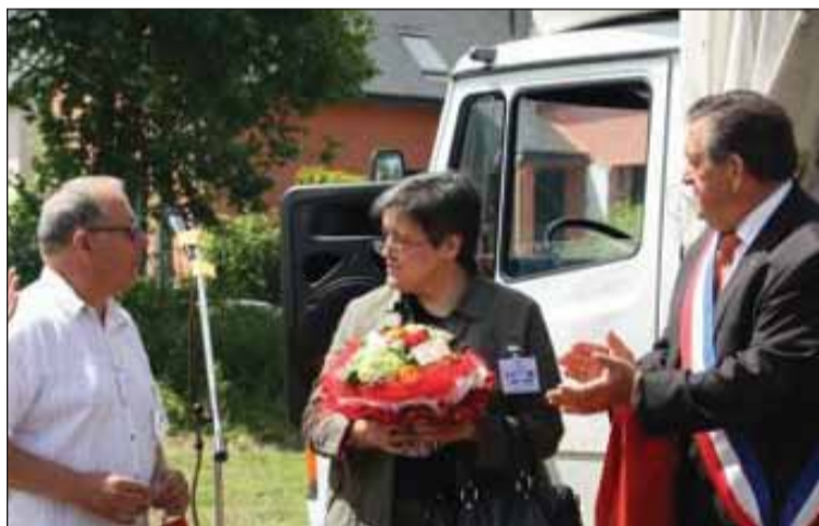
Vice-Cônsul de Portugal em Nantes esteve em Ploumagoar