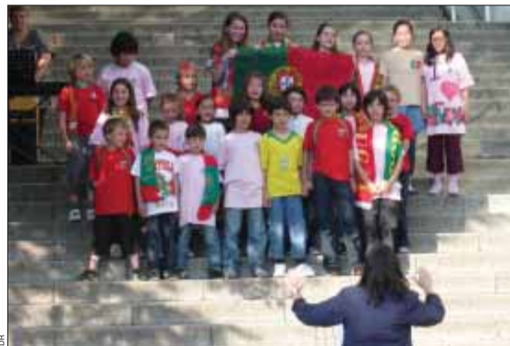
Alunos da Secção portuguesa cantam em Saint Germain-en-Laye

Este encontro entre os jovens cantores da nossa escola permite aos alunos mostrarem uns aos outros, aos pais e aos professores o que foram aprendendo, can- tando e ensaiando ao longo do ano. Há que salientar o contri- buto da área de educação e ex- pressão musical para o desenvol- vimento integral e global da criança que é hoje inquestioná-