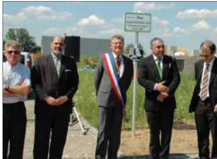
Inauguration de la rue Amália Rodrigues