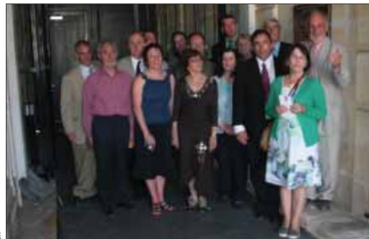
Comitiva na entrada do Consulado Geral de Portugal em Bordeaux

Desta vez, juntaram-se à delegação uma senhora salva por Aristides de Sousa Mendes, na altura com 16 anos e o filho de um casal também salvo.